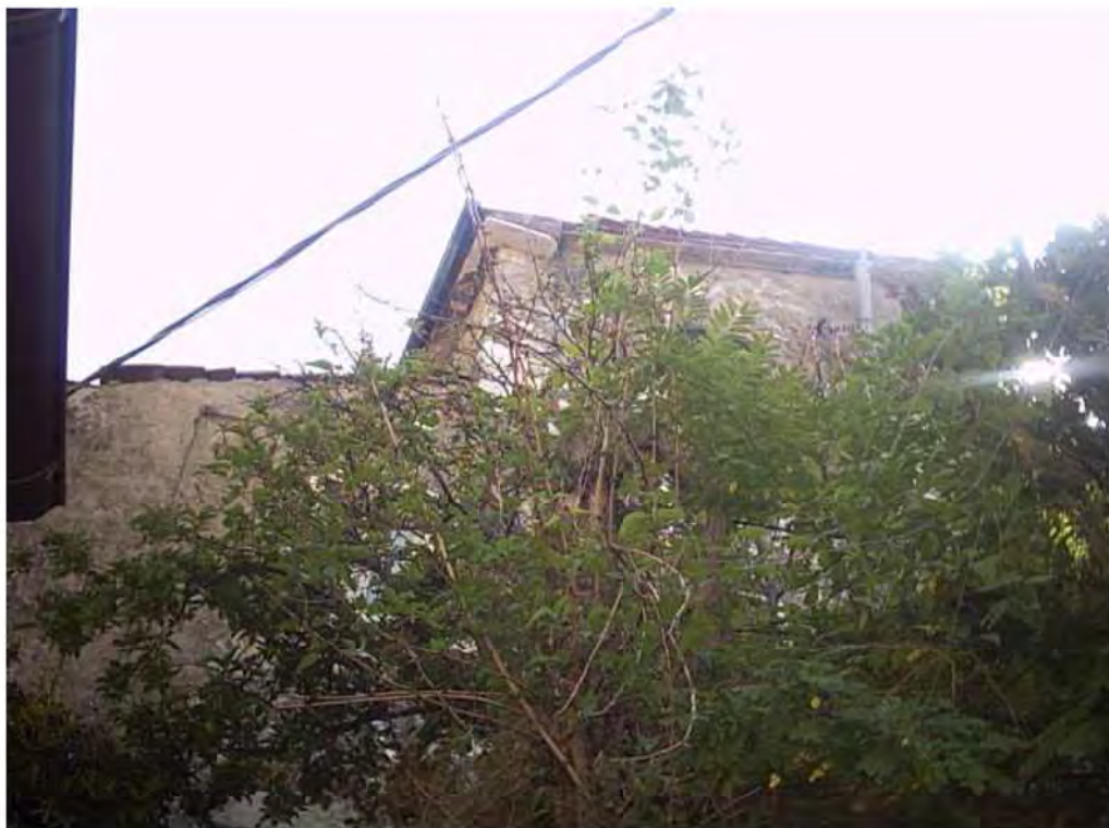
PARTICOLARE GRONDA IN MARMO