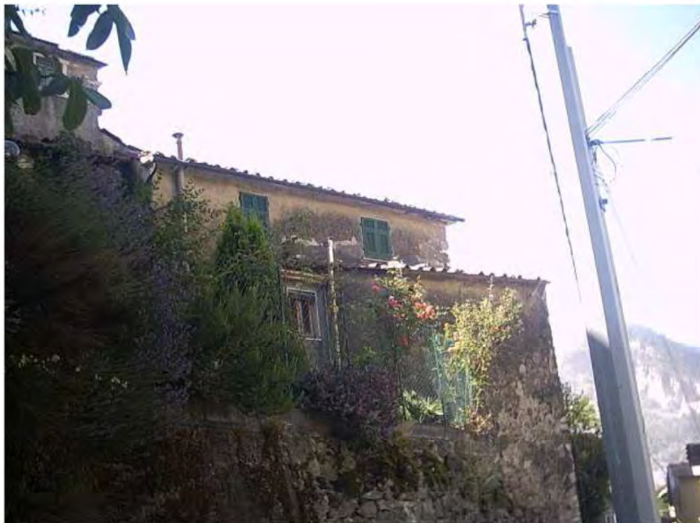
PROSPETTO NORD DA VIA FONTANA