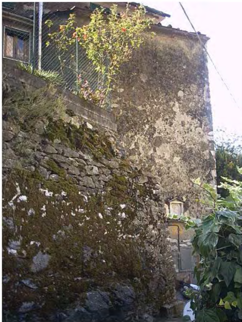
PROSPETTO NORD SU VIA FONTANA