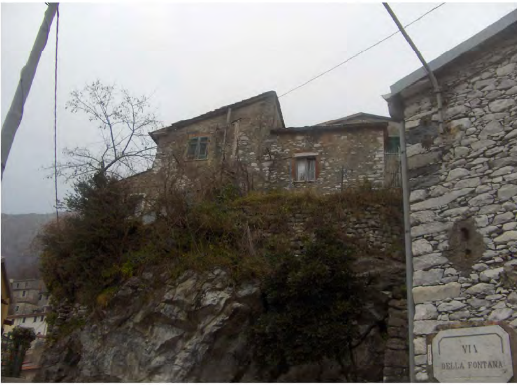
PROSPETTO OVEST DA VIA DELLA FONTANA