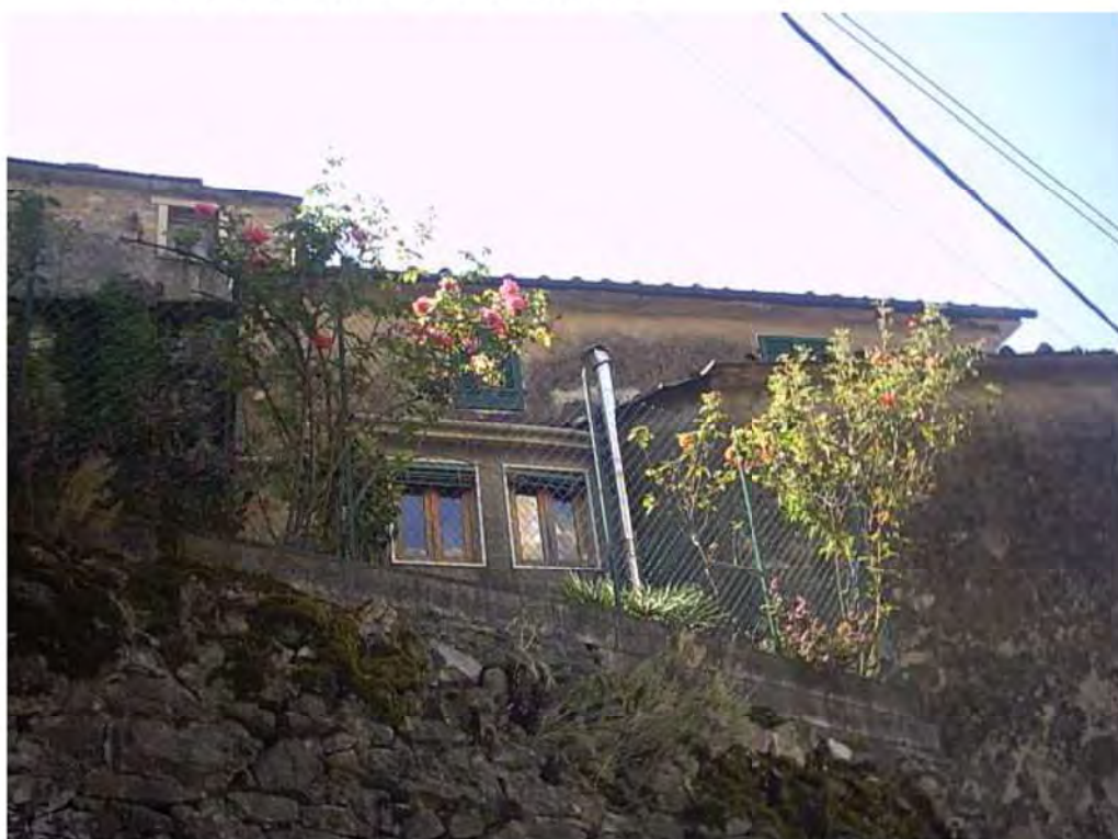
PROSPETTO NORD DA VIA FONTANA -DETTAGLI-