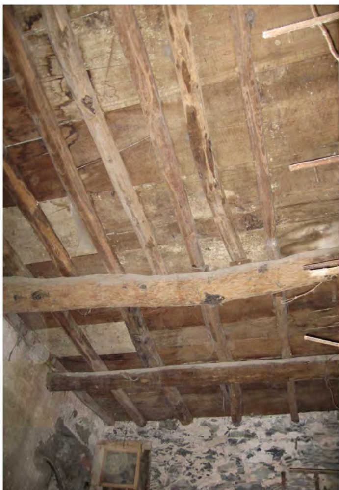
SOLAIO PIANO TERRENO (TIPO)