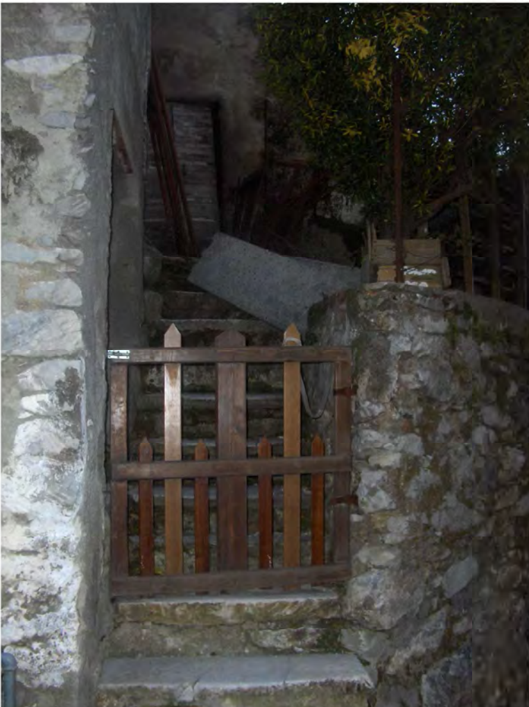
VISTA SCALA ESTERNA SU VIA FONTANA