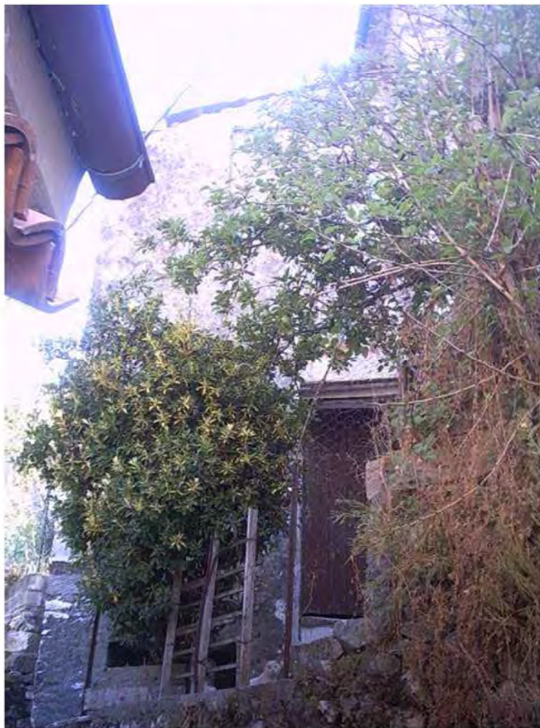
INGRESSO LATO NORD