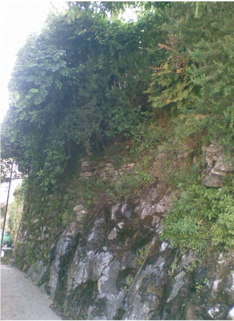
VISTA MURO ESTERNO SU VIA FONTANA