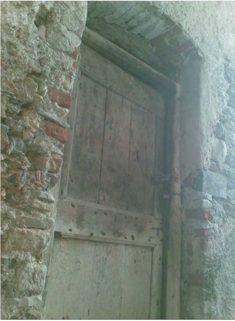
PORTONE BAGNO ESTERNO (ACCESSORIO)