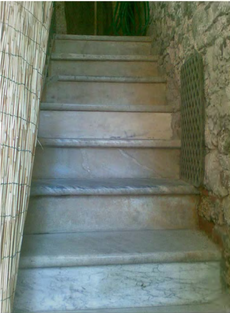
SCALA INTERNA IN MARMO