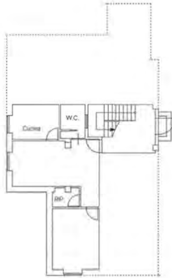
Pianta Piano Terra h = ml. 2.70