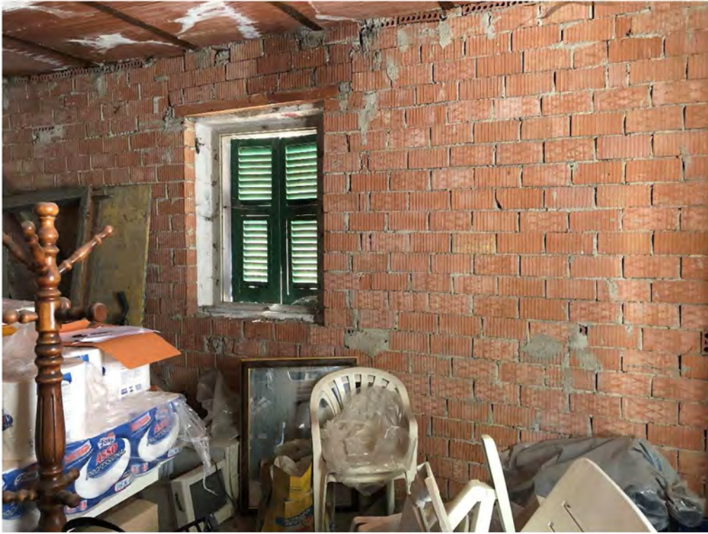
Foto 5 - Vista interna piano terra