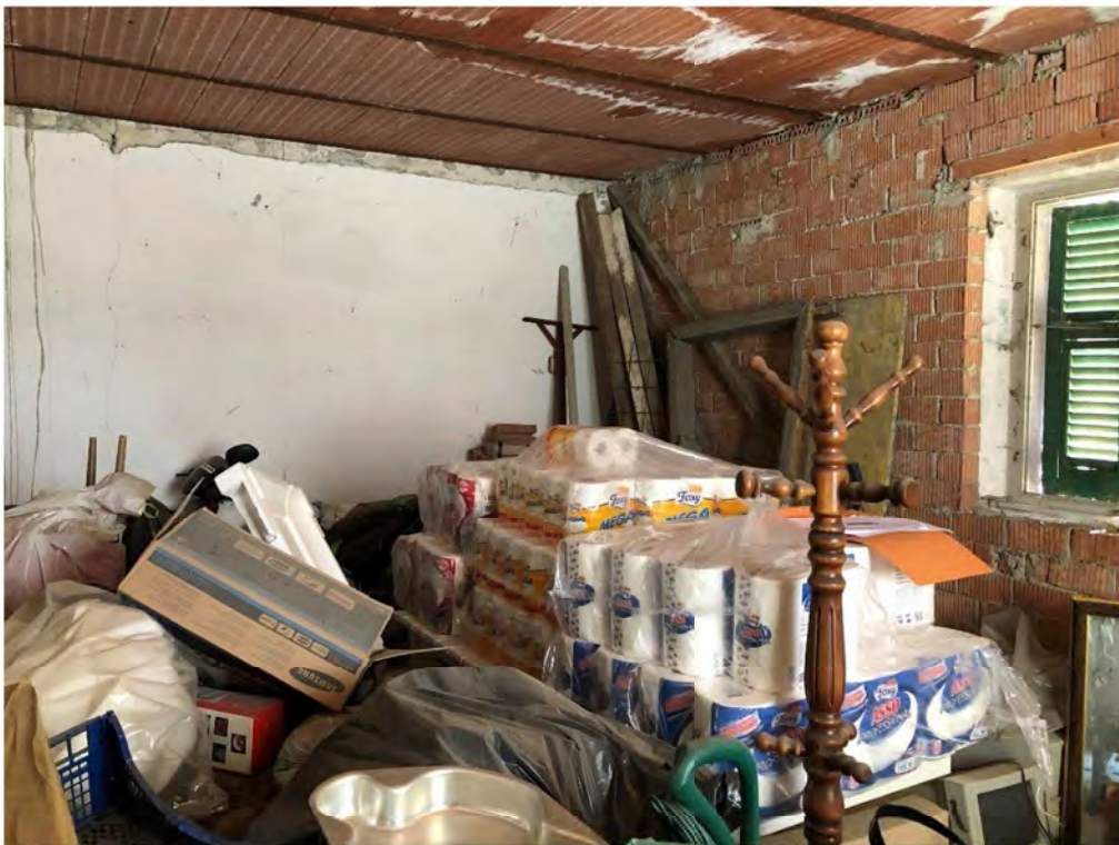
Foto 6 - Vista interna piano terra