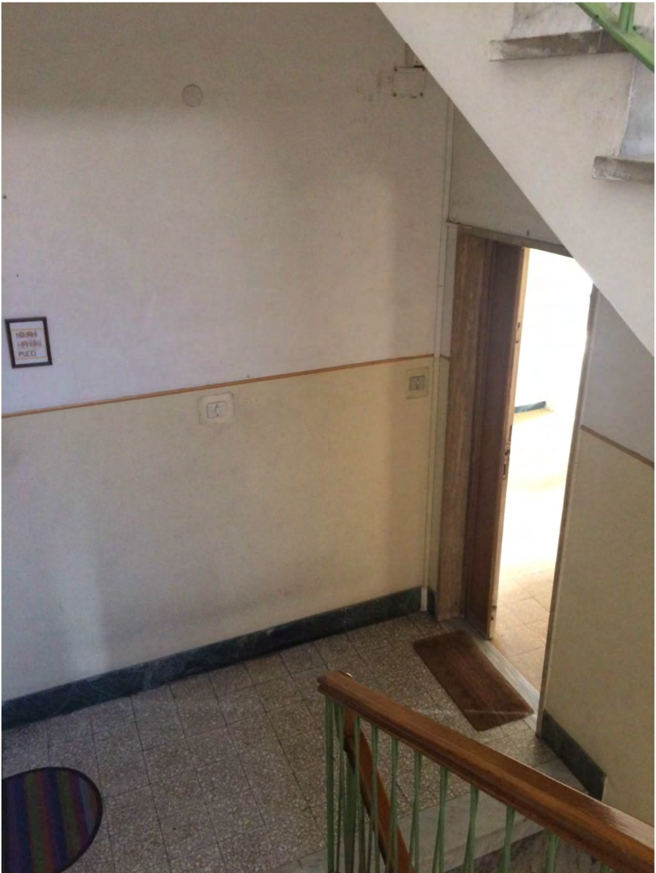
Foto 1 – Pianerottolo di ingresso all'appartamento pignorato (piano quarto), interno 6.