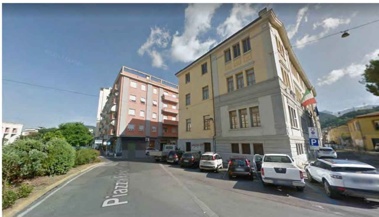
Foto A - Veduta del Condominio di cui fa parte l'appartamento pignorato, vista da Largo Matteotti