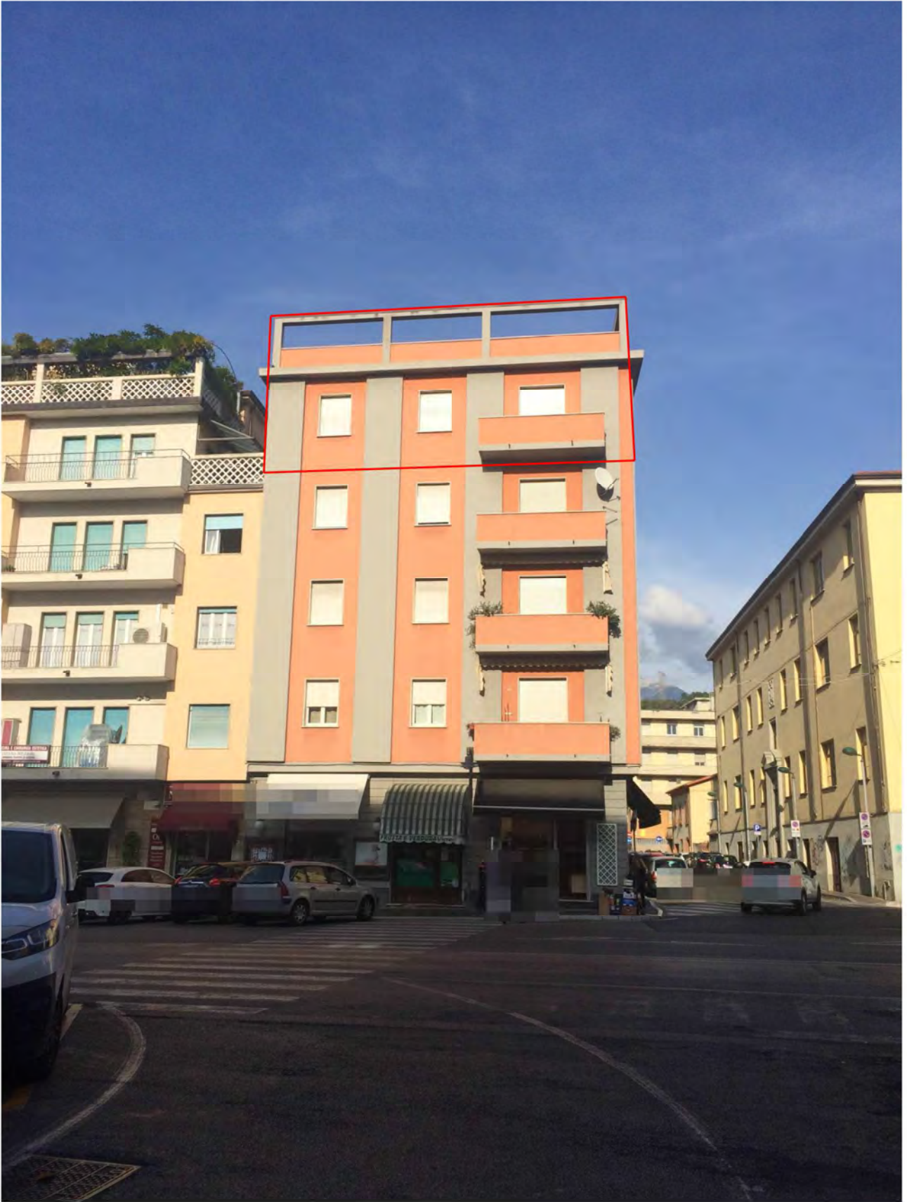
Foto B - Veduta da Largo Matteotti