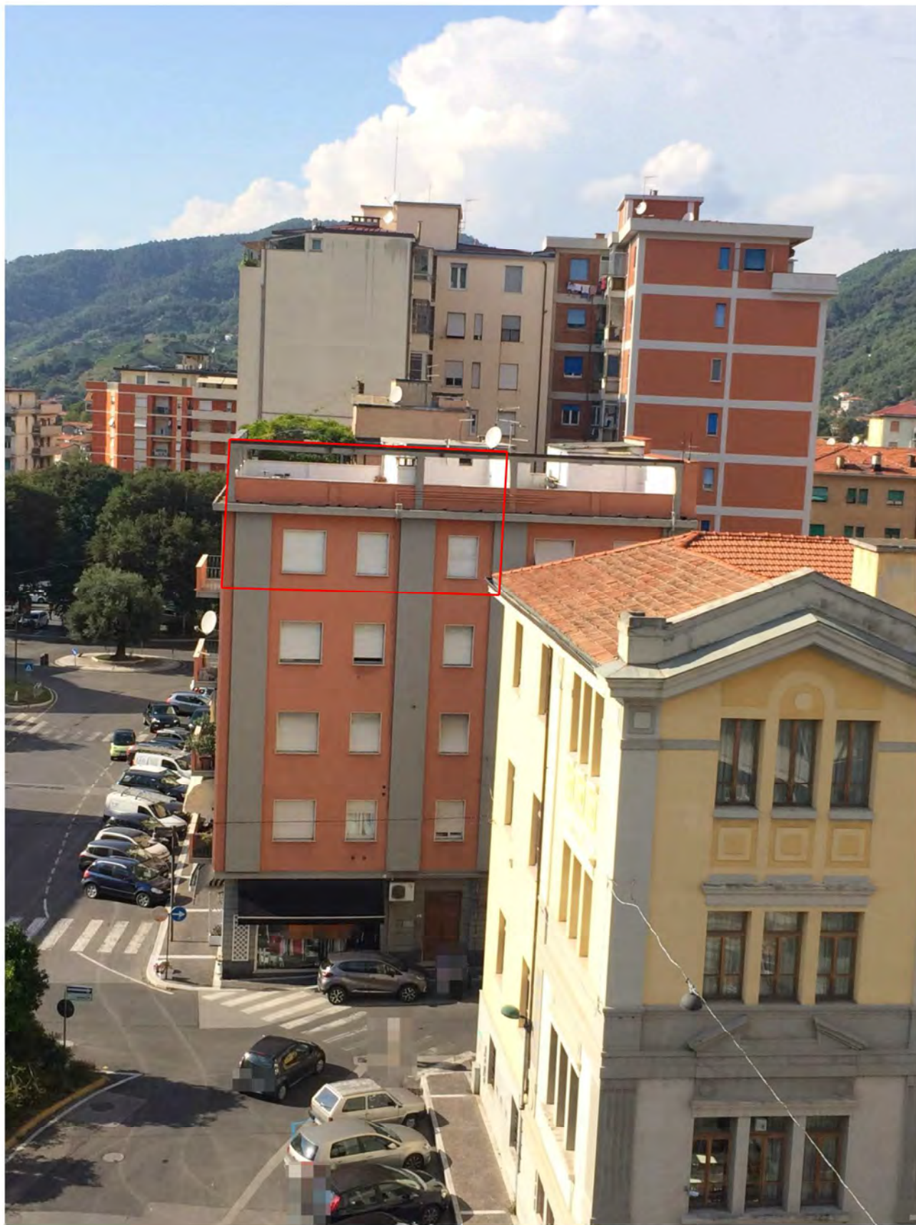
Foto C - Veduta panoramica prospetto lato Carrara