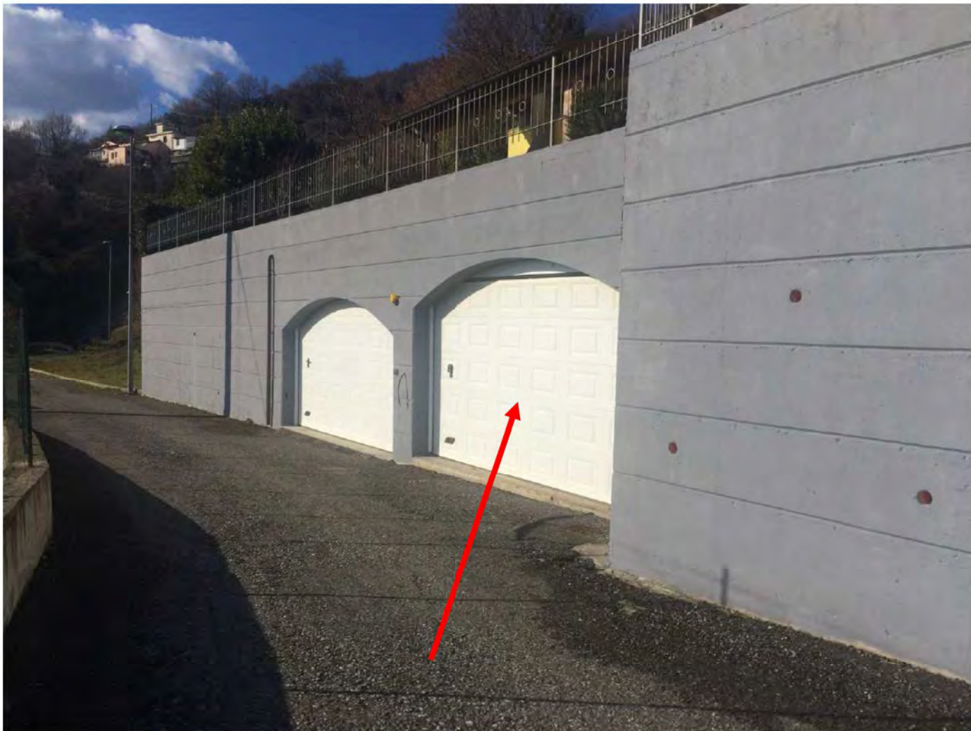
FOTO 97: VISTA ESTERNO – GARAGE DI PROPRIETA' (PRIMA PORTA BIANCA)