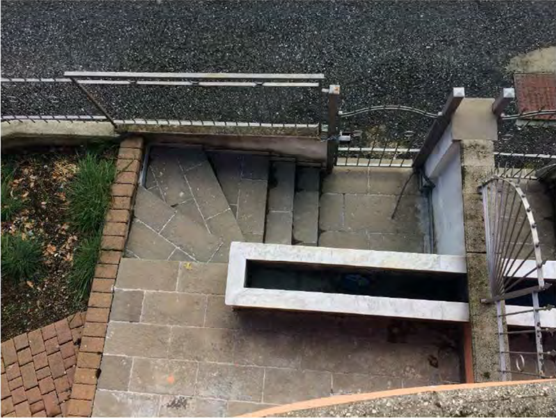
FOTO 41: CANCELLO PEDONALE E SCALE ESTERNE DI ACCESSO AL PIANO PRIMO SOTTOSTRADA