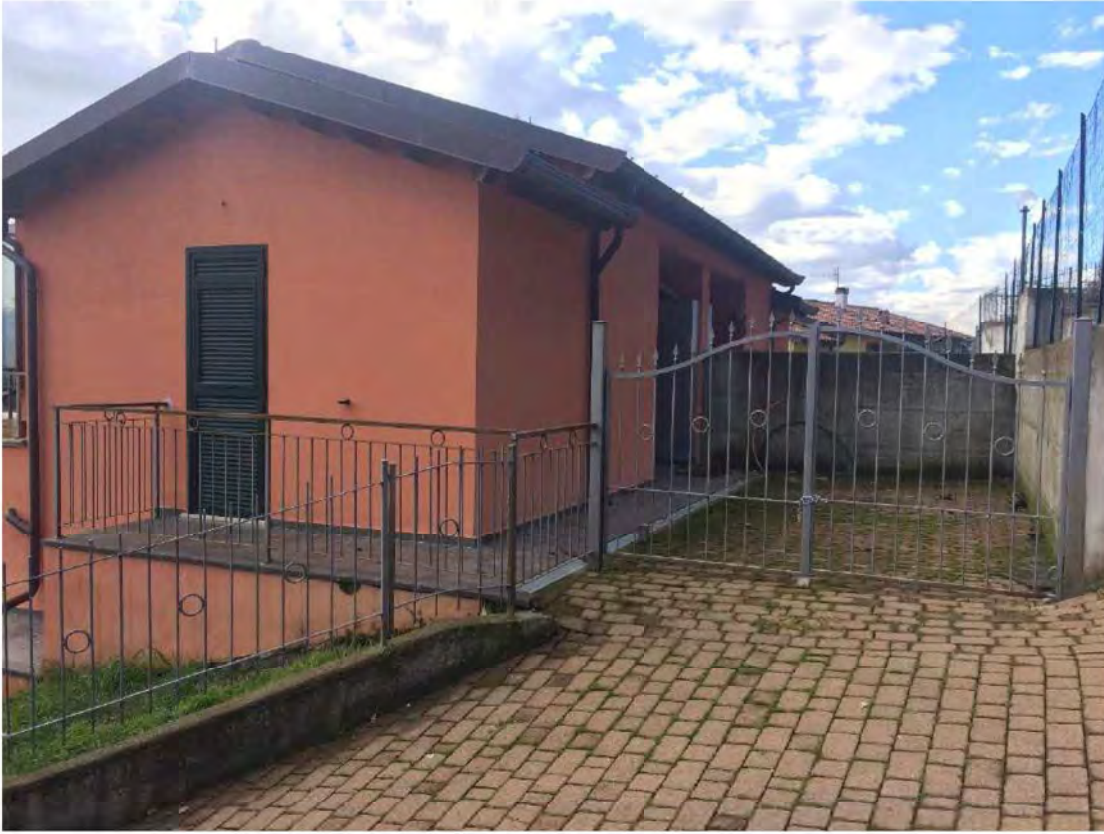
FOTO 35: PROSPETTO ESTERNO -CANCELLO GARRABILE DI ACCESSO AL LOTTO