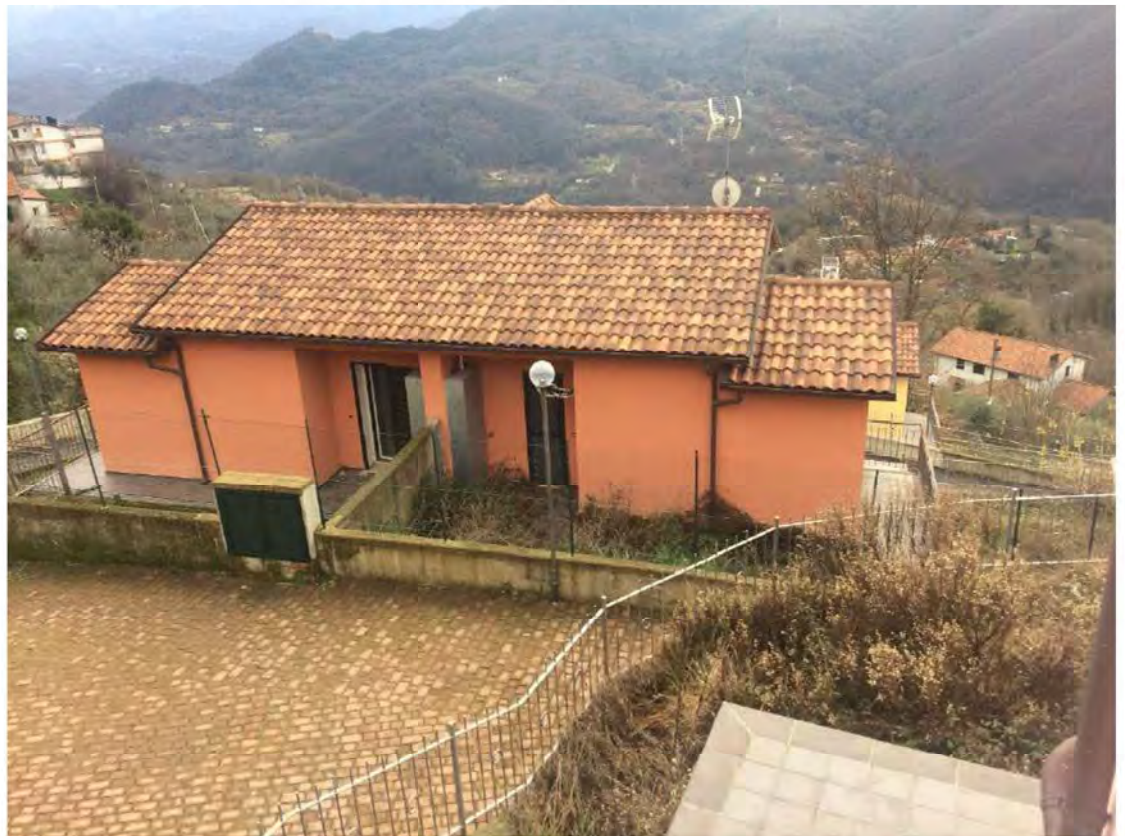
FOTO 38: VEDUTA DALL'ALTO. LOTTO 3: PORZIONE DI BIFAMILIARE A SINISTRA