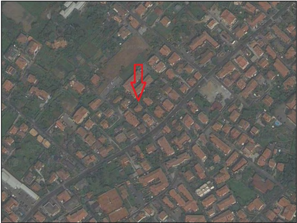
Vista area – Via San Leonardo, 252 Marina di Massa (MS)