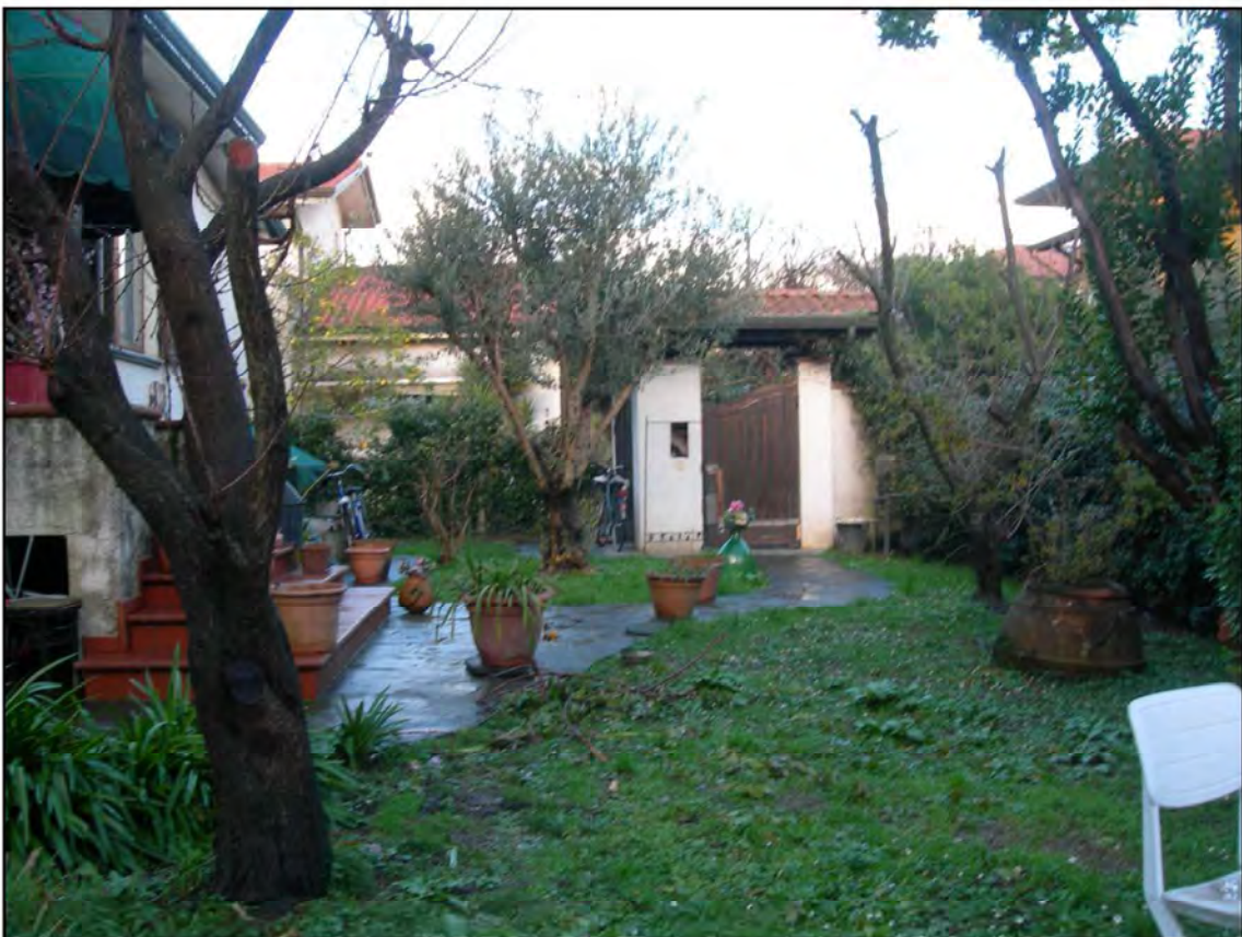
La corte pertinenziale di fronte all'ingresso