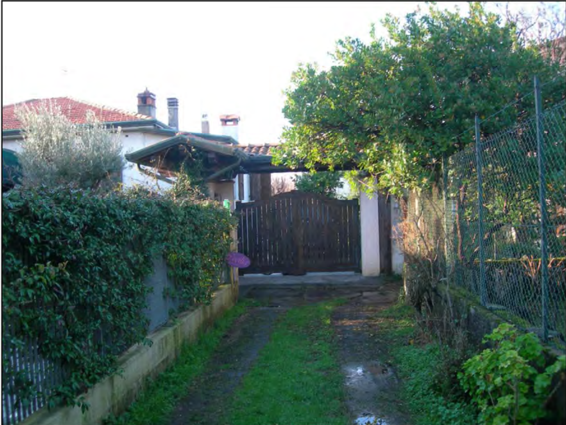
Vialetto di ingresso all'immobile