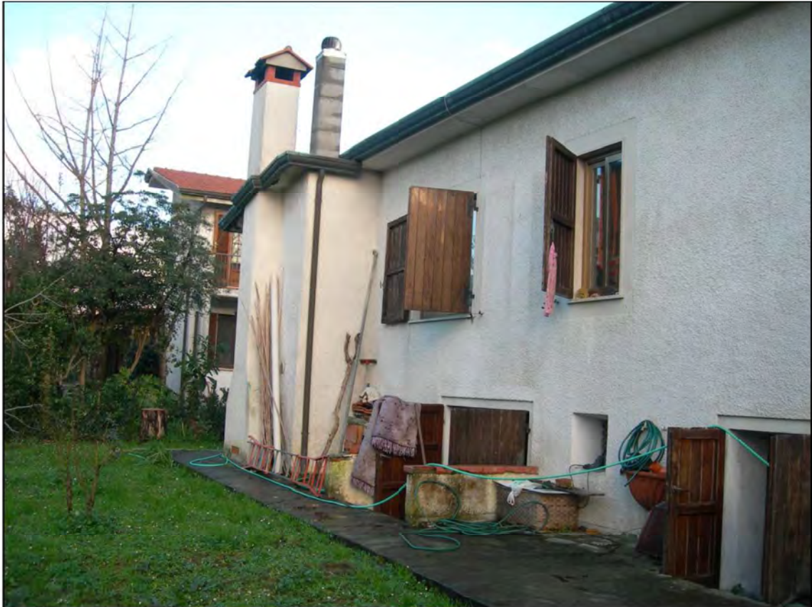
Il retro dell'immobile