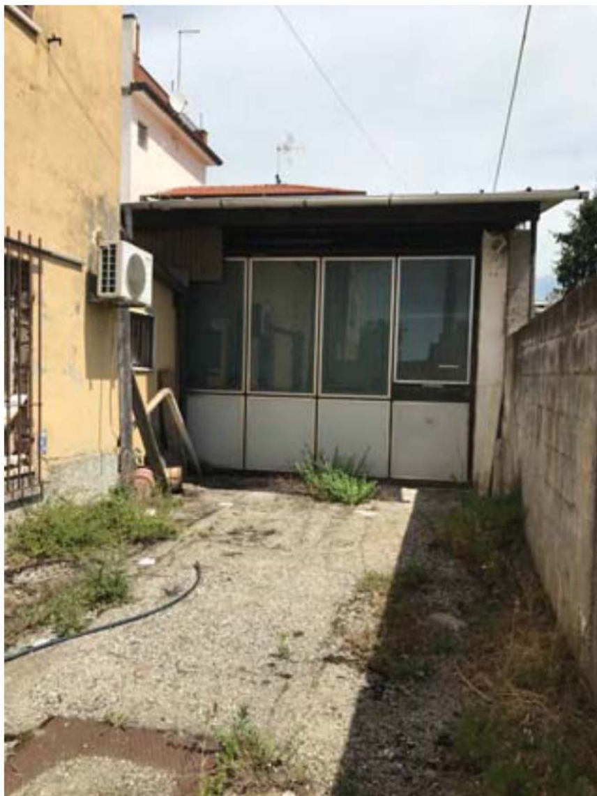
Foto E1: Via Provinciale Avenza Sarzana. Esterno, cortile di pertinenza.