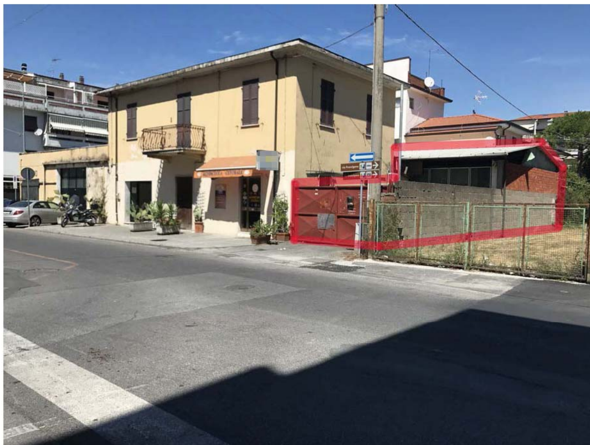
Foto Fabbricato dall' esterno: Via Provinciale Avenza Sarzana. Lato Sud-Est (In rosso il lotto del laboratorio).