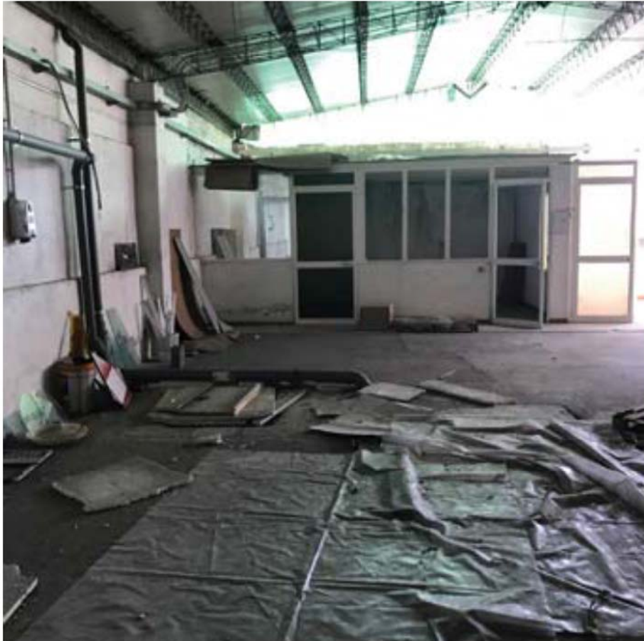
Foto 8: Via Provinciale Avenza-Sarzana. Zona laboratorio, box uffici-esposizione.