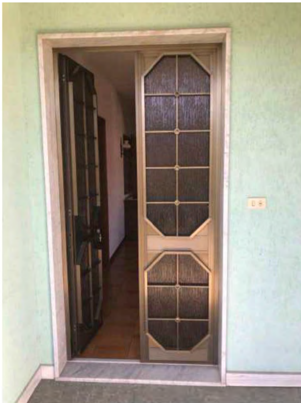
Foto 2: Marina di Massa, Massa (MS). Lotto 002. Piano primo. Ingresso abitazione lato Nord.