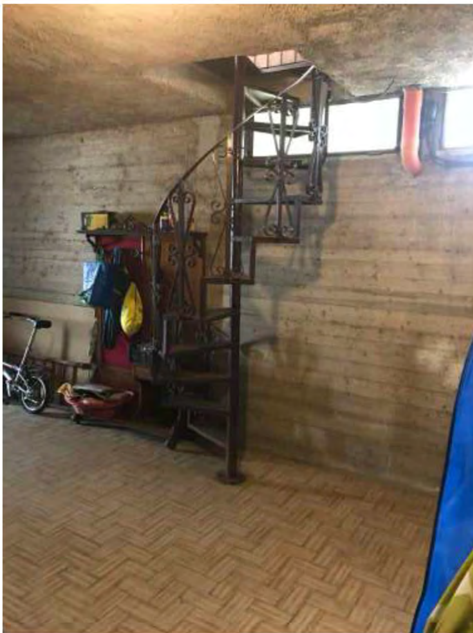
Foto 14: Marina di Massa, Massa. Lotto 001. Piano seminterrato. Scala interna di collegamento.