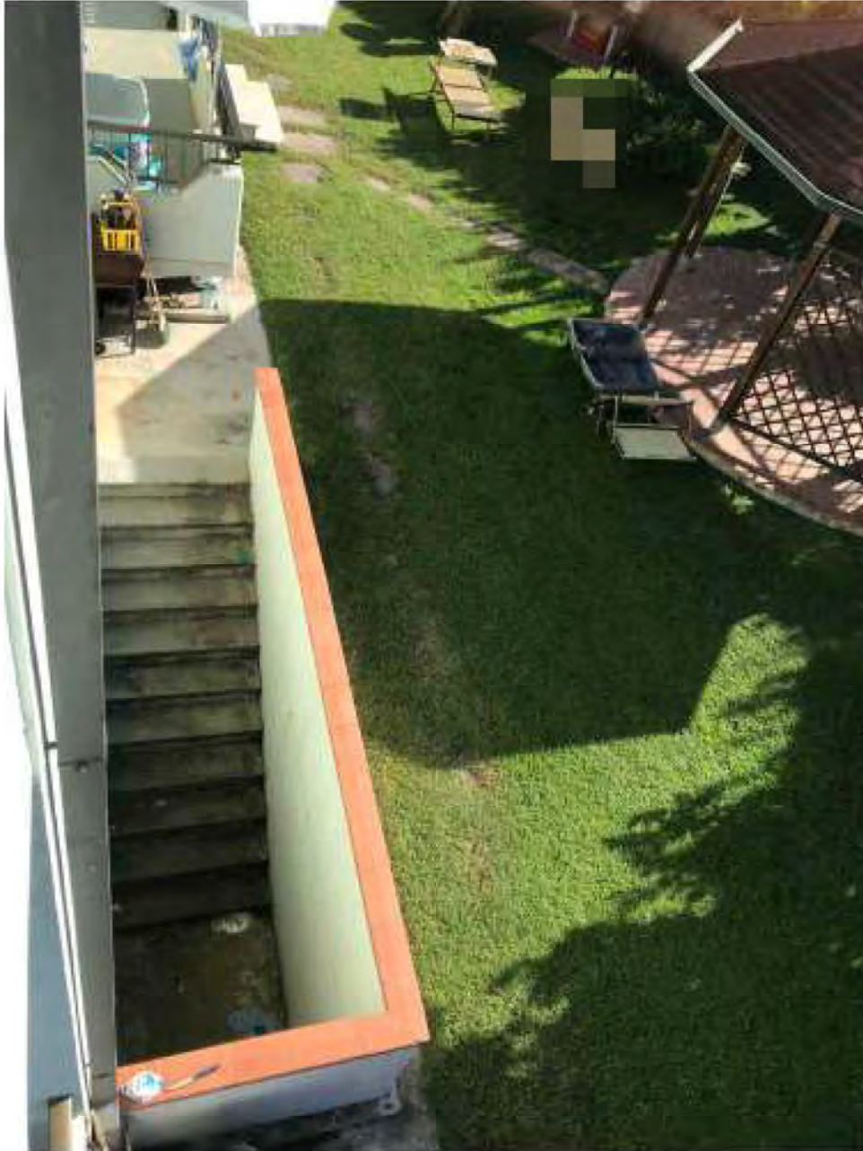
Foto E5: Marina di Massa, Massa. Lotto 002. Esterno. Accesso centrale termica.