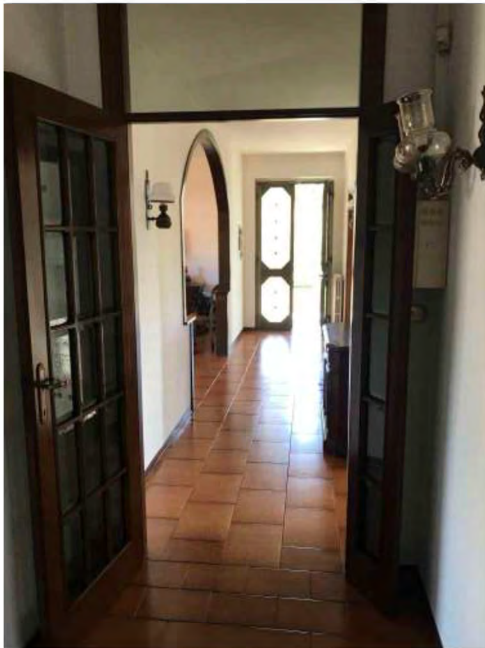
Foto 9: Marina di Massa, Massa (MS). Lotto 002. Piano primo. Corridoio-disimpegno.