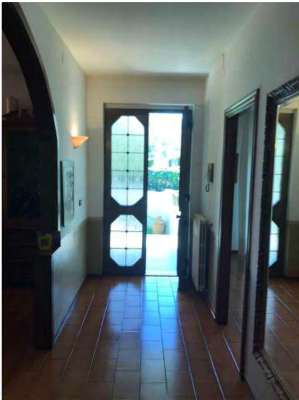
Foto 5: Marina di Massa, Massa (MS). Lotto 001. Piano terra. Disimpegno lato ingresso abitazione.