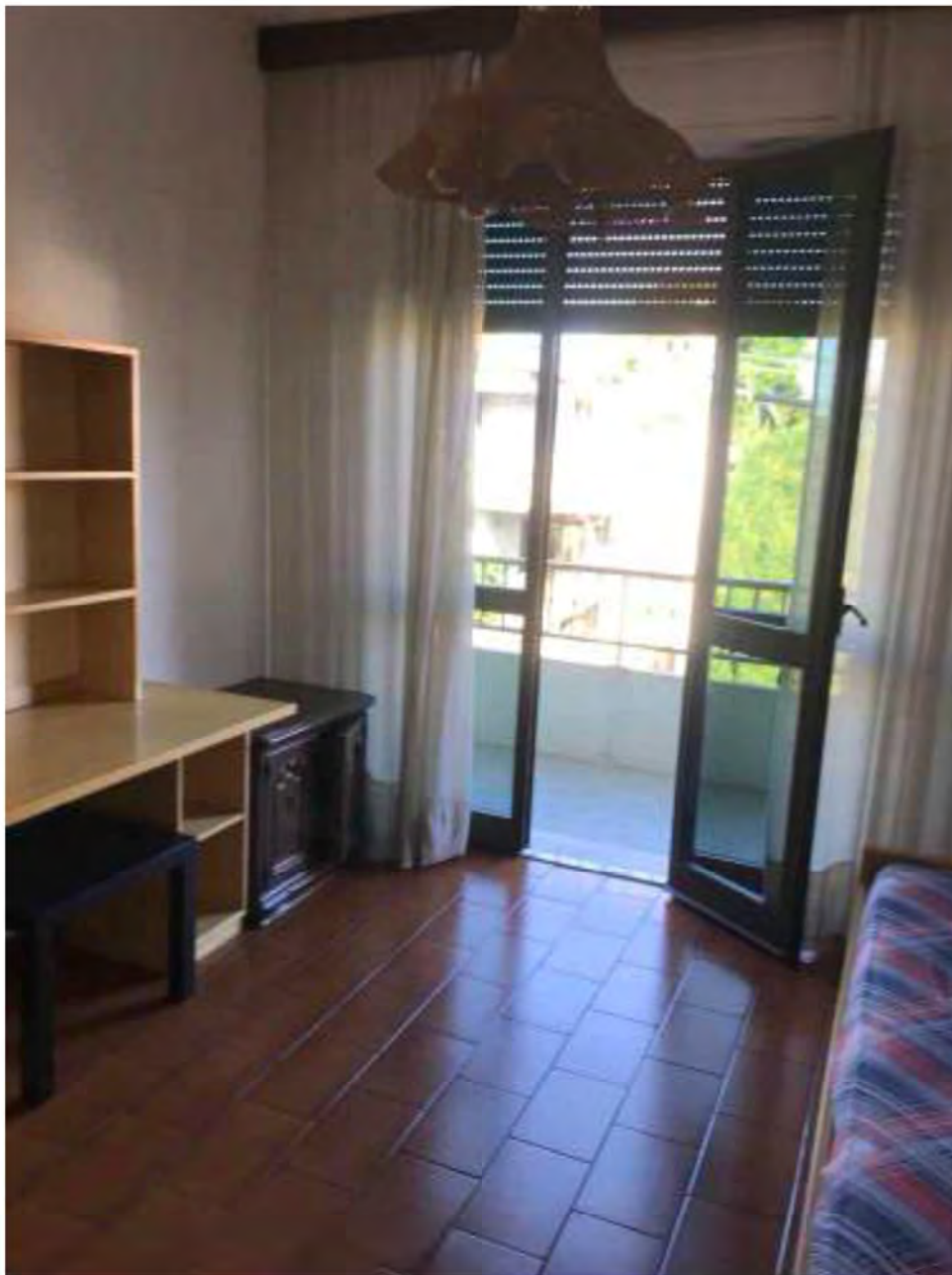
Foto 14: Marina di Massa, Massa. Lotto 002. Piano primo. Camera 2.