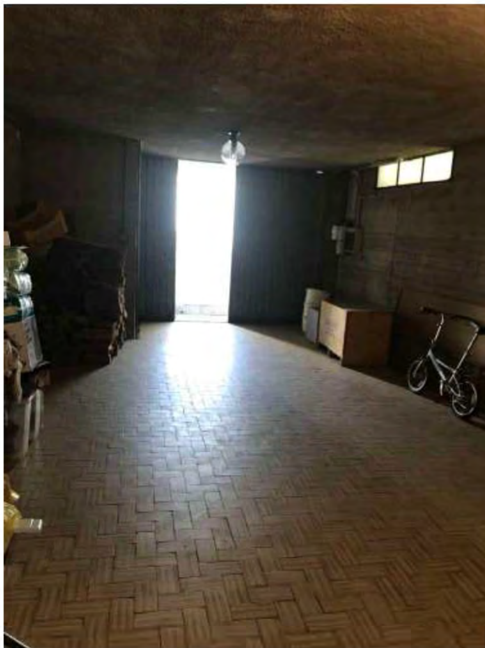
Foto 13: Marina di Massa, Massa. Lotto 001. Piano seminterrato. Ingresso livello interrato.