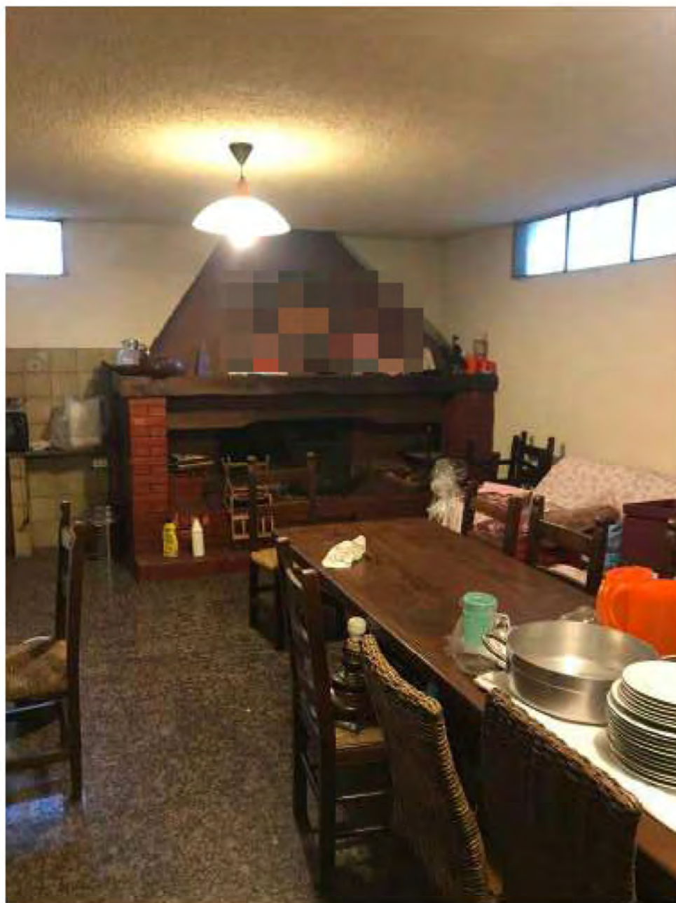
Foto 16: Marina di Massa, Massa. Lotto 001. Piano seminterrato. Tavernetta.