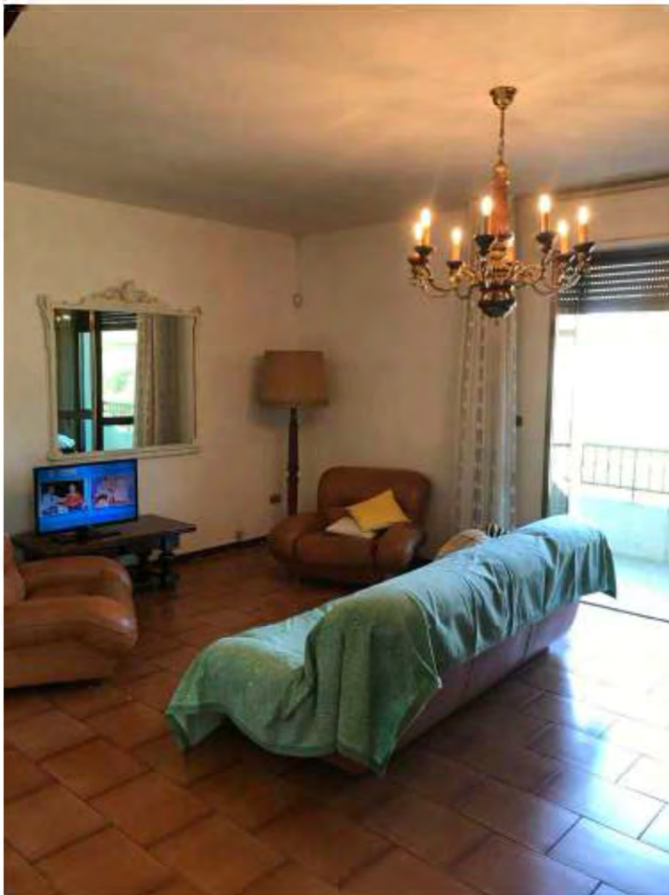
Foto 4: Marina di Massa, Massa (MS) Lotto 002. Piano primo. Soggiorno.