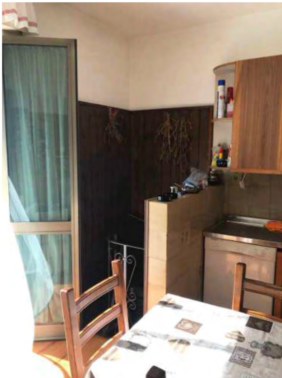
Foto 2: Marina di Massa, Massa (MS). Lotto 001. Piano terra. Cucina con scala di accesso al piano Interrato.