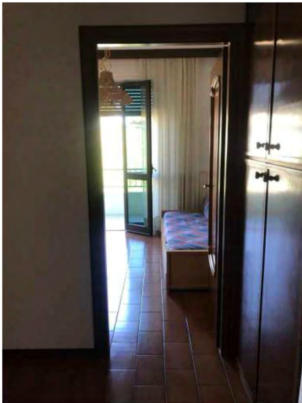
Foto 15: Marina di Massa, Massa. Lotto 002. Piano primo. Disimpegno.