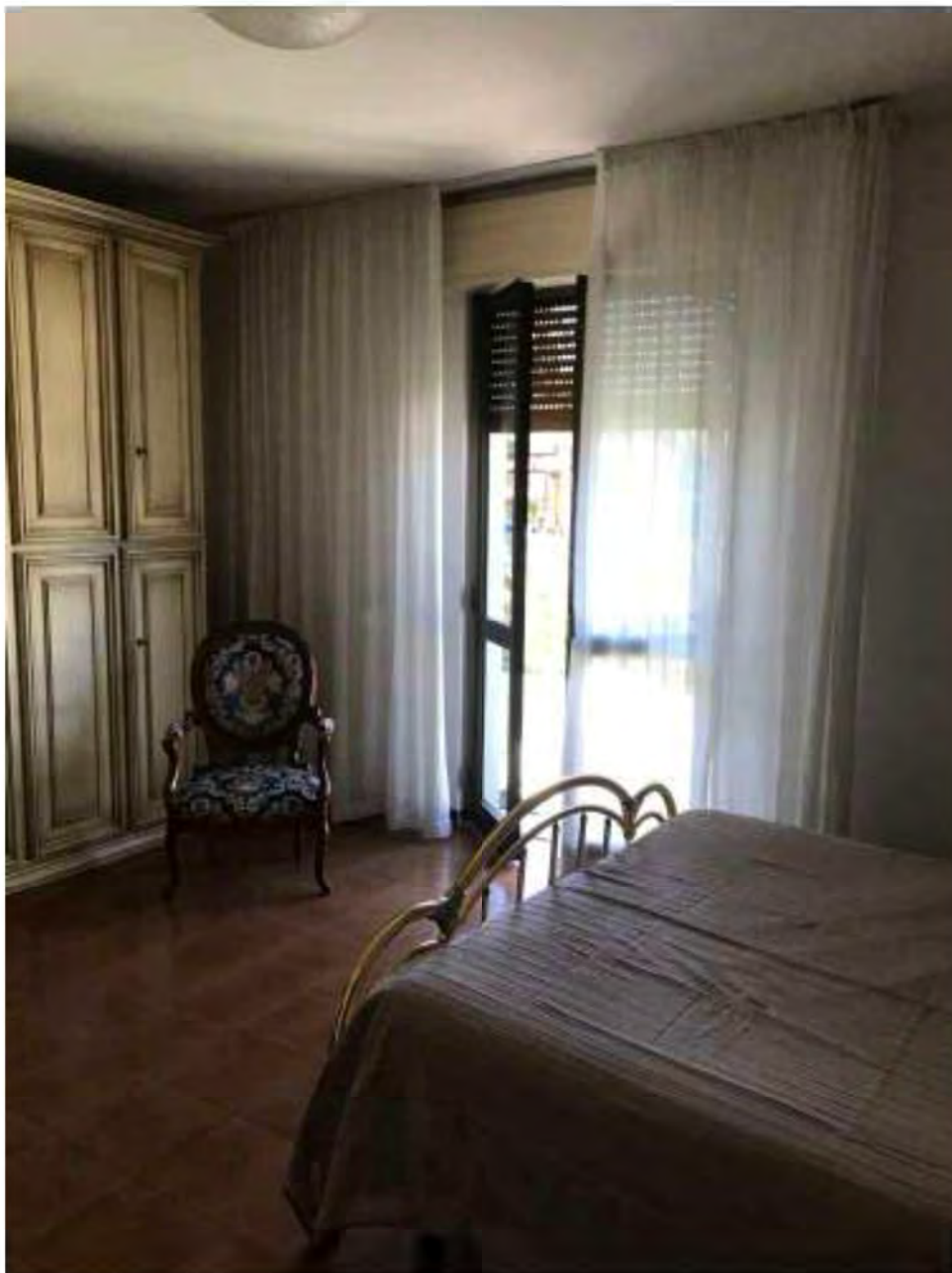
Foto 12: Marina di Massa, Massa. Lotto 001. Piano terra. Camera 2.