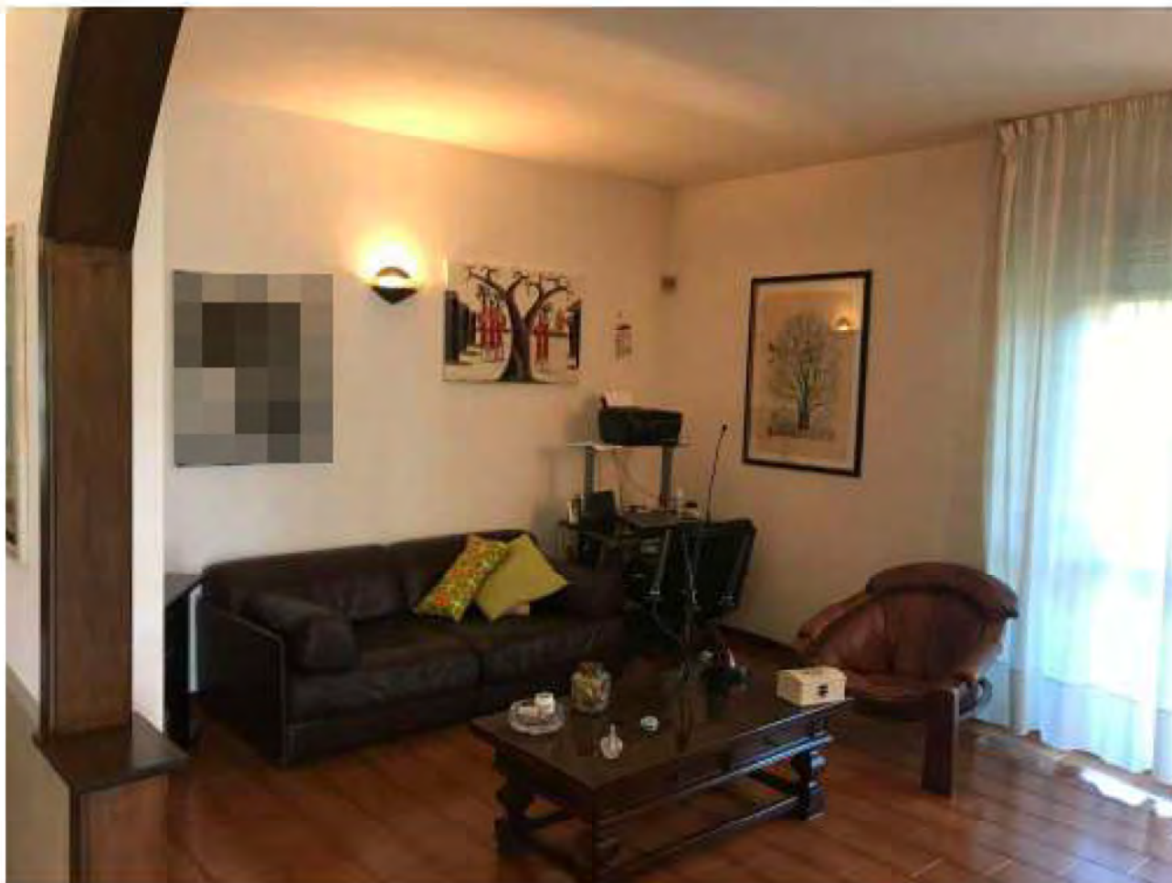
Foto 7: Marina di Massa, Massa (MS) Lotto 001. Piano terra. Soggiorno.