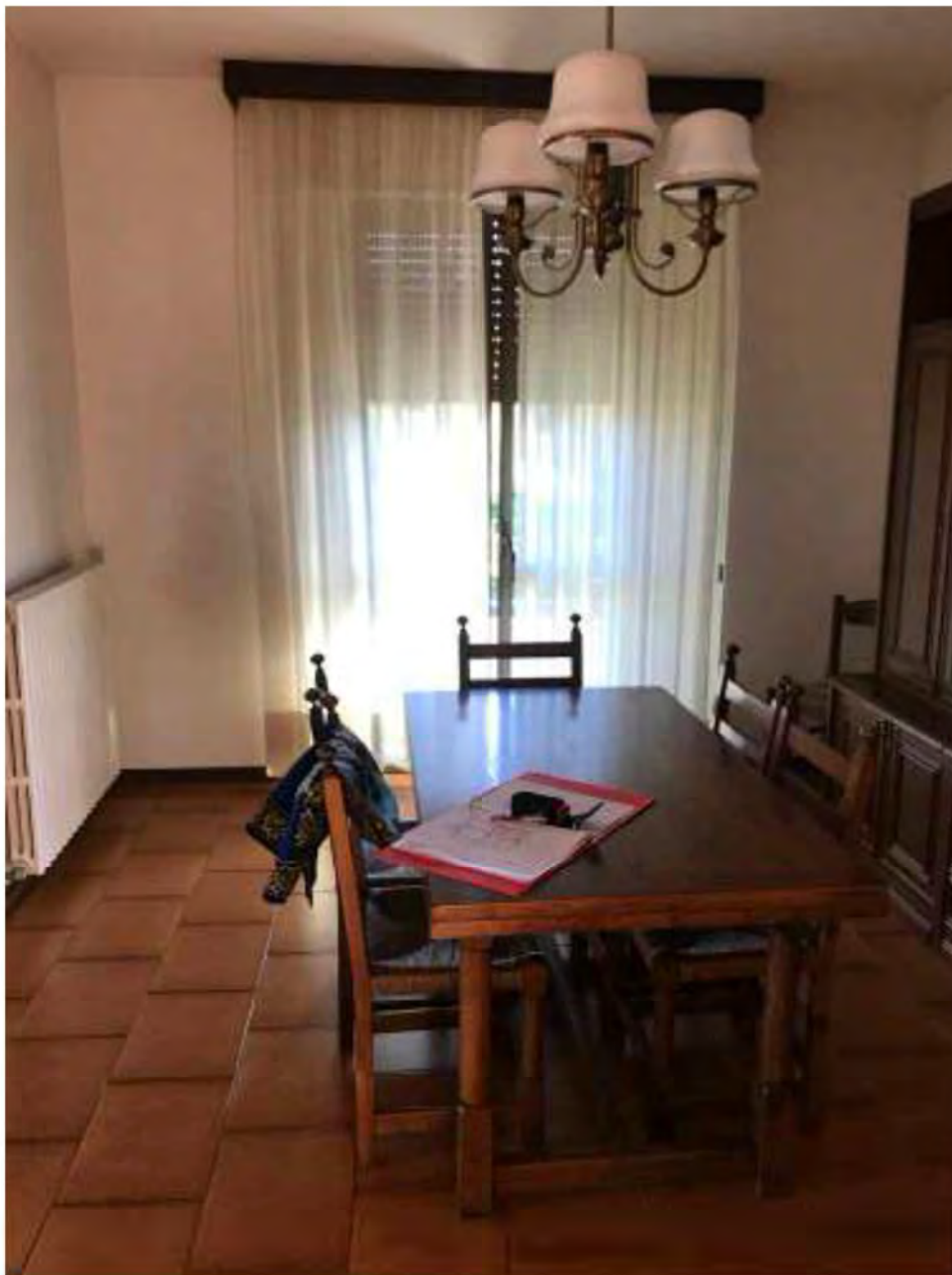
Foto 6: Marina di Massa, Massa. Lotto 002. Piano primo. Sala da pranzo.