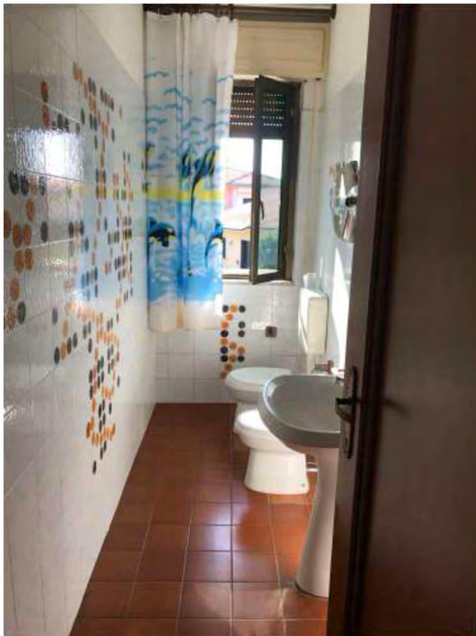
Foto 8: Marina di Massa, Massa. Lotto 002. Piano primo. Bagno di servizio.