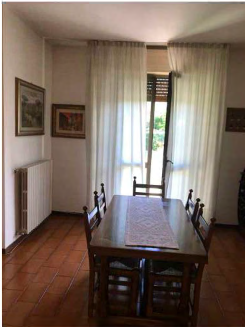
Foto 4: Marina di Massa, Massa (MS) Lotto 001. Piano terra. Sala da pranzo.