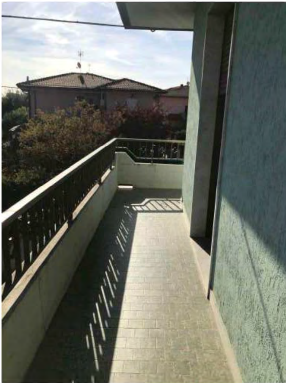
Foto 3: Marina di Massa, Massa (MS) Lotto 002. Piano primo. Terrazza lato nord.