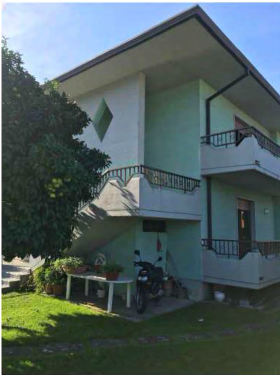
Foto E1: Marina di Massa, Massa (MS). Lotto 002. Esterno Abitazione angolo nord-ovest.