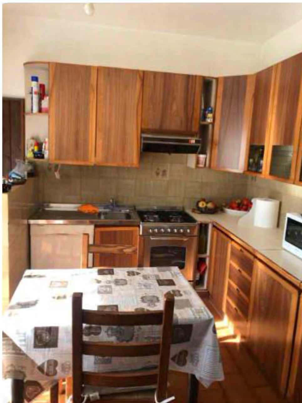
Foto 3: Marina di Massa, Massa (MS) Lotto 001. Piano terra. Cucina.