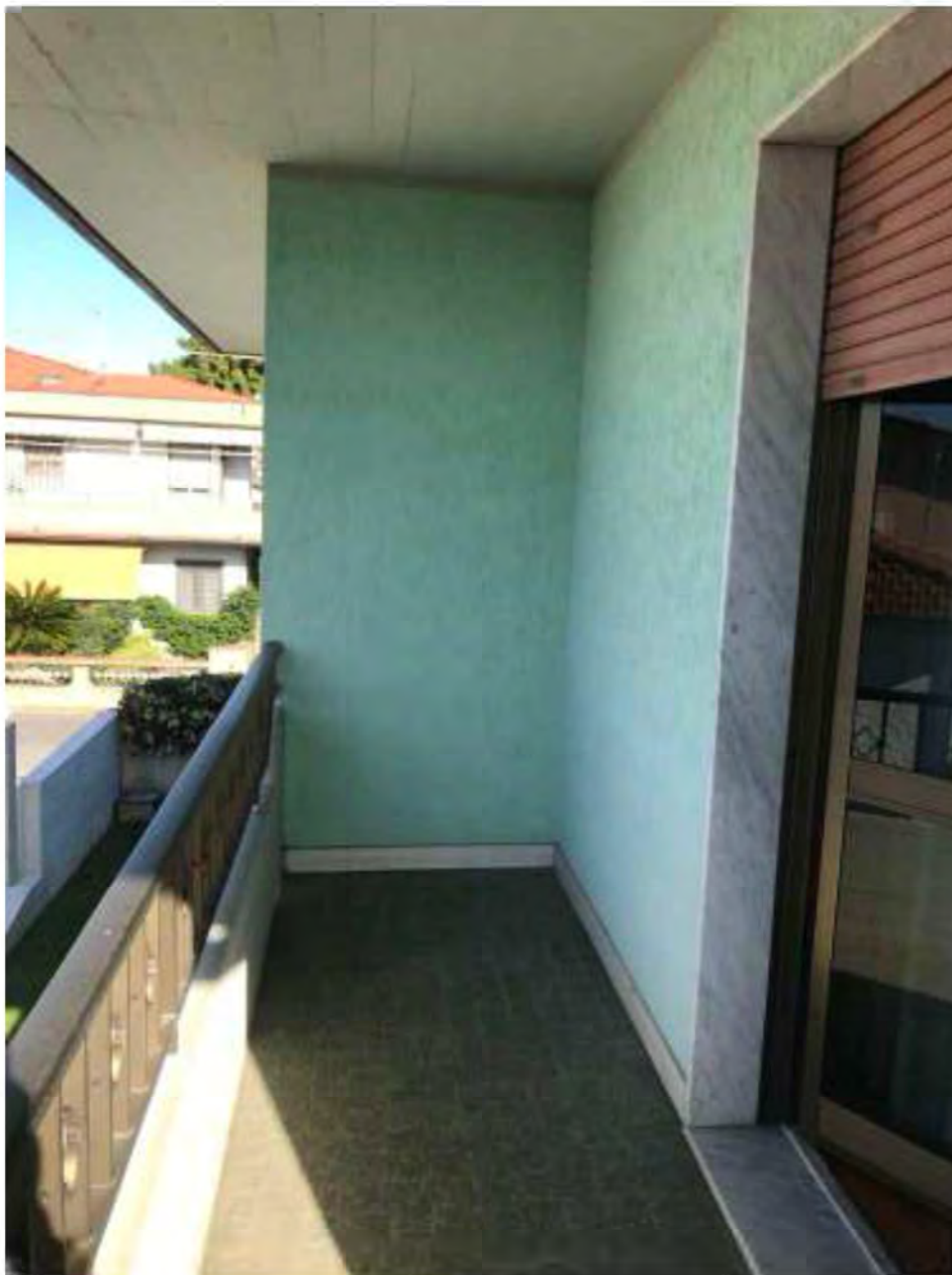
Foto 12: Marina di Massa, Massa. Lotto 002. Piano primo. Terrazza pertinenziale camera 1 lato sud.