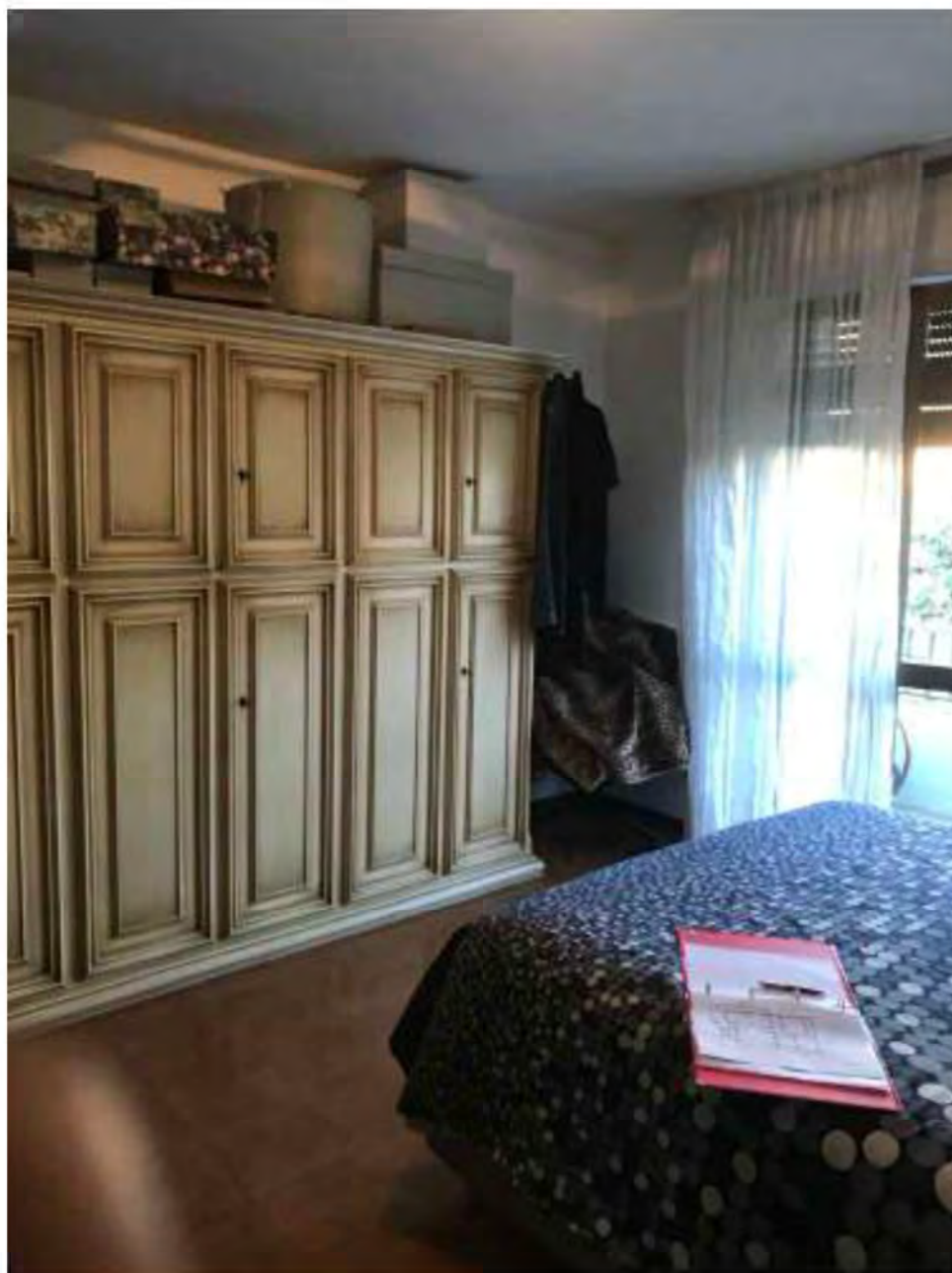
Foto 9: Marina di Massa, Massa (MS). Lotto 001. Piano terra. Camera 1.