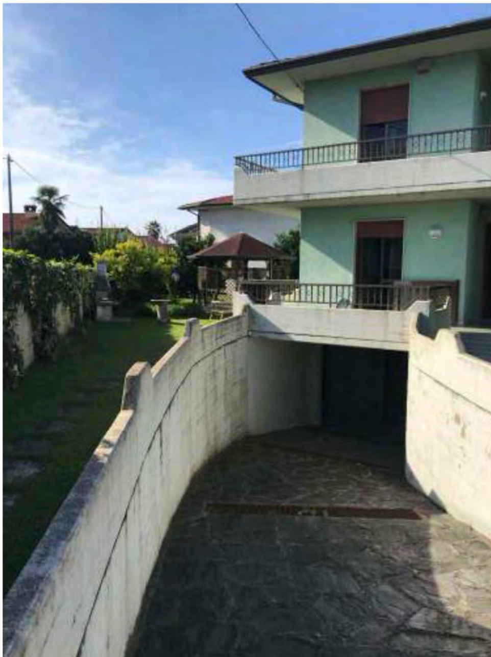
Foto E3: Marina di Massa, Massa (MS). Lotto 002. Esterno ingresso garage lato nord-est.