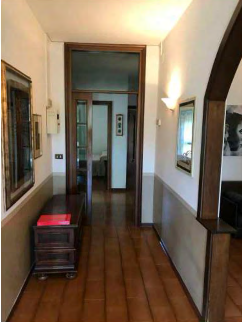
Foto 6: Marina di Massa, Massa. Lotto 001. Piano terra. Corridoio-disimpegno.