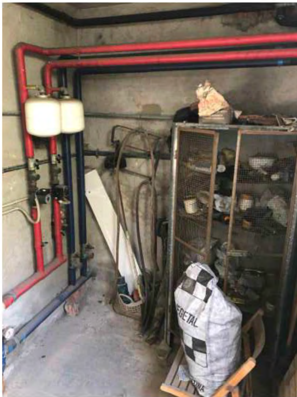
Foto 1: Marina di Massa, Massa. Lotto 002. Interno. Centrale Termica.