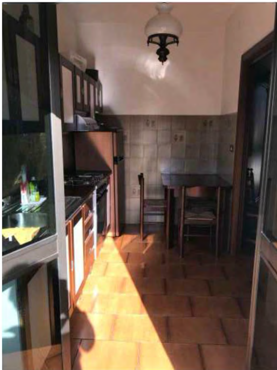
Foto 7: Marina di Massa, Massa (MS) Lotto 002. Piano primo. Cucina.