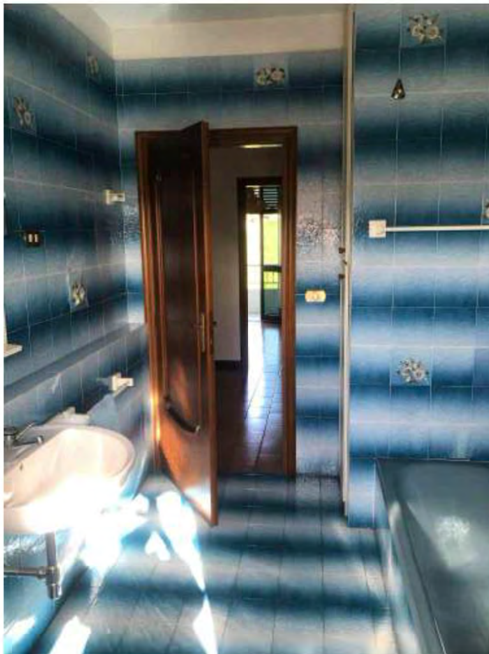
Foto 10: Marina di Massa, Massa. Lotto 002. Piano primo. Bagno principale.