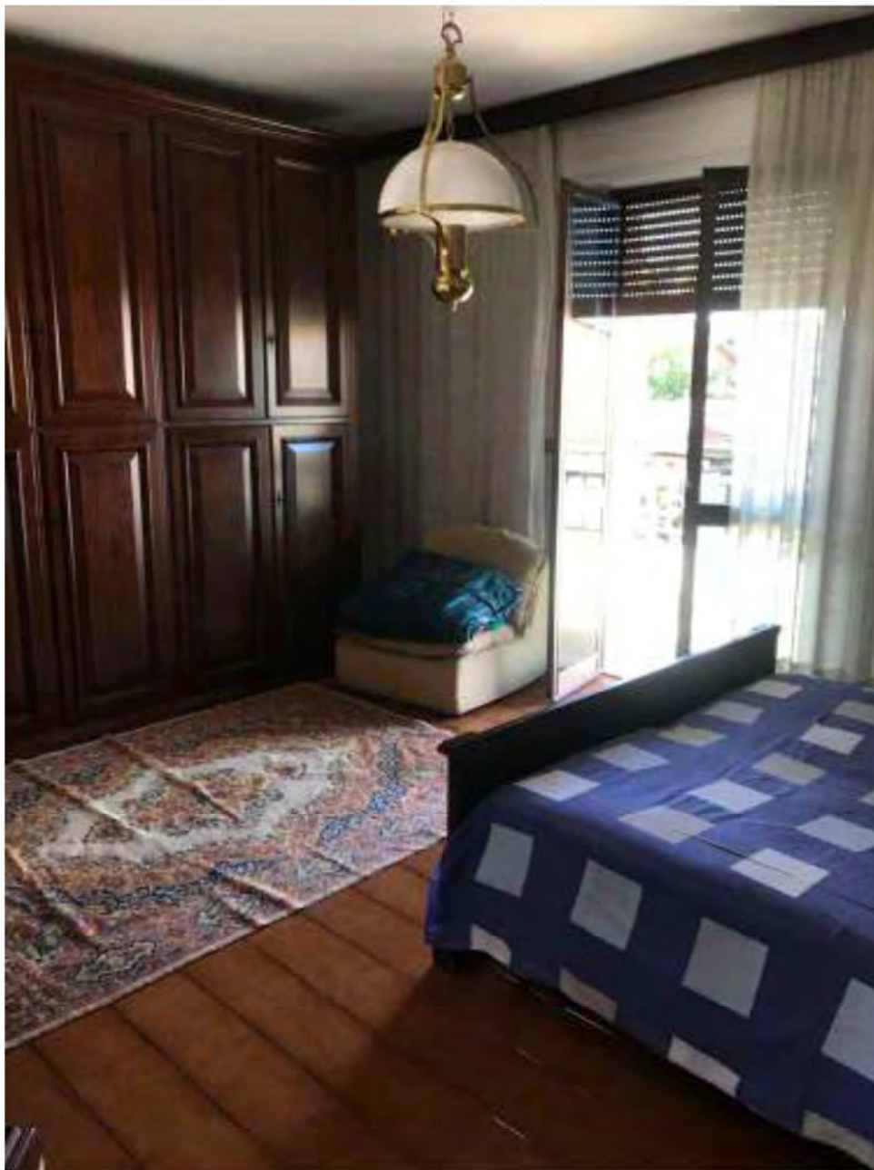
Foto 13: Marina di Massa, Massa. Lotto 002. Piano primo. Camera 1.