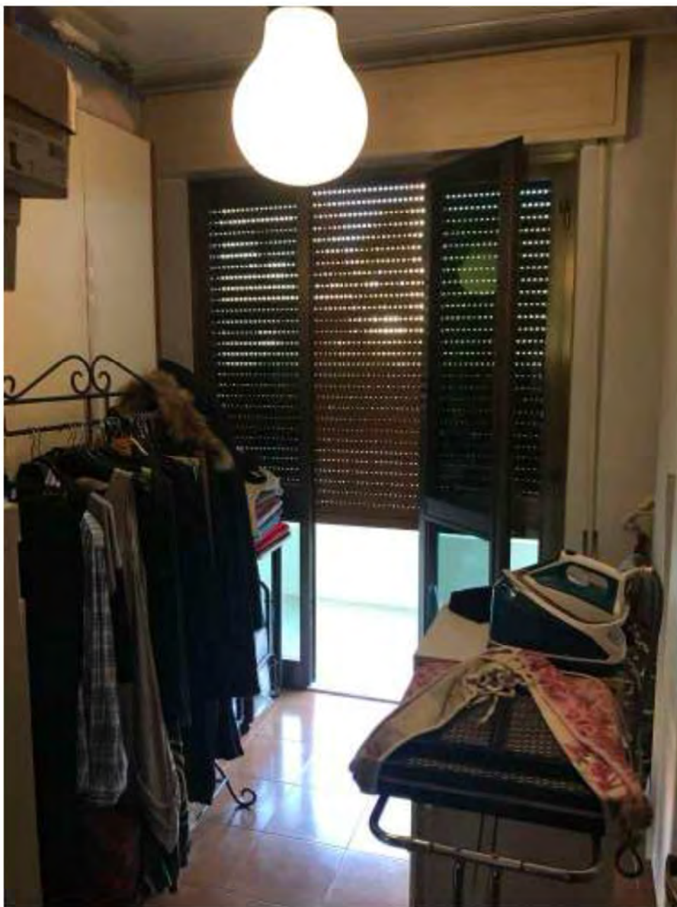
Foto 11: Marina di Massa, Massa. Lotto 001. Piano terra. Lavanderia.