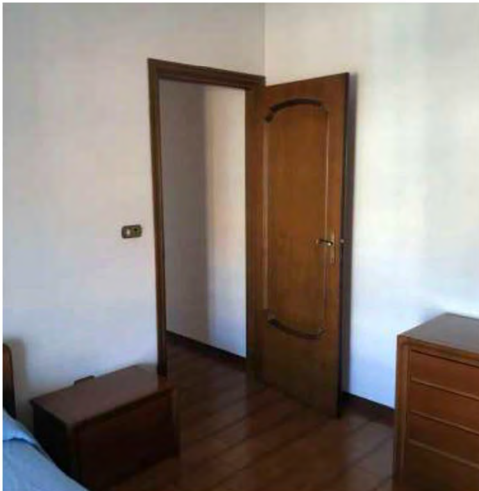
Foto 17: Marina di Massa, Massa. Lotto 002. Piano primo. Camera 3.