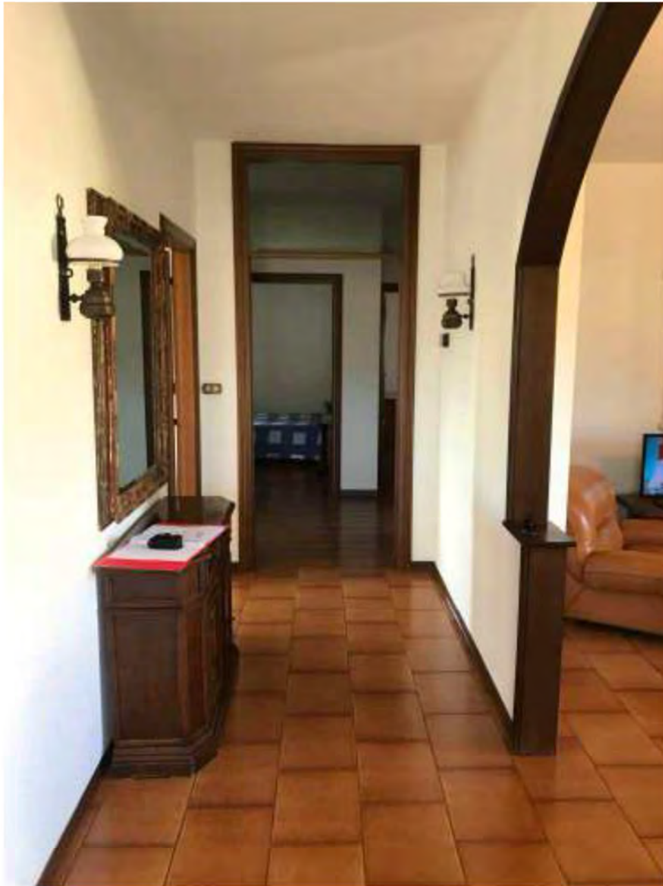
Foto 5: Marina di Massa, Massa (MS). Lotto 002. Piano primo. Corridoio-disimpegno.