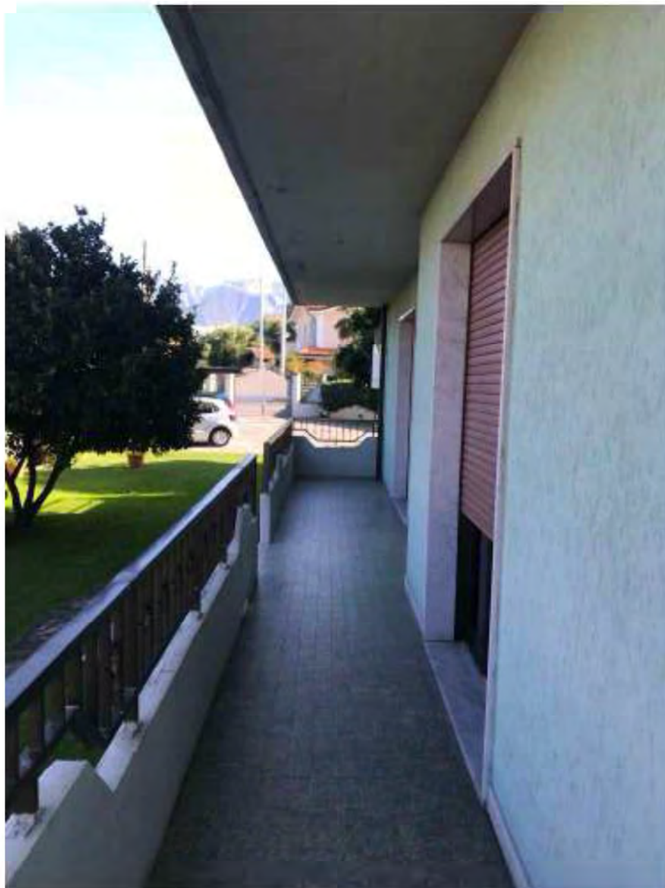
Foto 10: Marina di Massa, Massa. Lotto 001. Piano terra. Terrazza lato ovest.