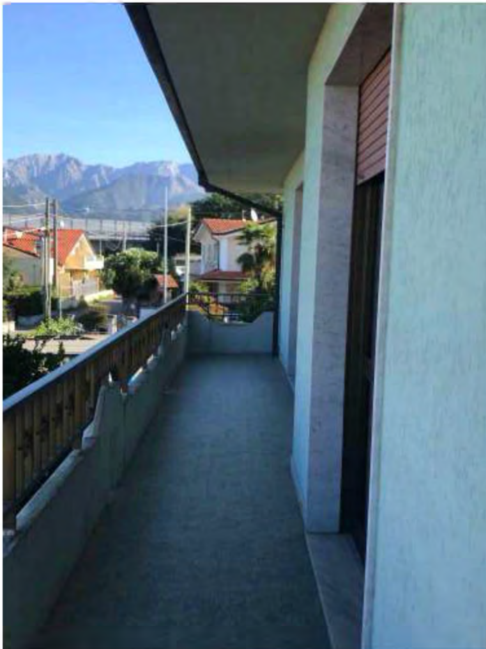
Foto 16: Marina di Massa, Massa. Lotto 002. Piano primo. Terrazza lato ovest.