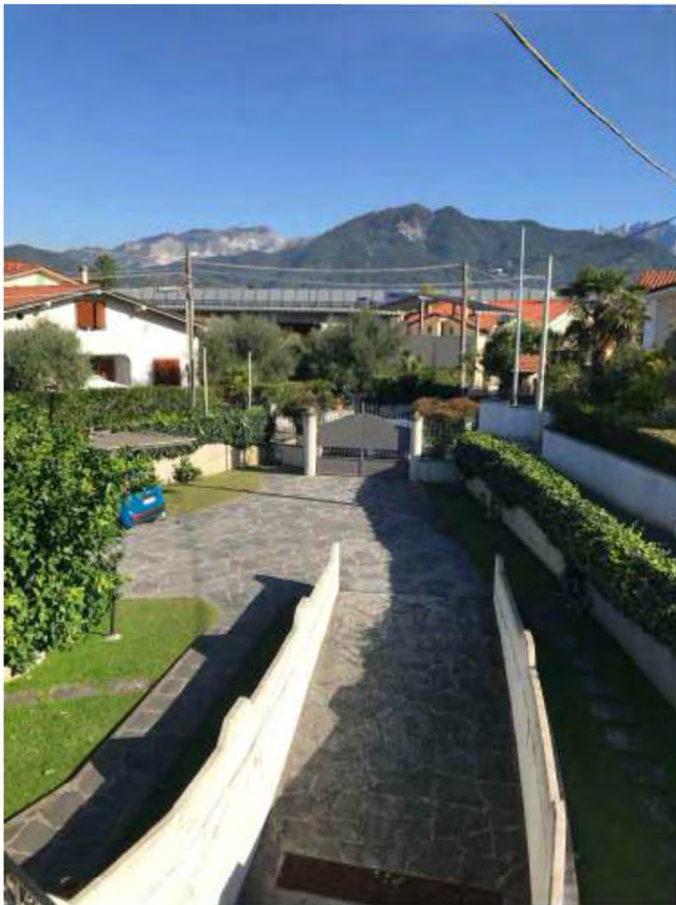
Foto E4: Marina di Massa, Massa (MS). Lotto 002. Esterno Abitazione, cortile pertinenziale con ingresso carrabile.