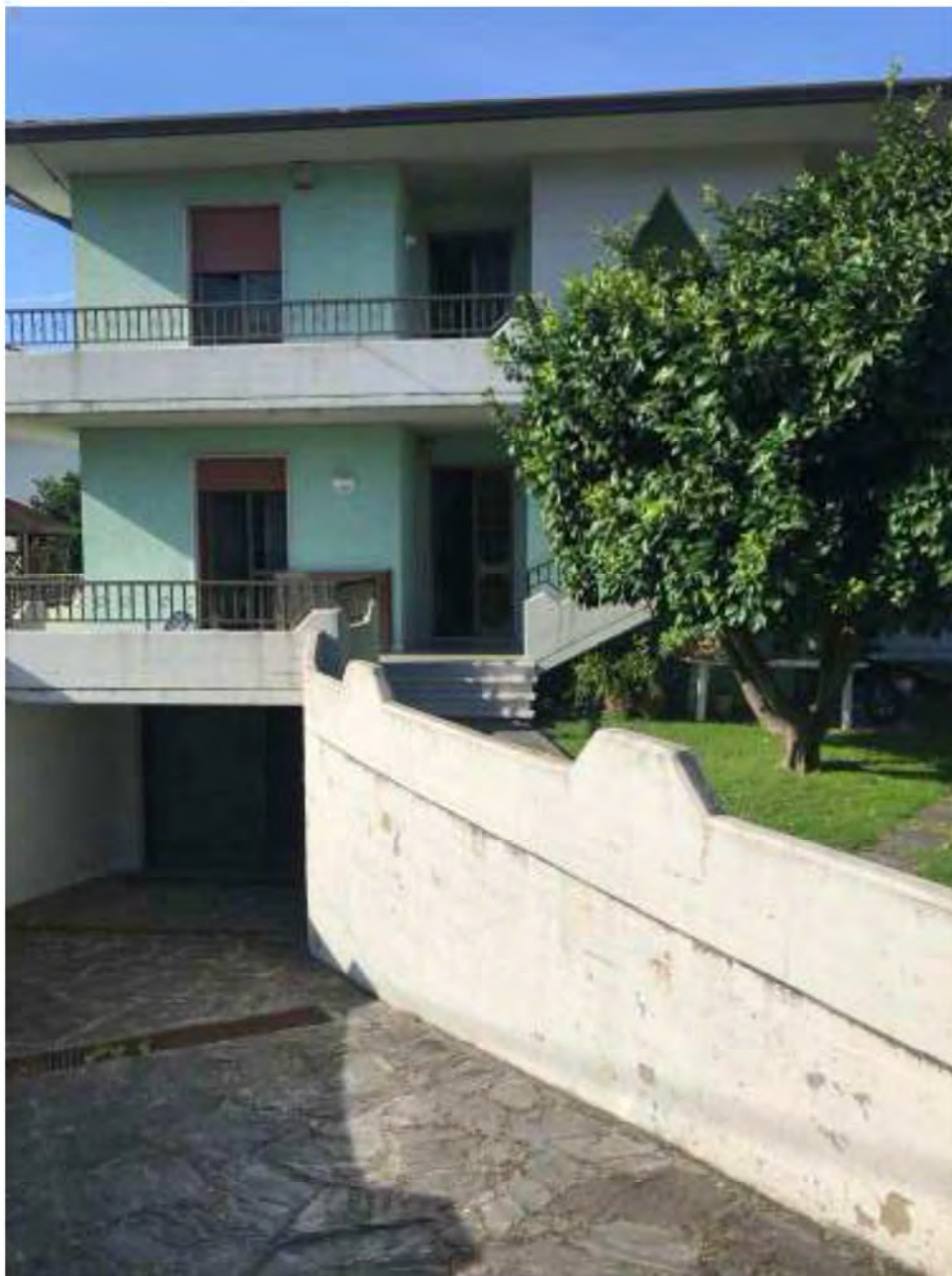
Foto E2: Marina di Massa, Massa (MS). Lotto 002. Esterno. Ingresso Abitazioni-garage, lato nord.