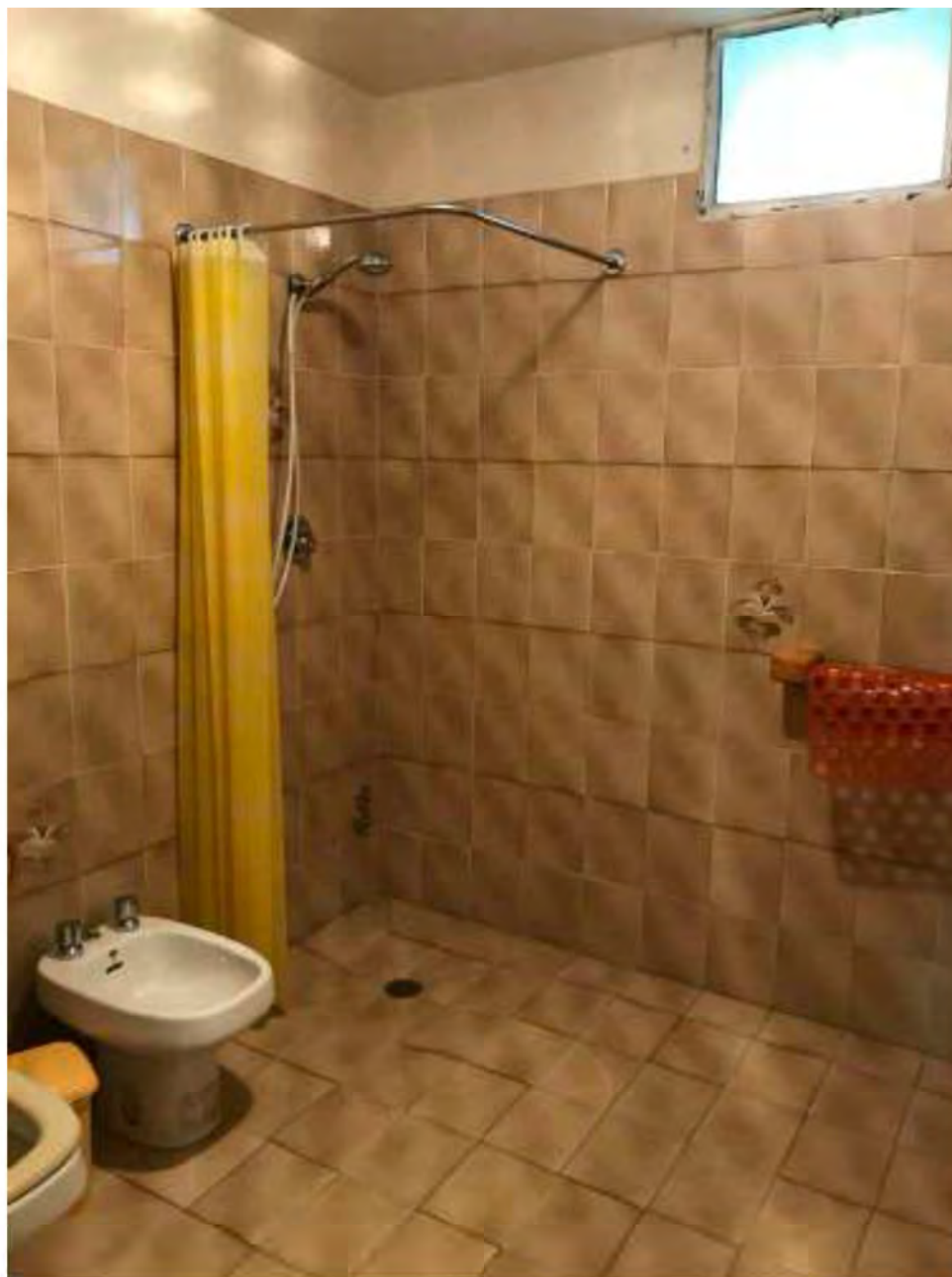
Foto 17: Marina di Massa, Massa. Lotto 001. Piano seminterrato. Bagno.