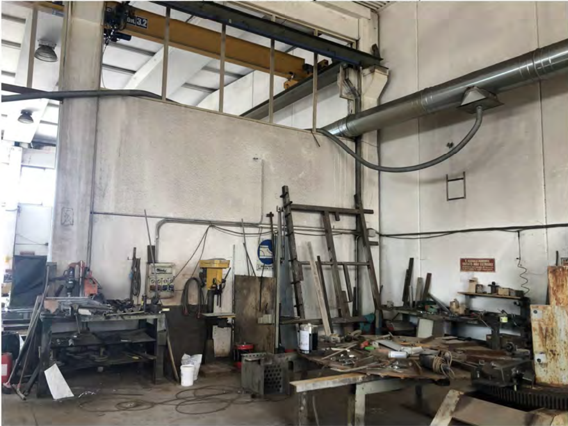
P.V. 44 (Vista interno capannone da Nord/Ovest)