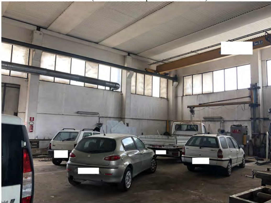
P.V. 42 (Vista interno capannone da Nord/Est)