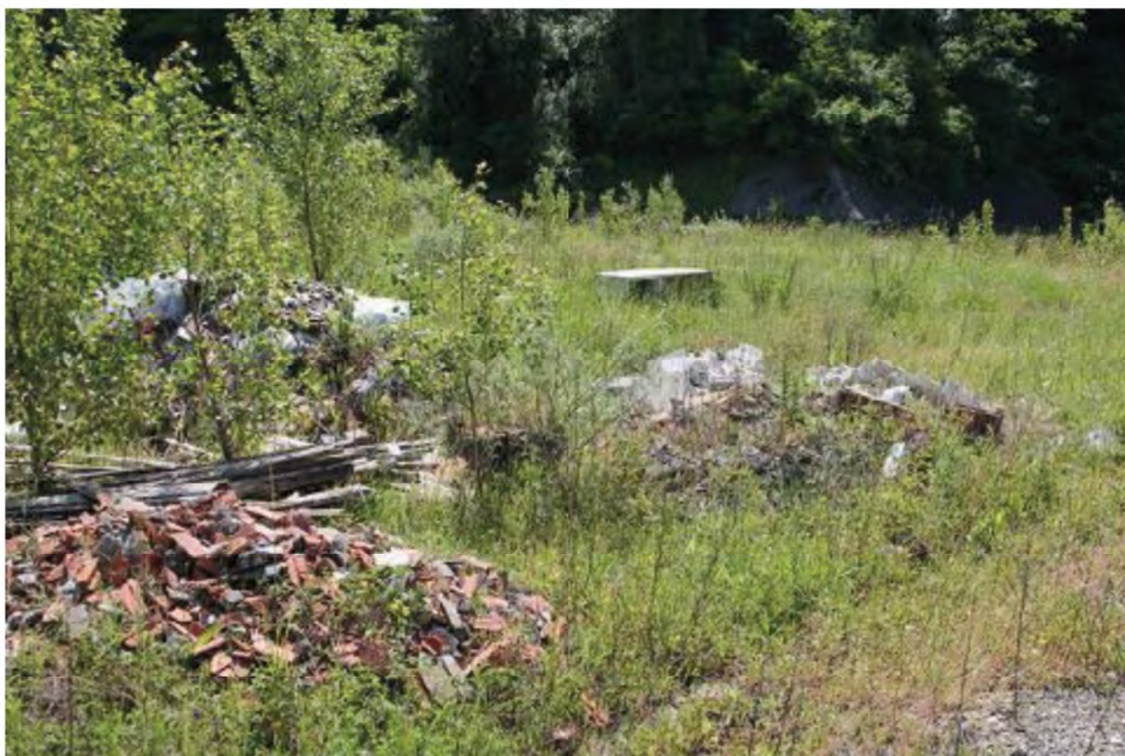
Foto 26. Rifiuti in sito