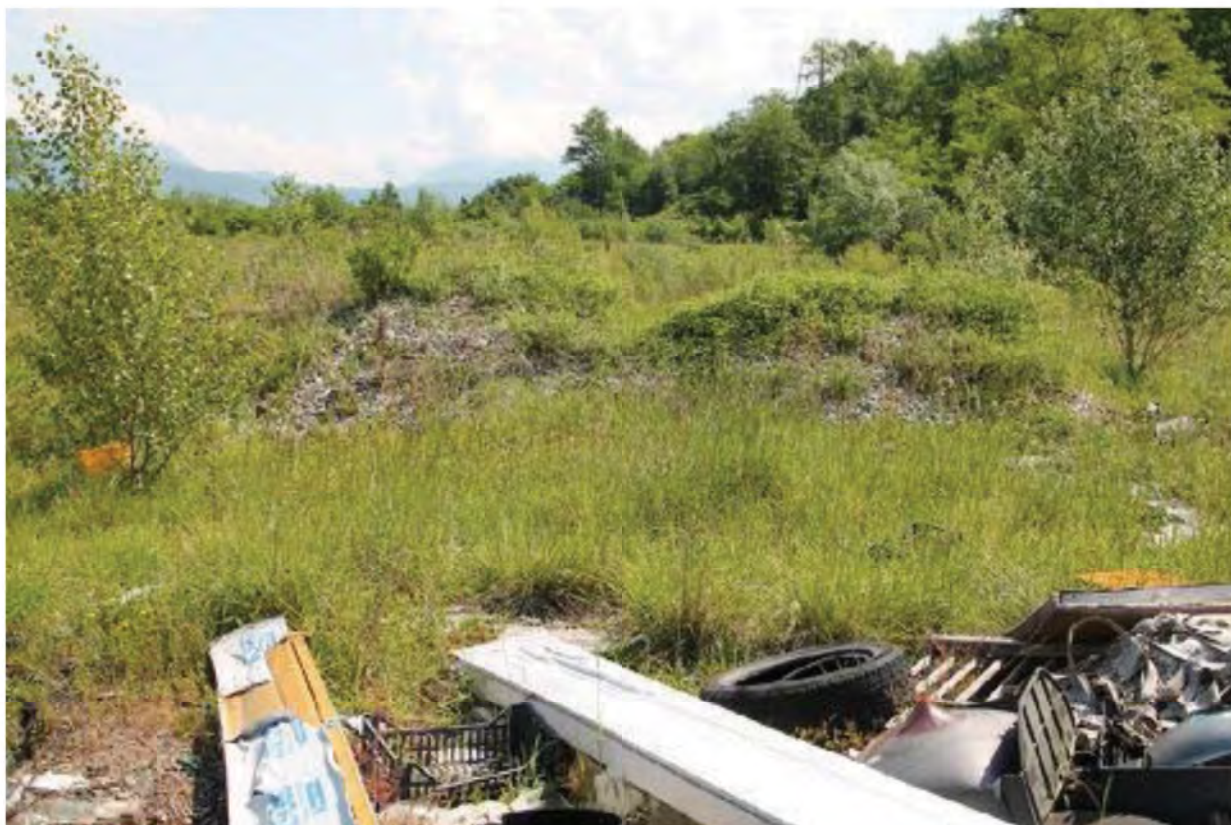
Foto 28. Rifiuti in sito