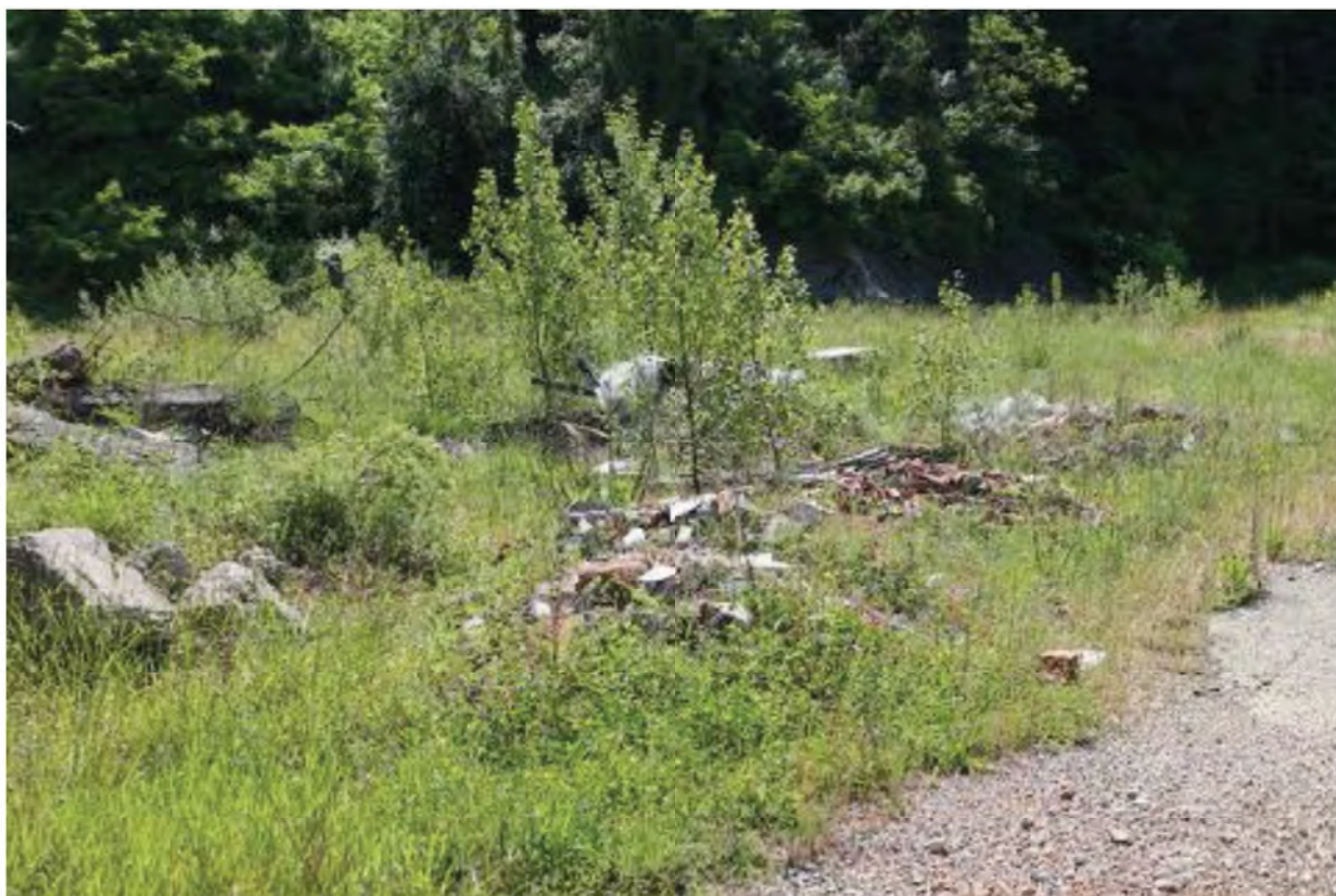
Foto 32. Rifiuti in sito