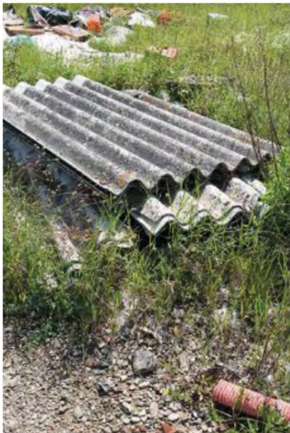
Foto 22. Rifiuti in sito , tra cui amianto