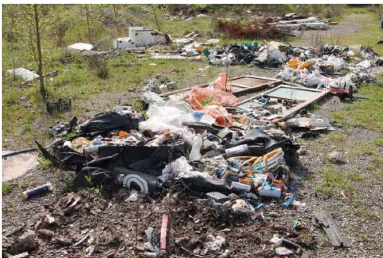
Foto 31. Rifiuti in sito