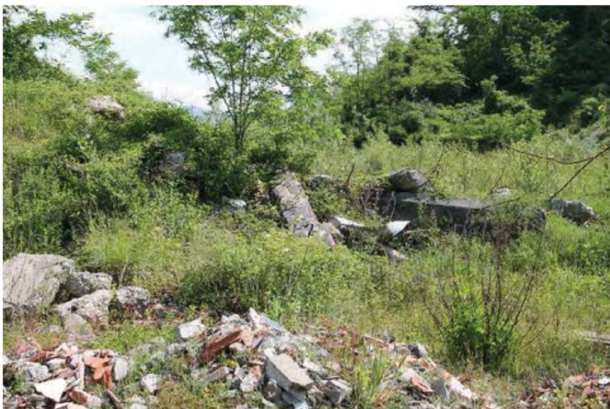
Foto 29. Rifiuti in sito