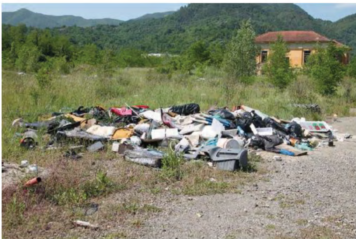
Foto 21. Rifiuti in sito