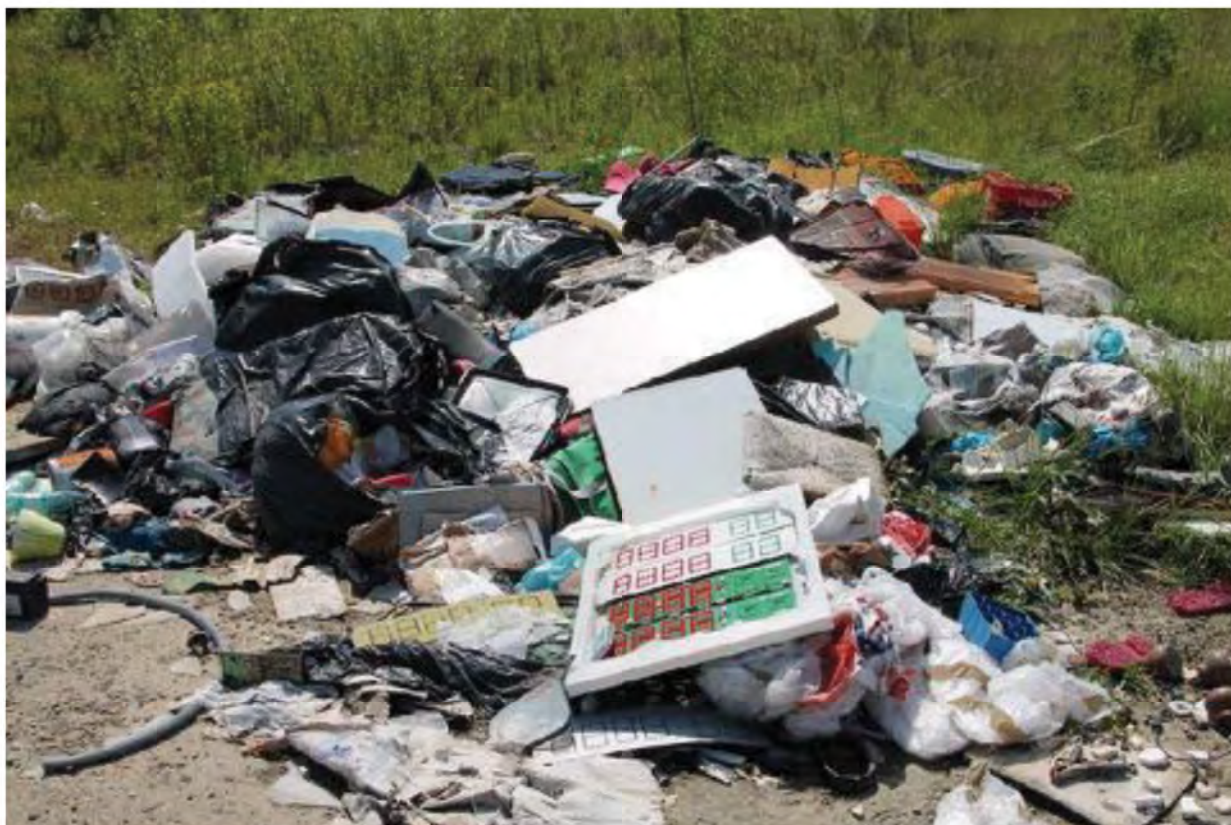
Foto 20. Rifiuti in sito