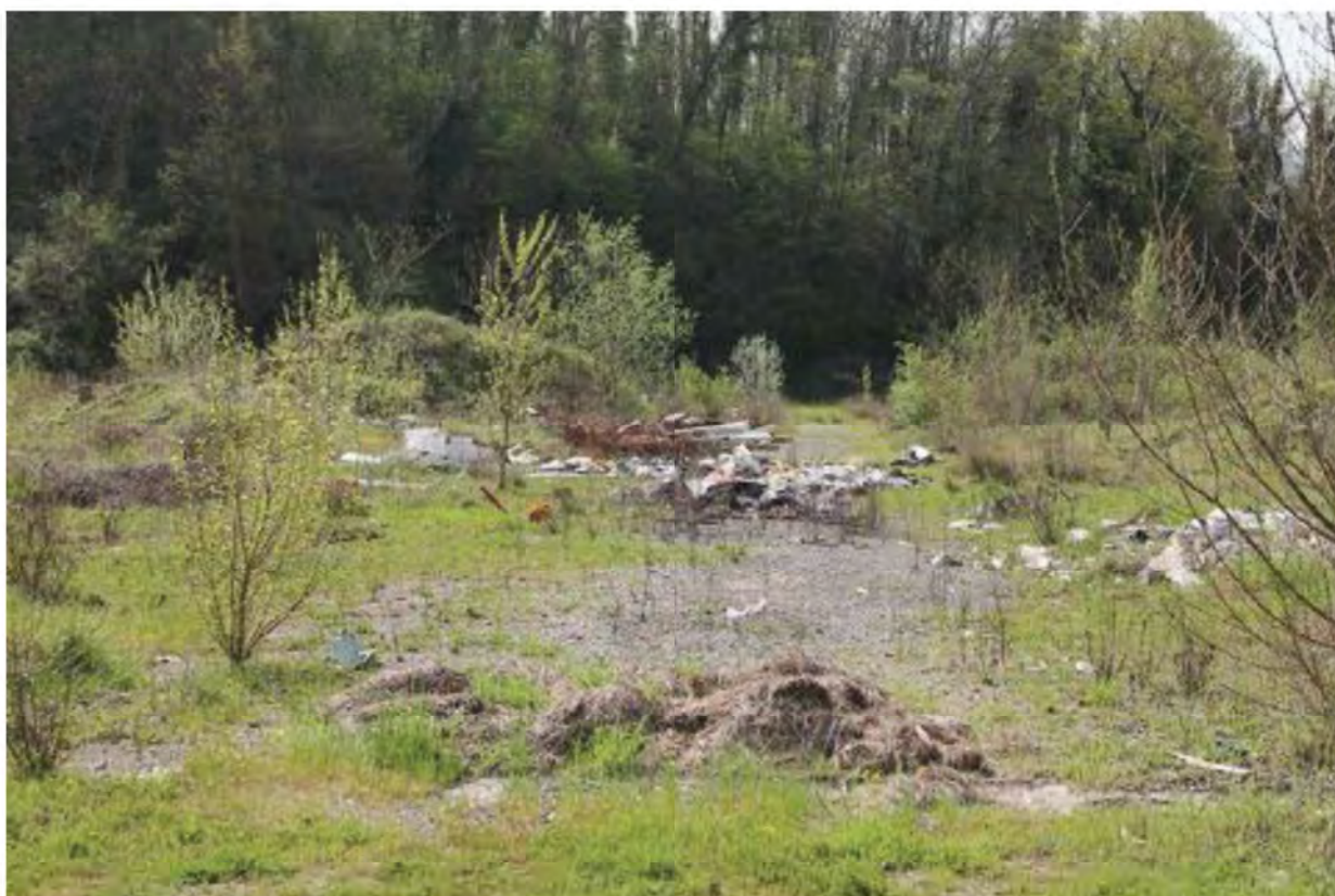
Foto 2. Rifiuti presenti in sito