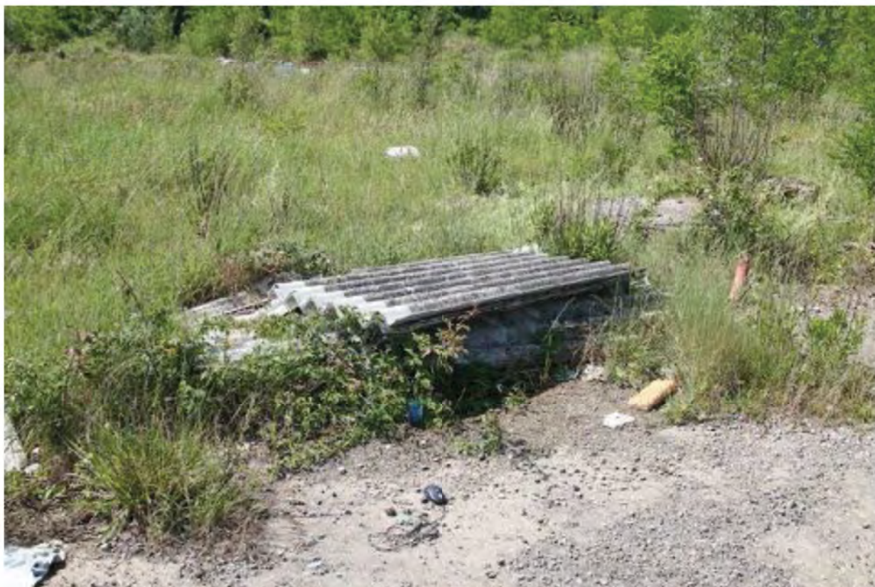
Foto 30. Rifiuti in sito , tra cui amianto