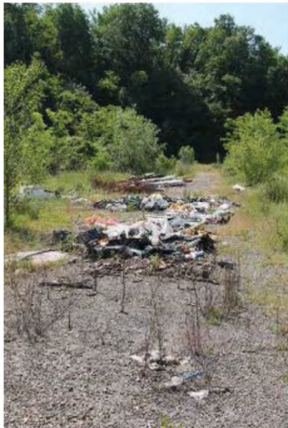
Foto 23. Rifiuti in sito