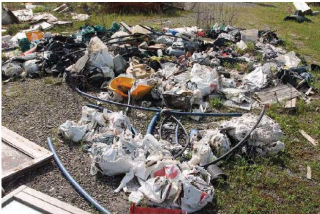
Foto 1. Rifiuti presenti in sito