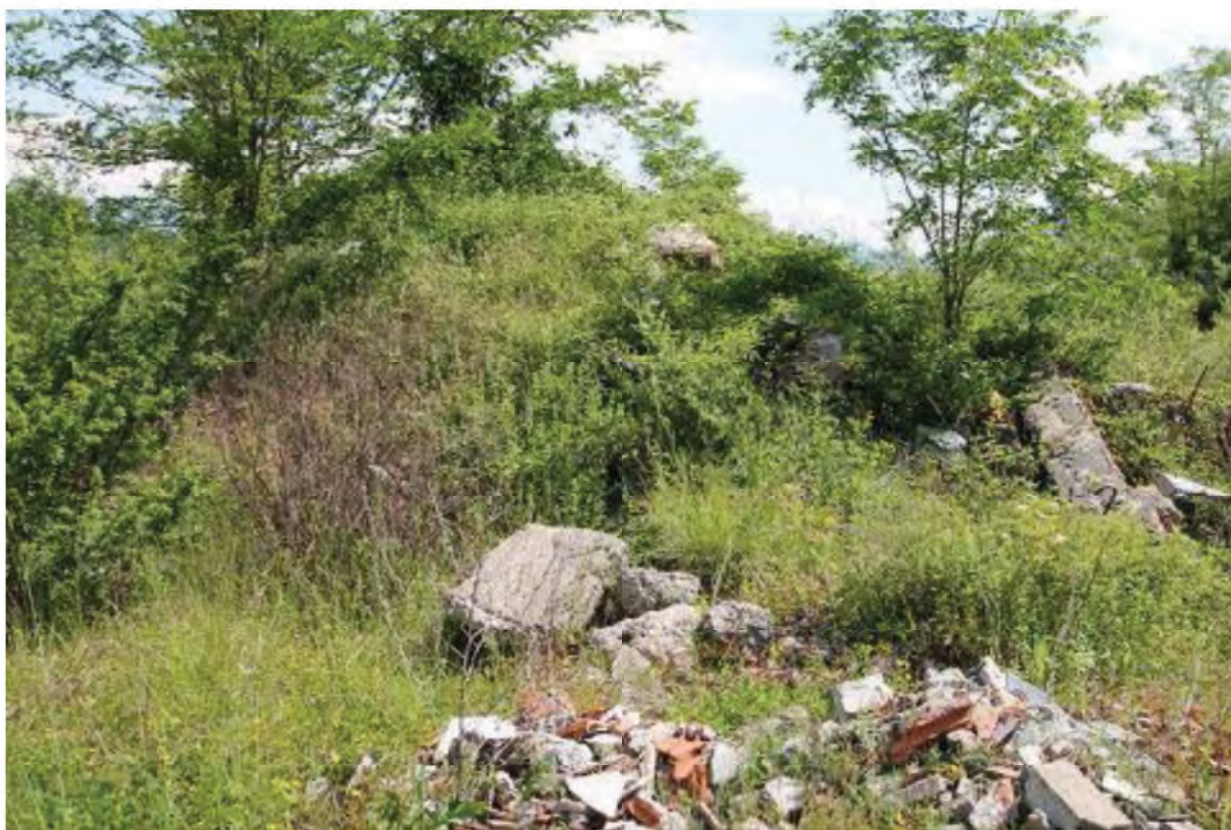
Foto 27 Rifiuti in sito