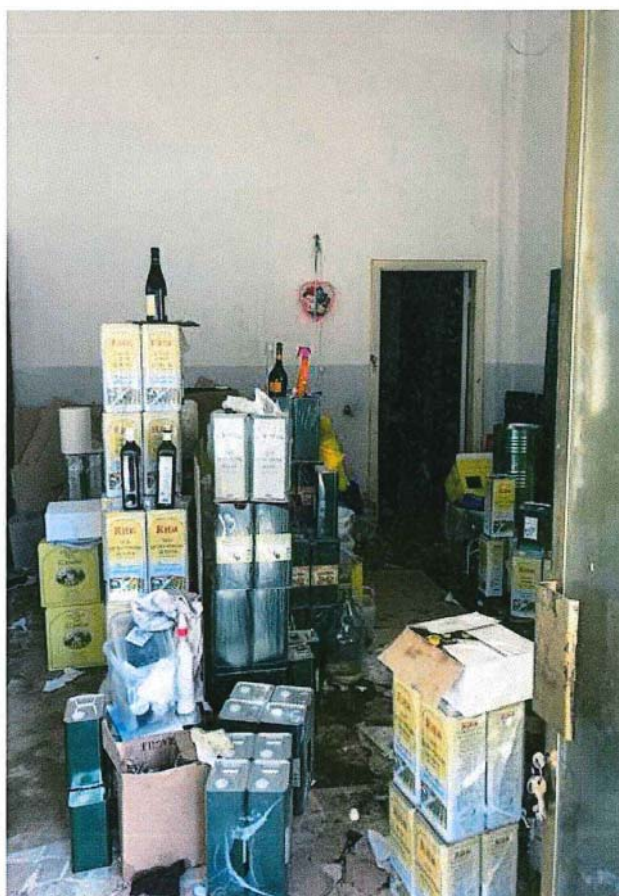
Vista del locale all'ingresso (deposito confezione olio oggetto di attività di vendita)