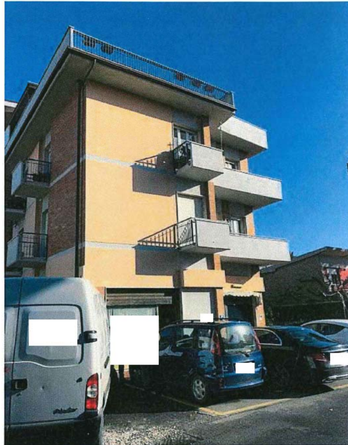
Vista ingresso al fondo a piano Terra in fabbricato condominiale "Villa Stefania" e posto auto scoperto antistante, lungo Via Casamicciola