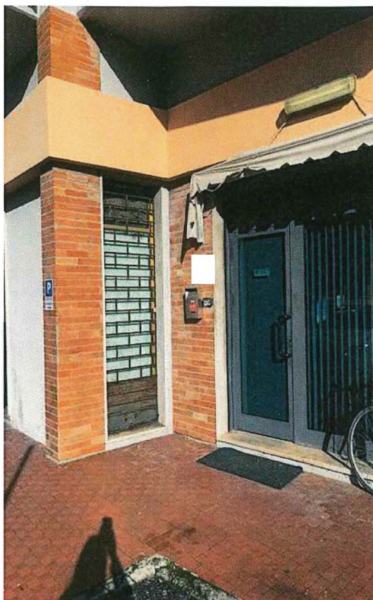
Vista lato Viareggio (infixo in alluminio e vetro con serranda in ferro)