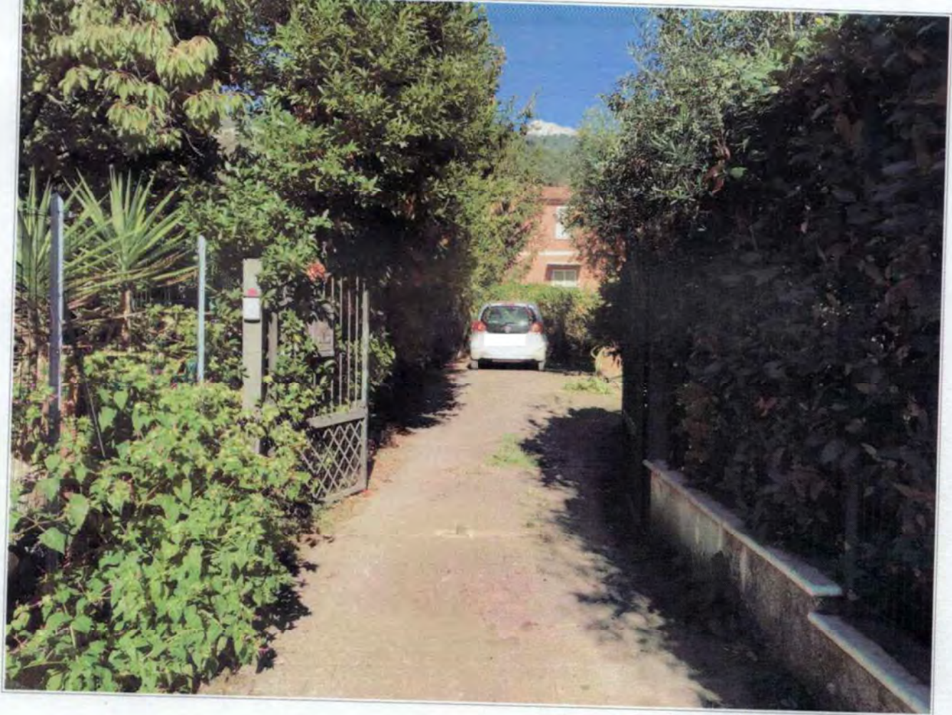
Accesso carrabile che conduce alla corte esclusiva