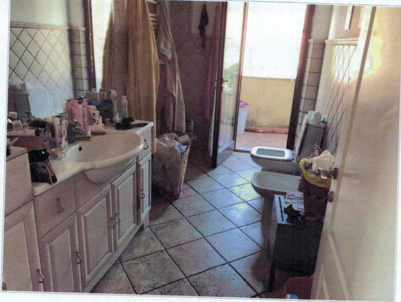
Bagno posto al piano primo