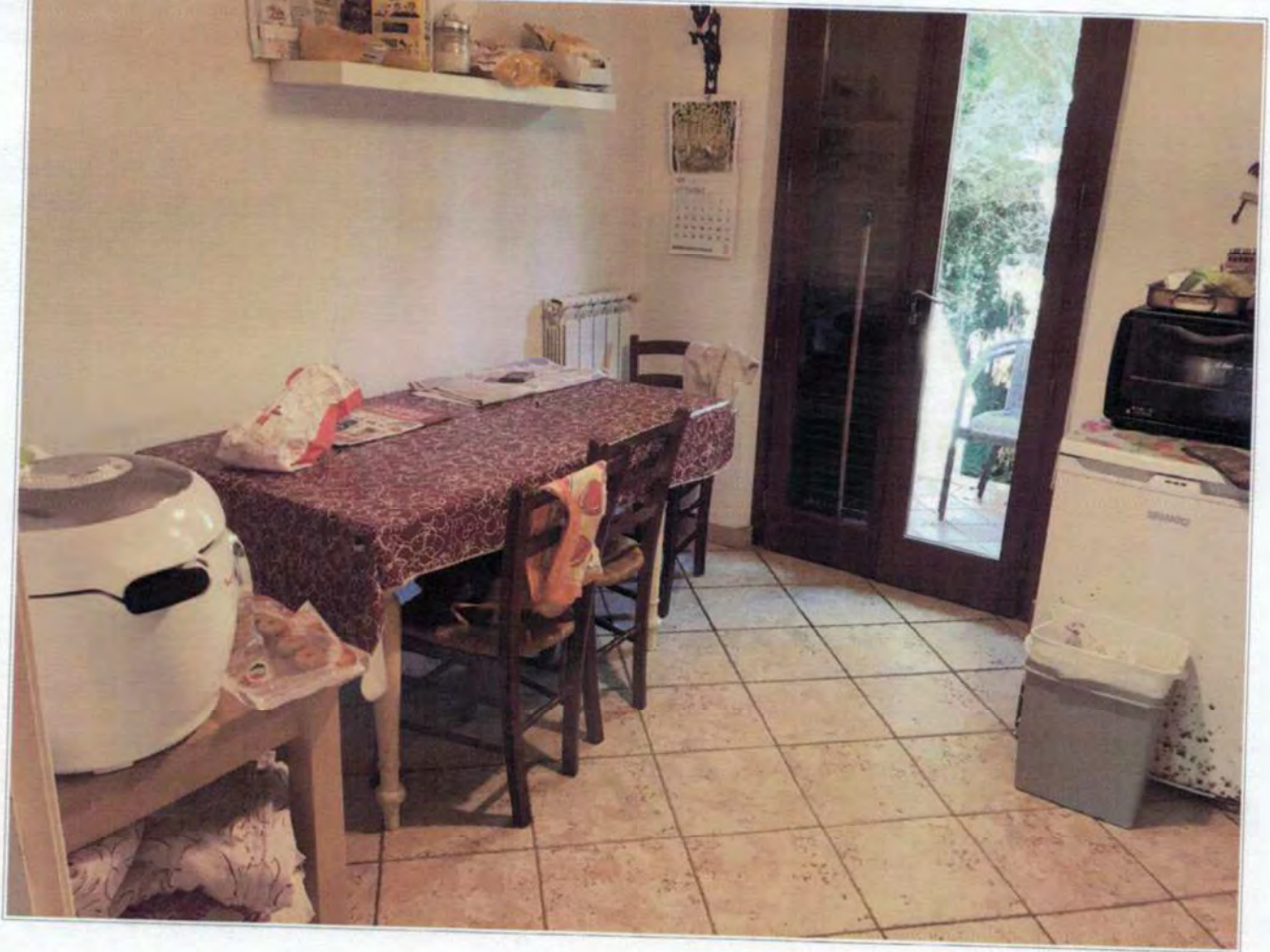
Cucina posta al piano Terra