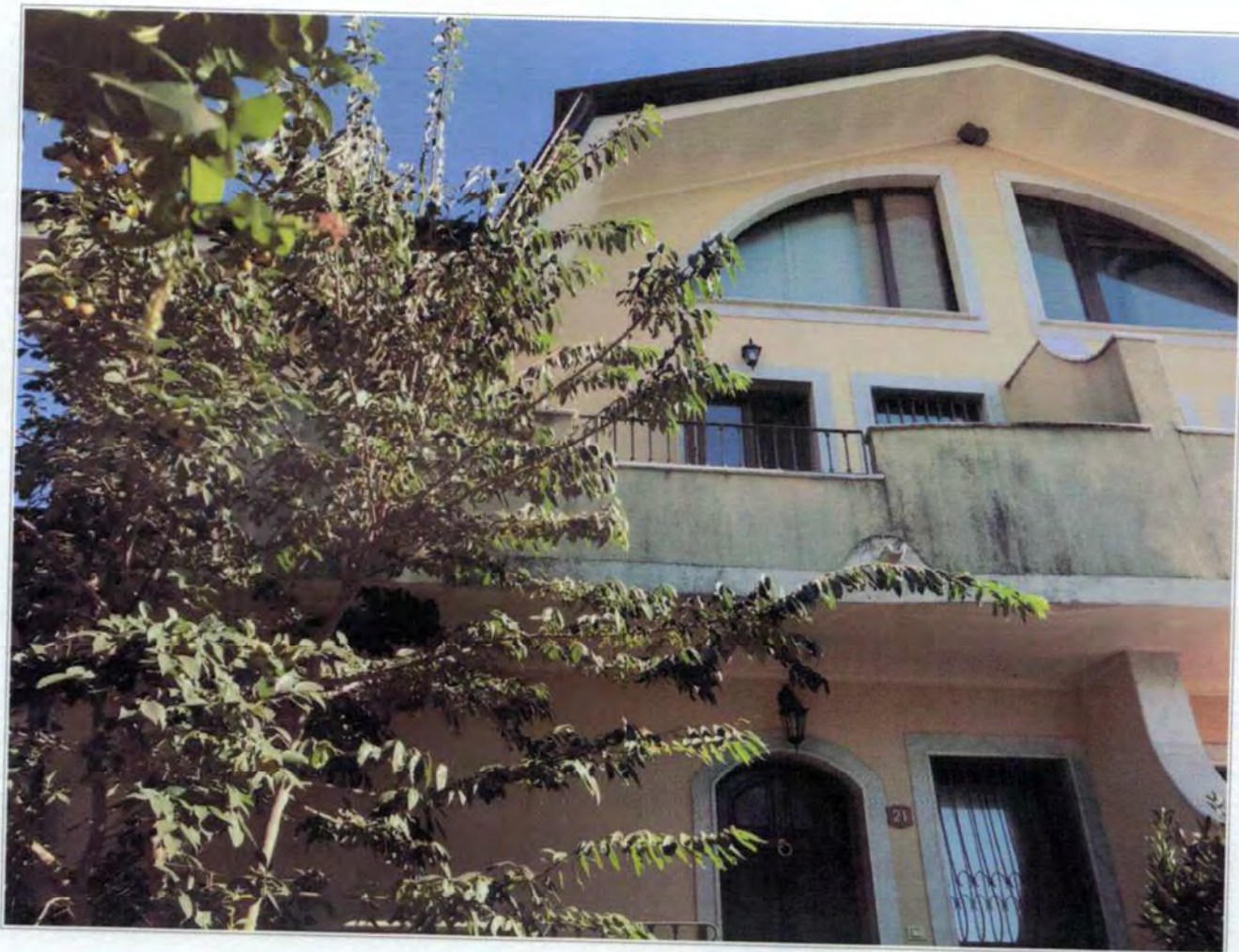
Vista esterna del fabbricato