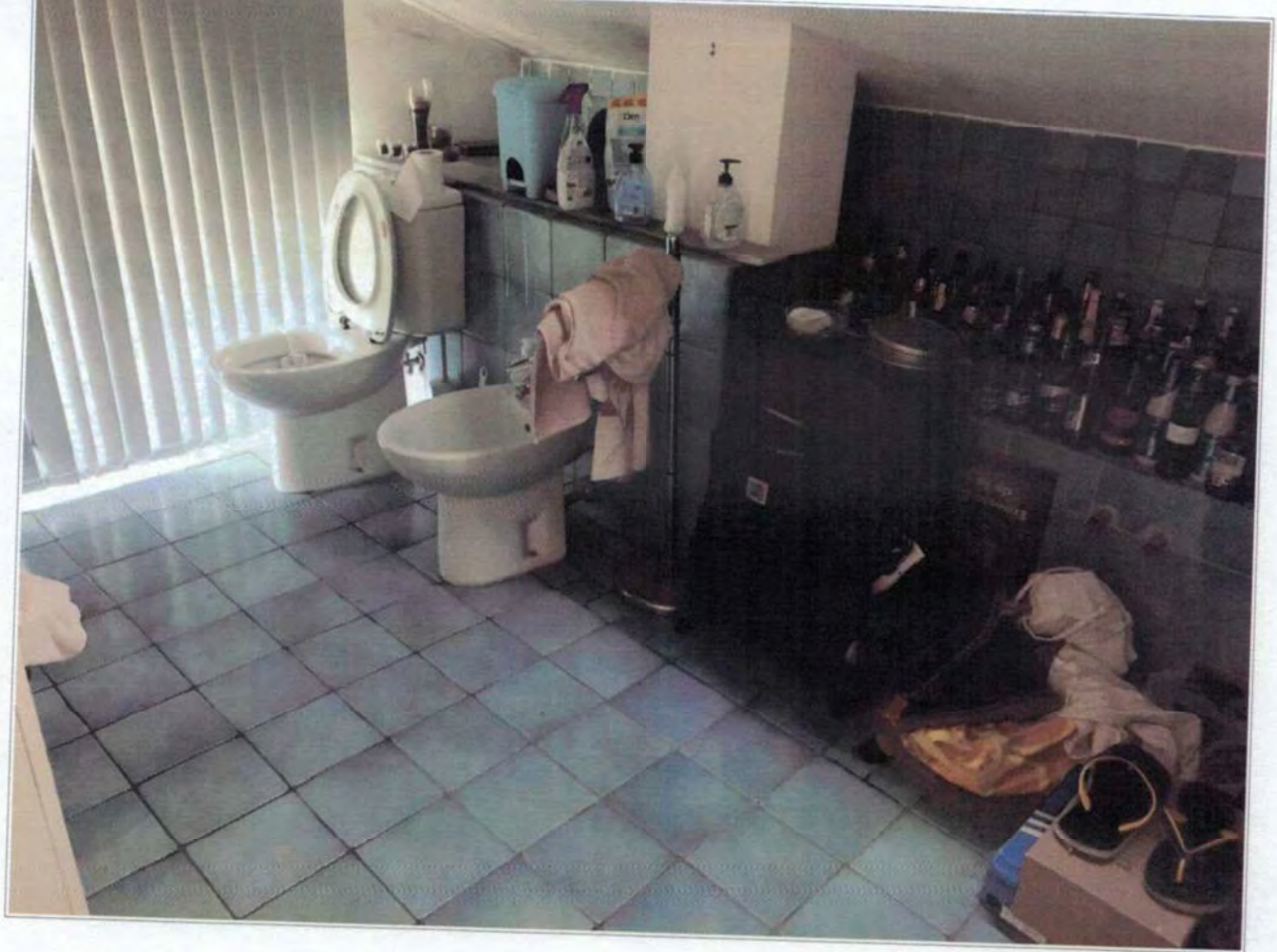
Locale ripostiglio al piano sottotetto dove è stato realizzato impropriamente il bagno