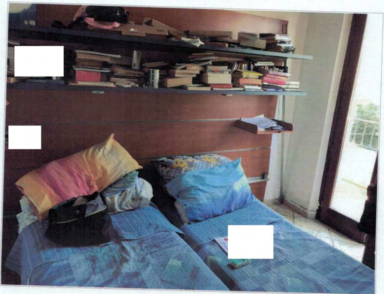
Seconda camera posta al piano primo