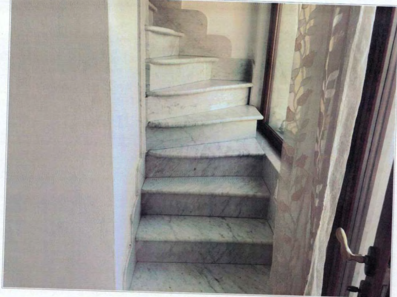
Scale di collegamento interne