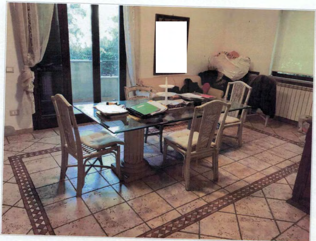
Soggiorno posto al piano Terra