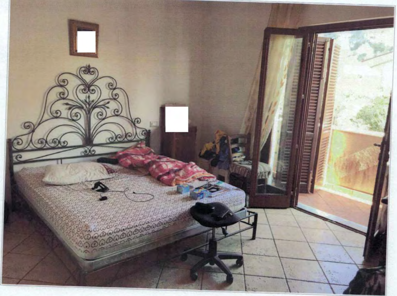
Prima Camera posta al piano primo