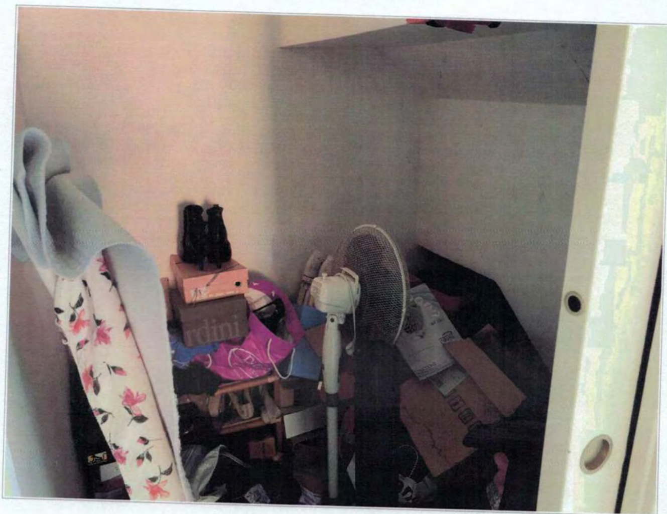
Ripostiglio piano primo