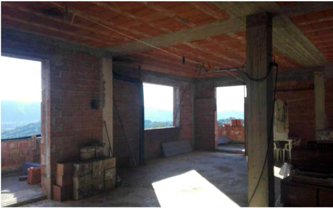
FOTO 10, 11. Piano Primo