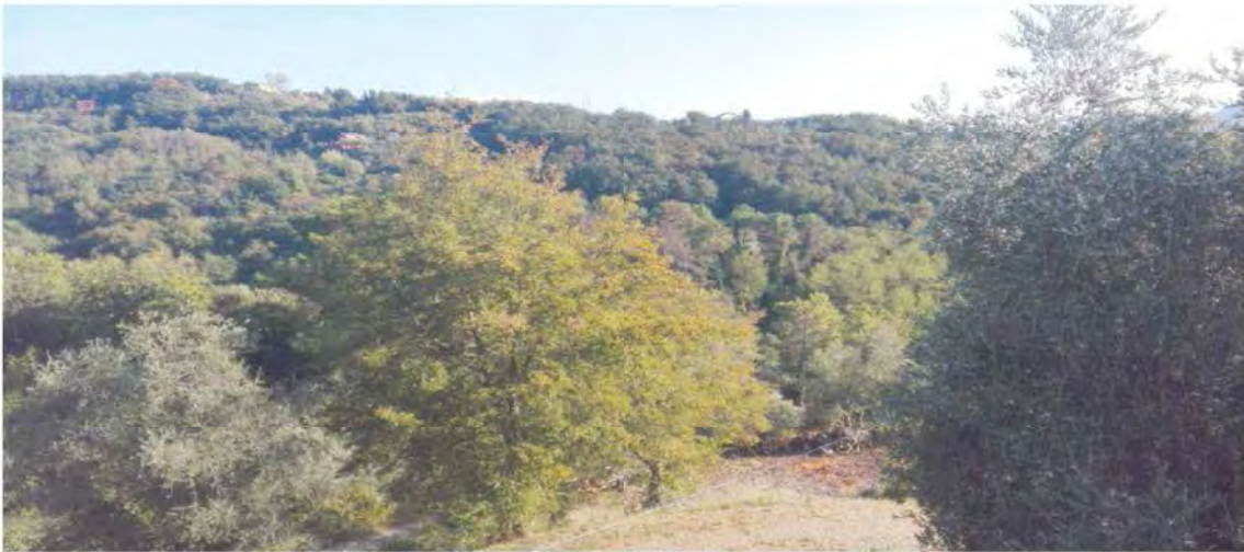
FOTO 16, 17, 18. Veduta sui terreni esegutati