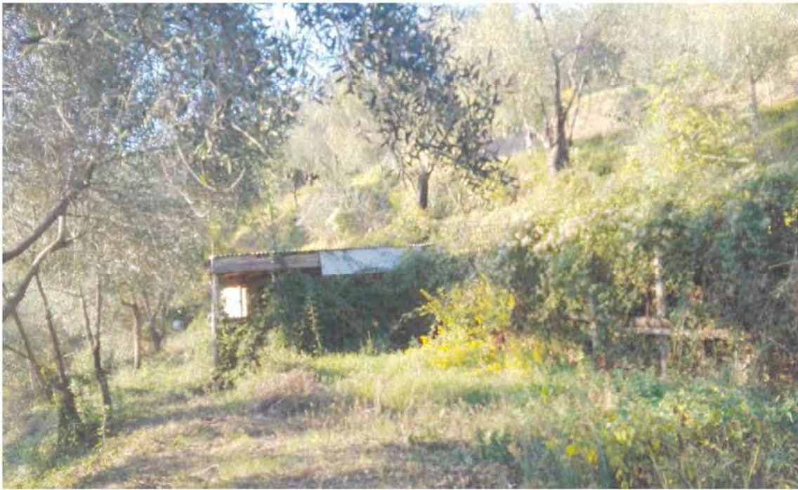
FOTO 14, 15. Corpi di fabbrica da demolire