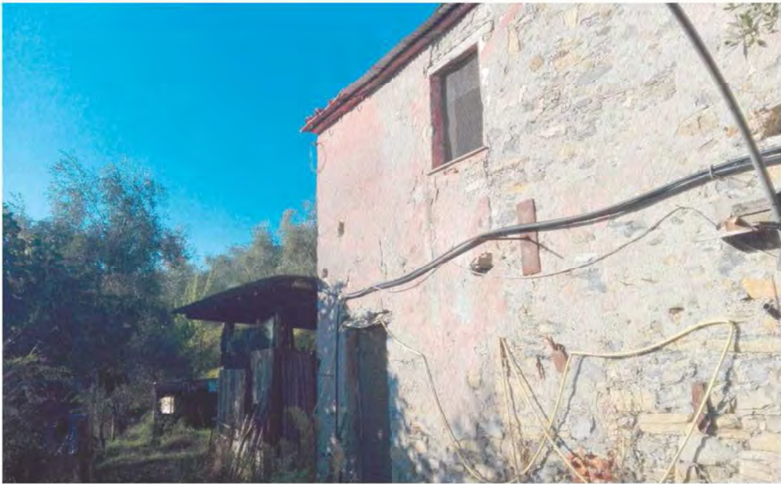
FOTO 12, 13. Corpi di fabbrica da demolire