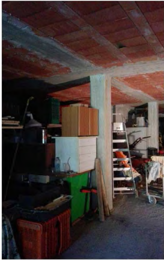
FOTO 3, 4, 5. Piano Interrato