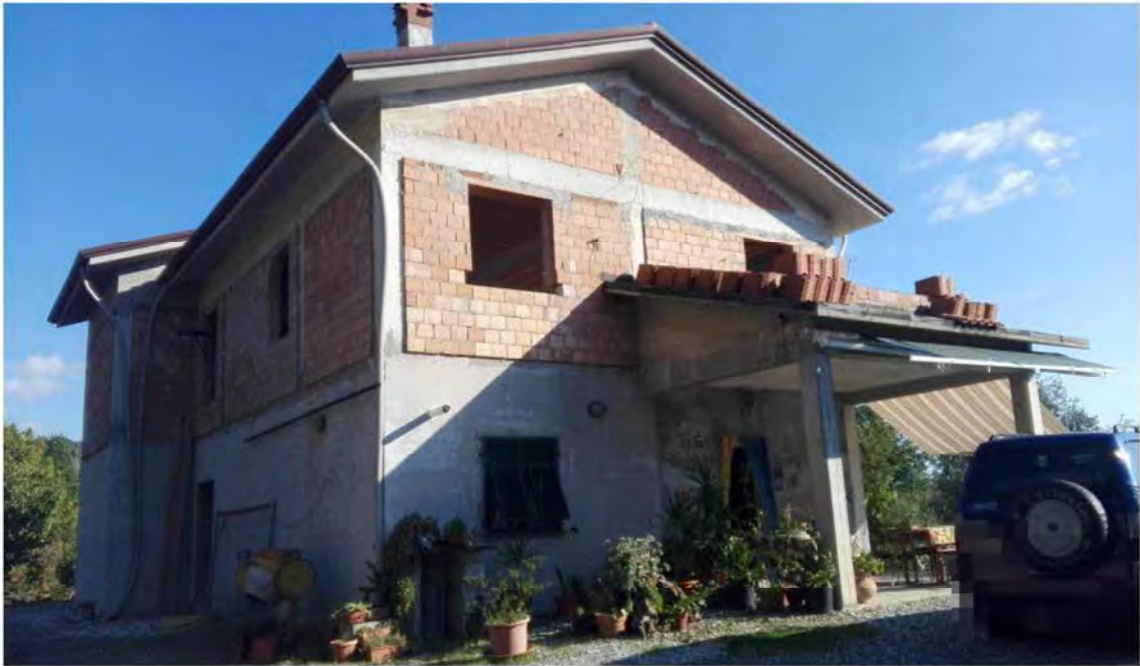
FOTO 1. 2 Esterni