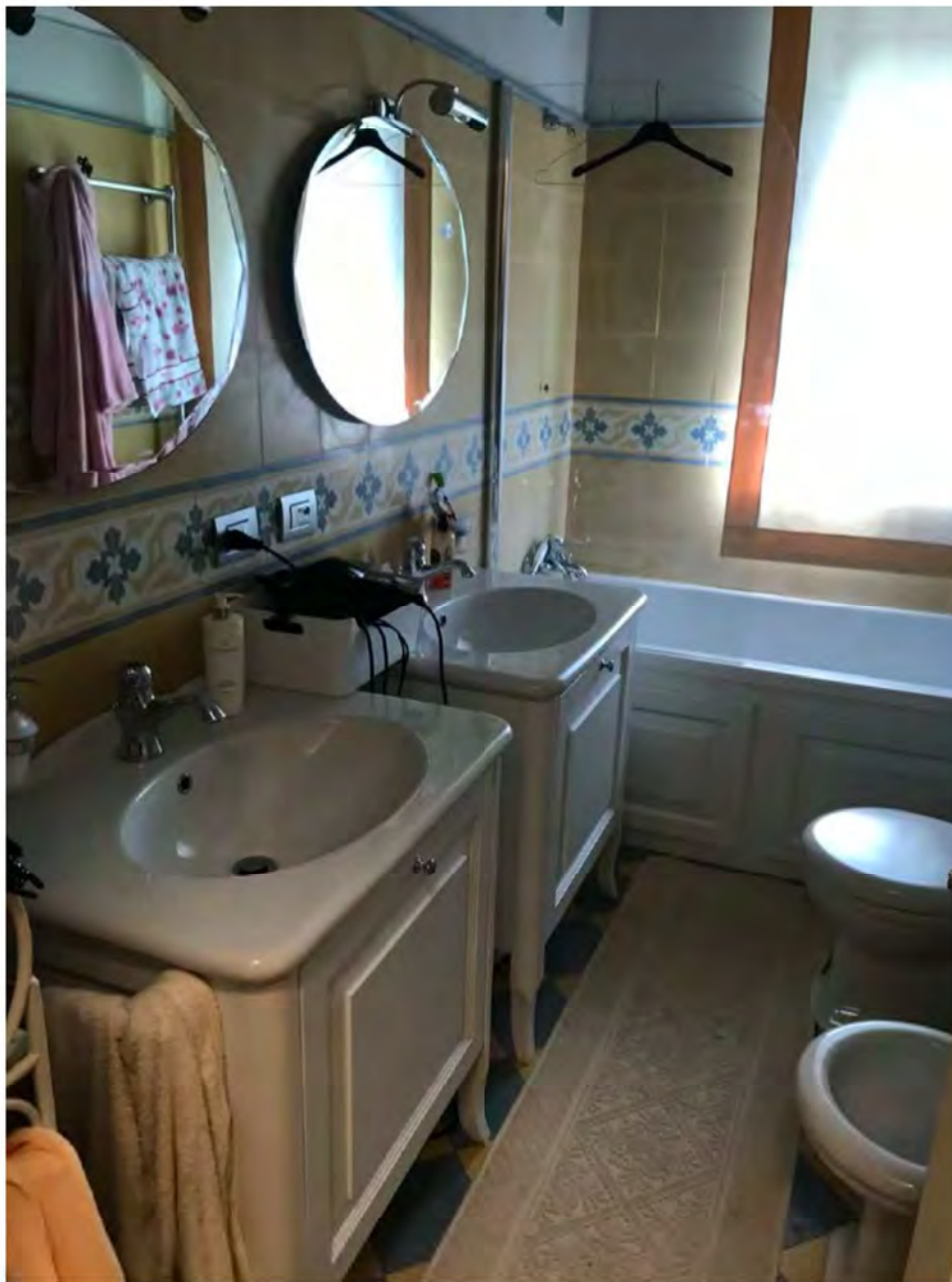
Foto 24: Via dei Pini Licciana Nardi. Lotto 001. Interno Piano Primo. Bagno 2.