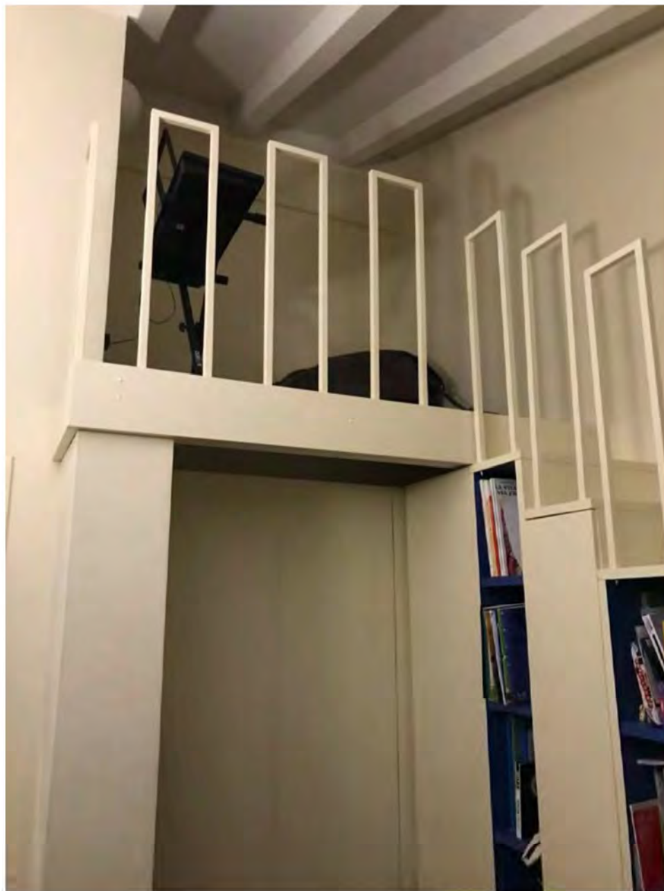
Foto 26: Via dei Pini Licciana Nardi. Lotto 001. Interno Piano Primo. Camera 3.