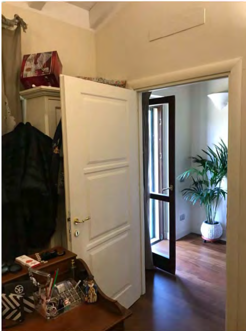
Foto 19: Via dei Pini Licciana Nardi. Lotto 001. Interno Piano Primo Camera 1.