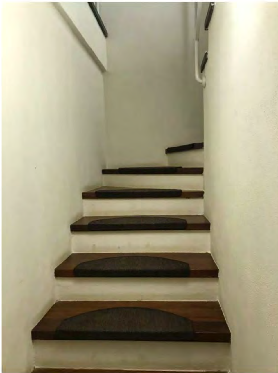
Foto 7: Via dei Pini Licciana Nardi. Lotto 001. Interno Seminterrato.Vano scala.