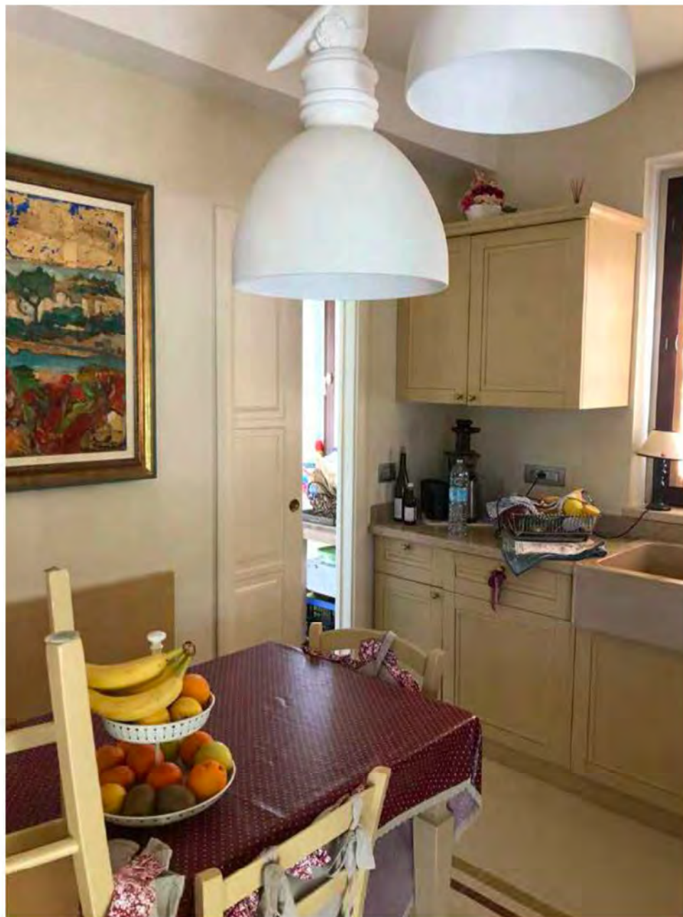
Foto 15: Via dei Pini Licciana Nardi. Lotto 001. Interno Piano Terra.Cucina.