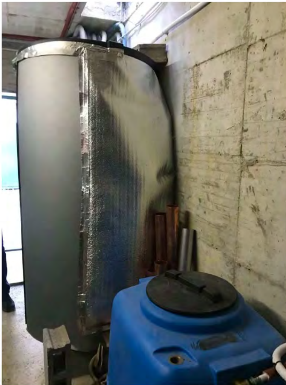
Foto 2: Via dei Pini Licciana Nardi. Lotto 001. Interno Seminterrato. Intercapedine, locale tecnico.