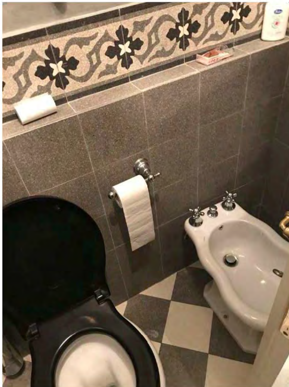
Foto 17: Via dei Pini Licciana Nardi. Lotto 001. Interno Piano Terra. Bagno