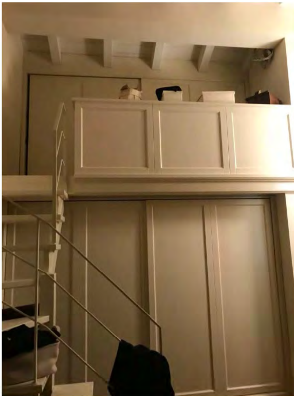
Foto 23: Via dei Pini Licciana Nardi. Lotto 001. Interno Piano Primo. Soppalco cabina armadio.