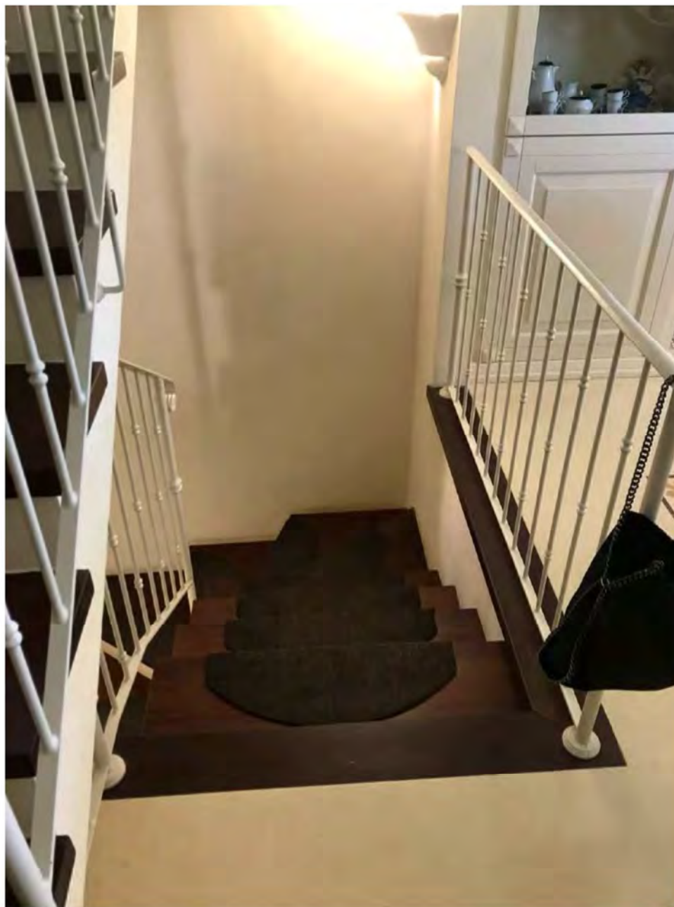
Foto 12: Via dei Pini Licciana Nardi. Lotto 001. Interno Piano Terra. Vano scale.