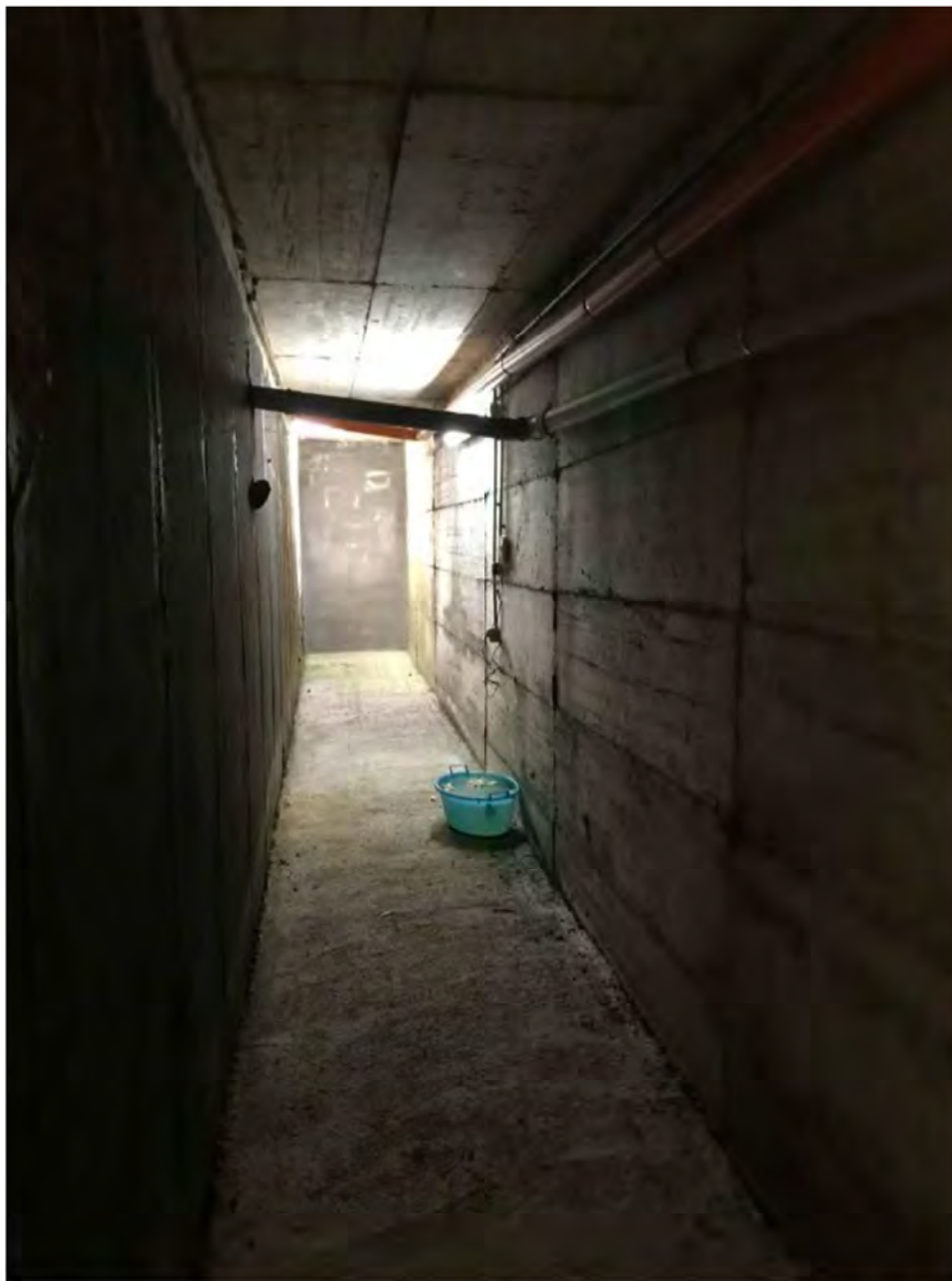
Foto 5: Via dei Pini Licciana Nardi. Lotto 001. Interno. Intercapedine