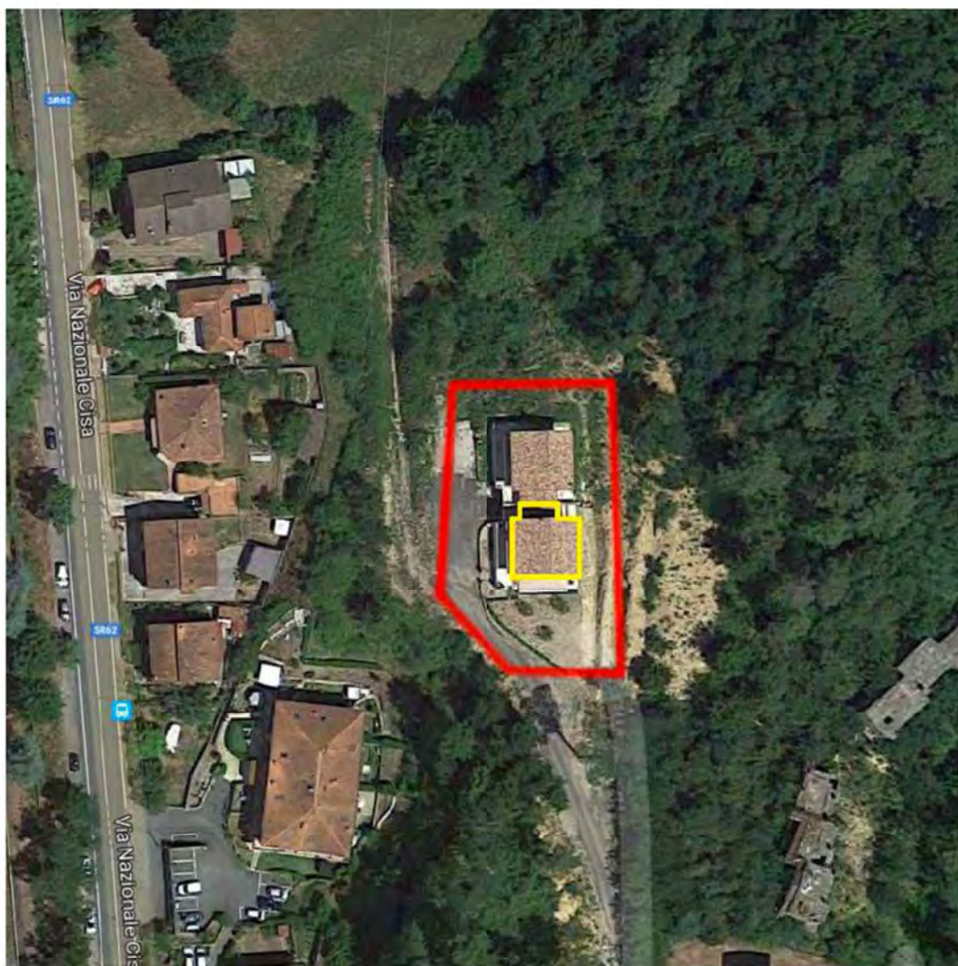
Foto Aerea dell'area: Via dei Pini, Licciana Nardi. Lotto 001. In giallo l'edificio..