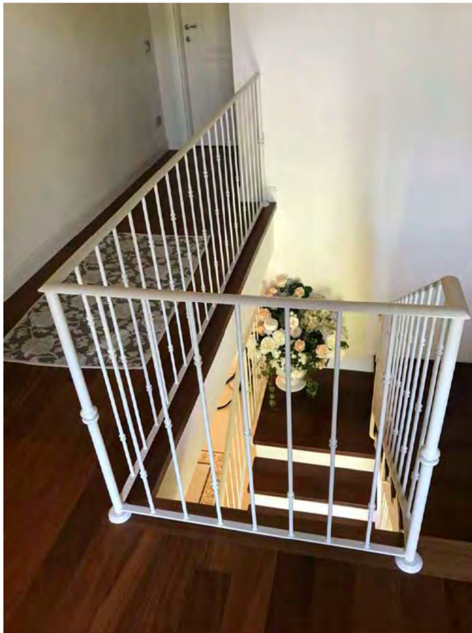
Foto 18: Via dei Pini Licciana Nardi. Lotto 001. Interno Piano Primo. Disimpegno vano scale.