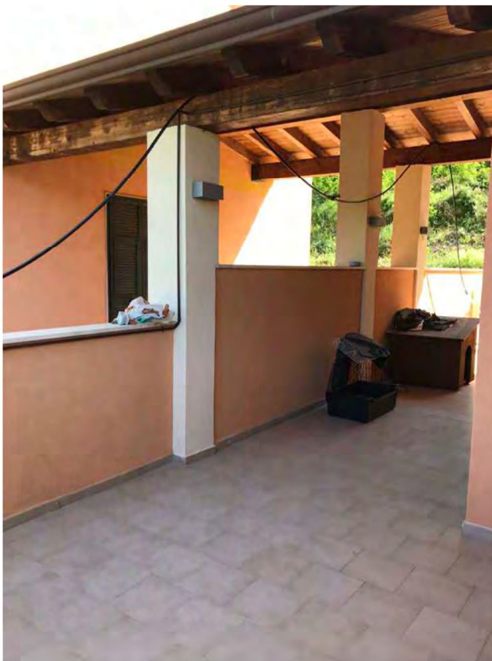
Foto E5: Via dei Pini Licciana Nardi. Lotto 001. Esterno. Portico.