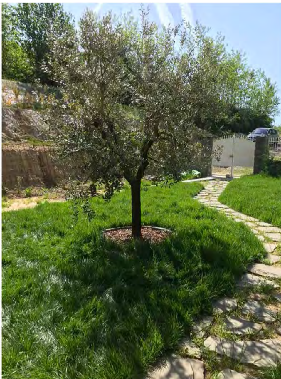
Foto E3: Via dei Pini, Licciana Nardi. Lotto 001. Esterno Abitazione