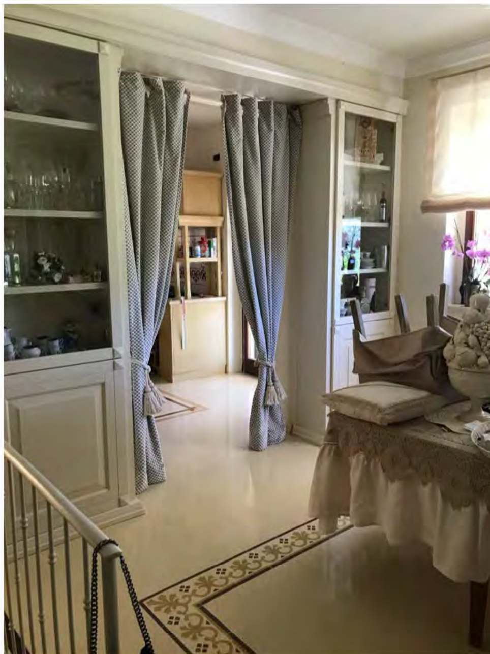
Foto 13: Via dei Pini Licciana Nardi. Lotto 001. Interno Piano Terra Soggiorno-Pranzo.