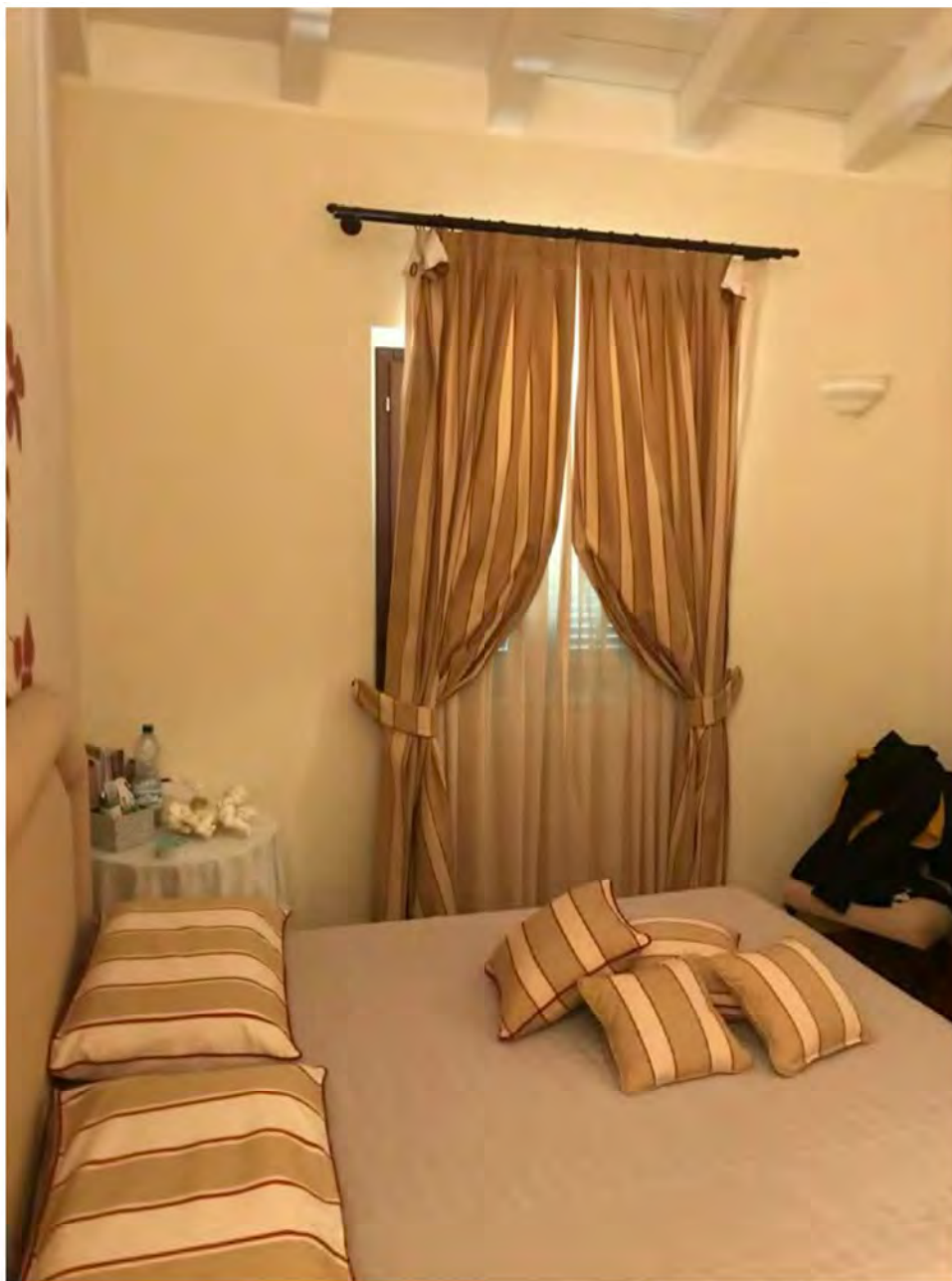
Foto 22: Via dei Pini Licciana Nardi. Lotto 001. Interno Piano Primo. Camera 2.