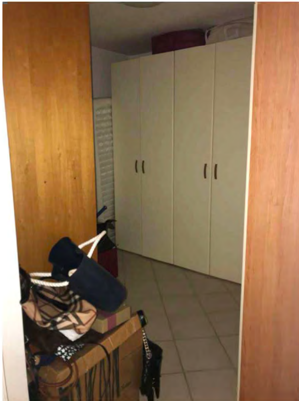
Foto 10: Via dei Pini Licciana Nardi. Lotto 001. Interno Seminterrato. Ambiente 3.