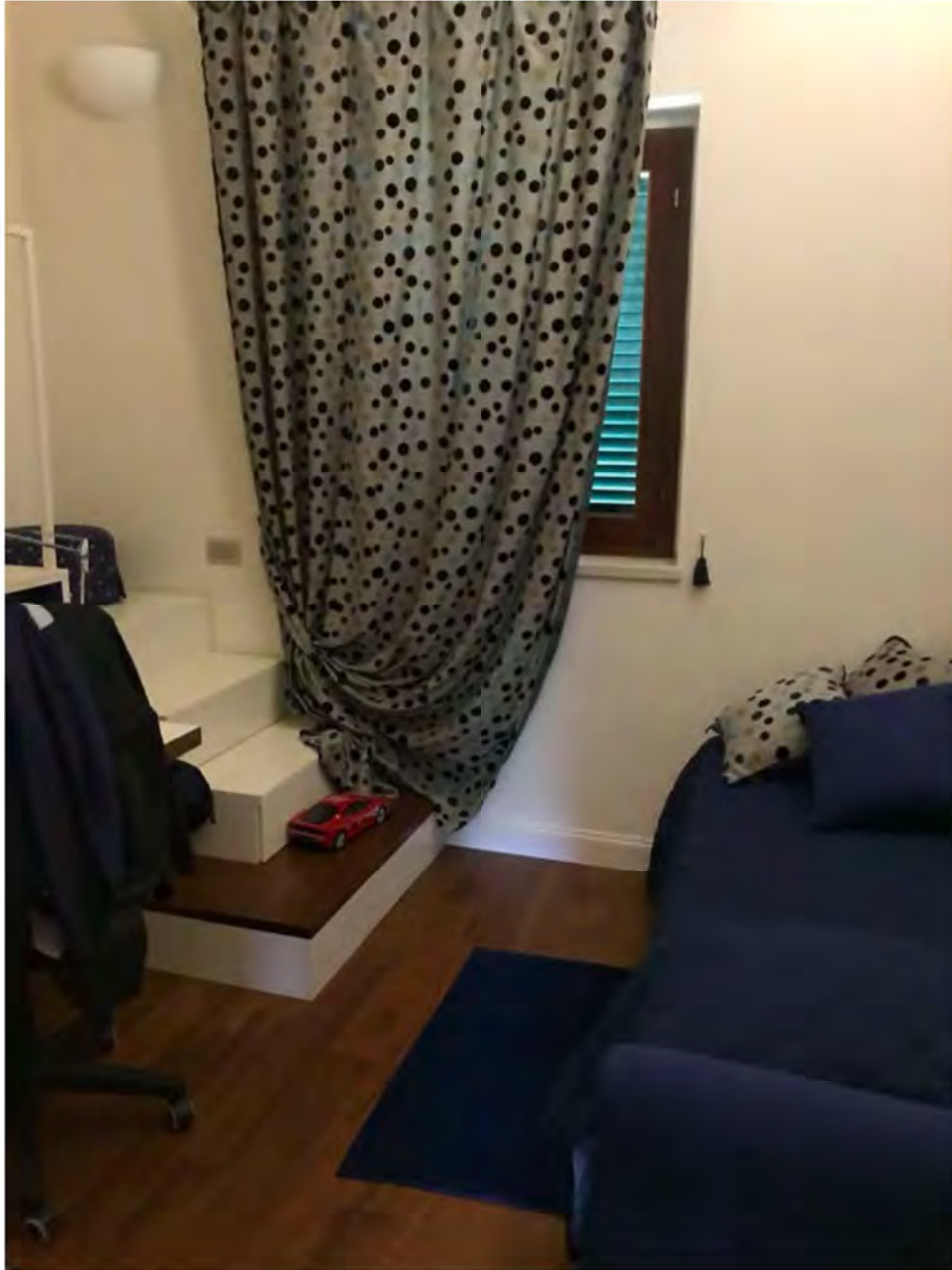
Foto 25: Via dei Pini Licciana Nardi. Lotto 001. Interno Piano Primo. Camera 3.