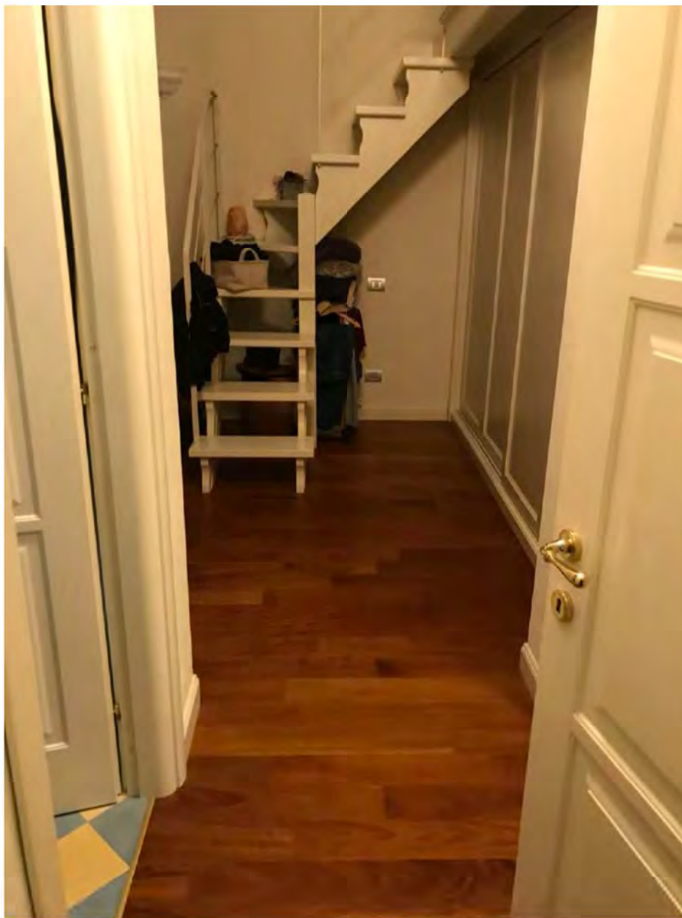
Foto 21: Via dei Pini Licciana Nardi. Lotto 001. Interno Piano Primo. Soppalco cabina armadio.