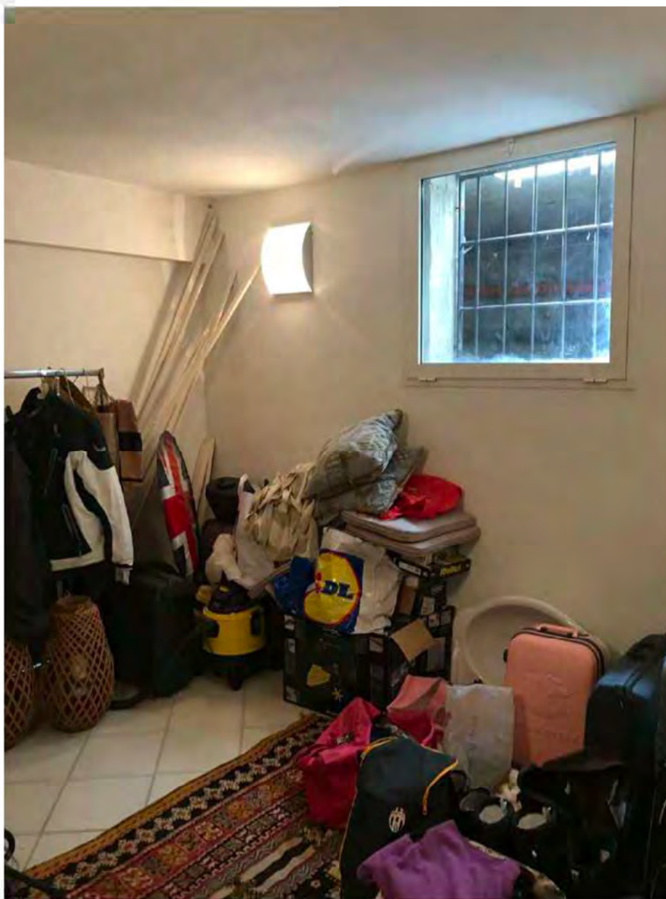
Foto 9: Via dei Pini Licciana Nardi. Lotto 001. Interno Seminterrato. Ambiente 2.