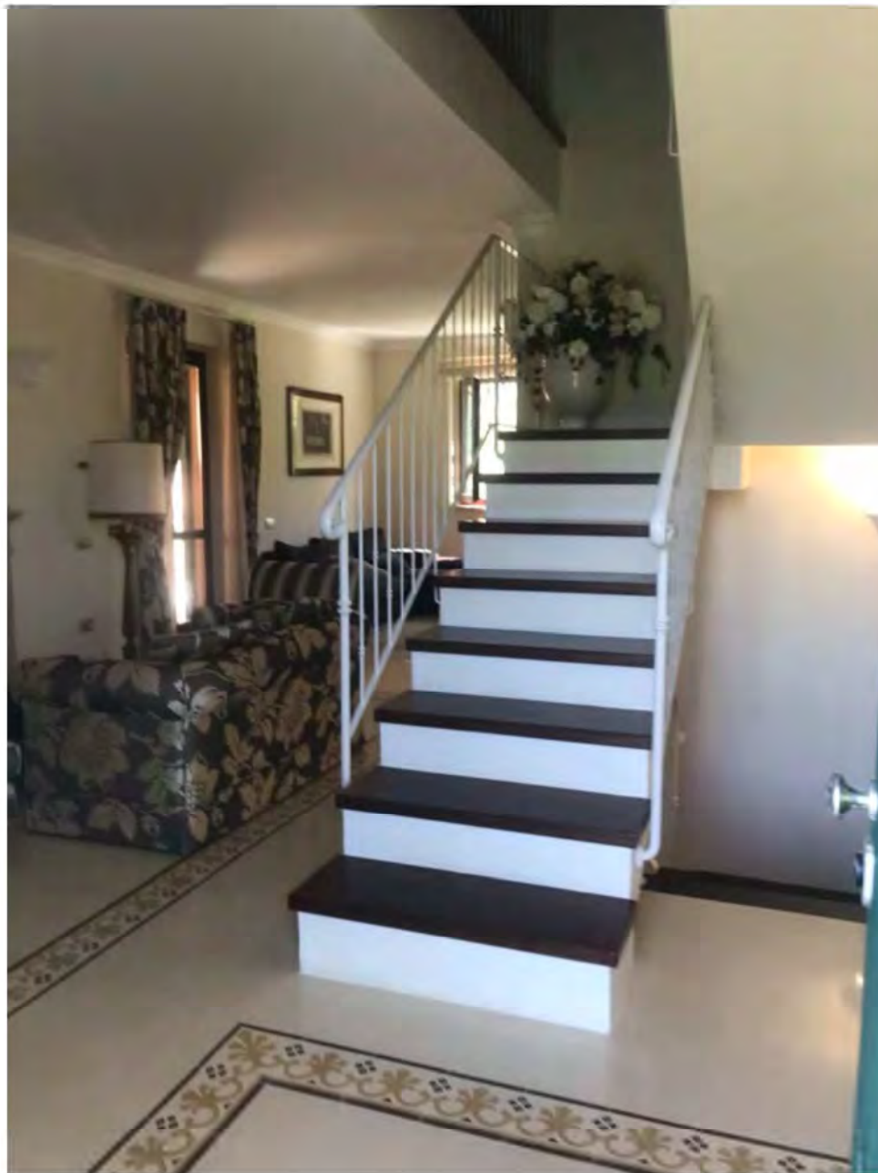
Foto 11: Via dei Pini Licciana Nardi. Lotto 001. Interno Piano Terra. ingresso.