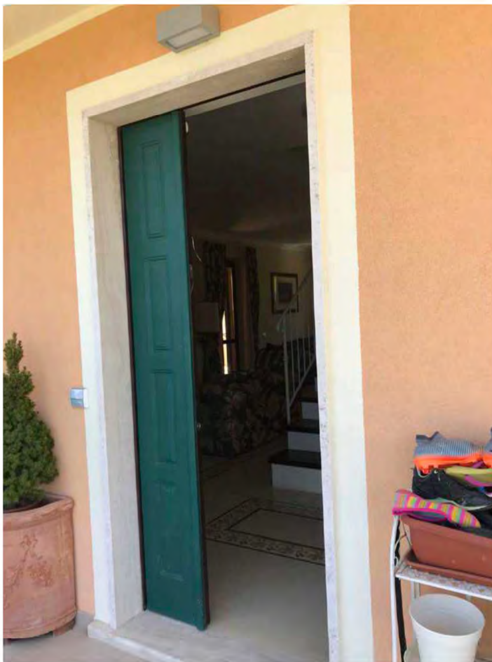
Foto E4: Via dei Pini, Licciana Nardi. Lotto 001. Esterno. Ingresso Abitazione.