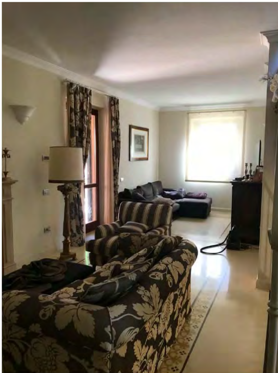
Foto 16: Via dei Pini Licciana Nardi. Lotto 001. Interno Piano terra. Soggiorno.