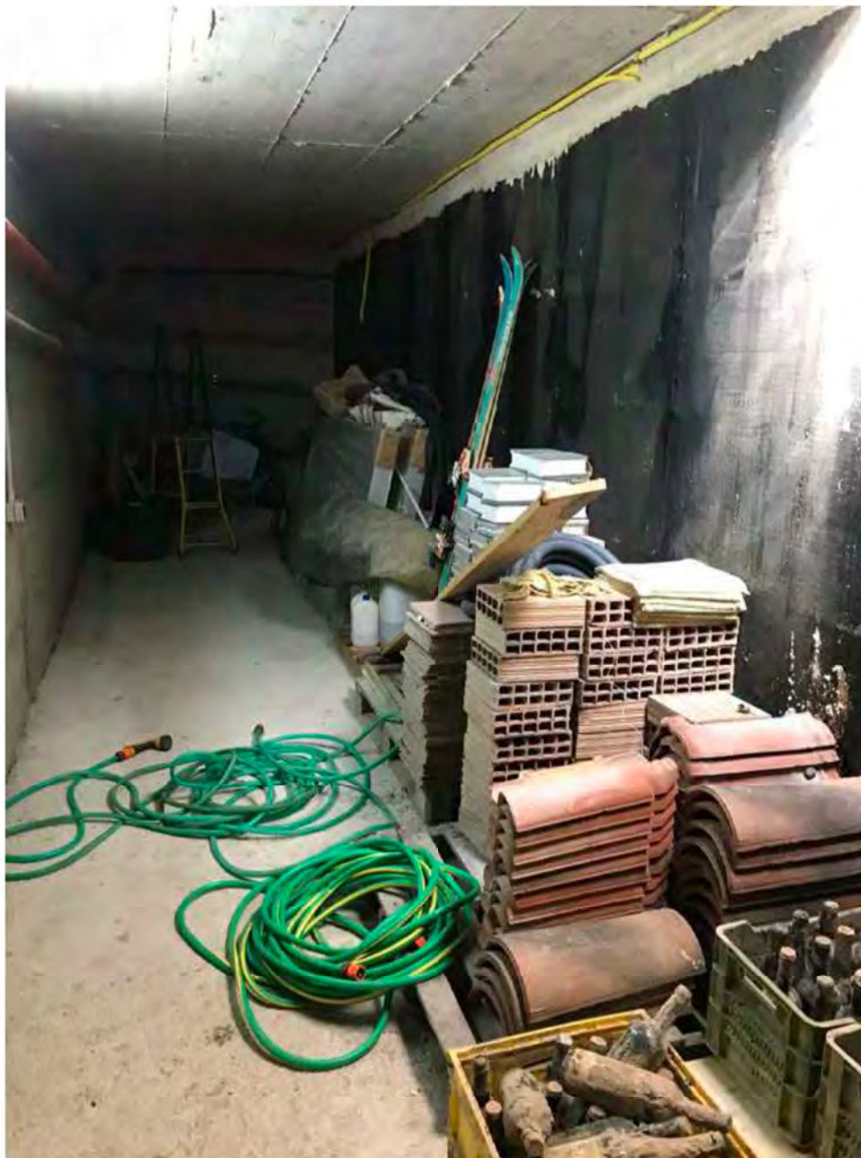
Foto 4: Via dei Pini Licciana Nardi. Lotto 001. Interno Seminterrato. Intercapedine.