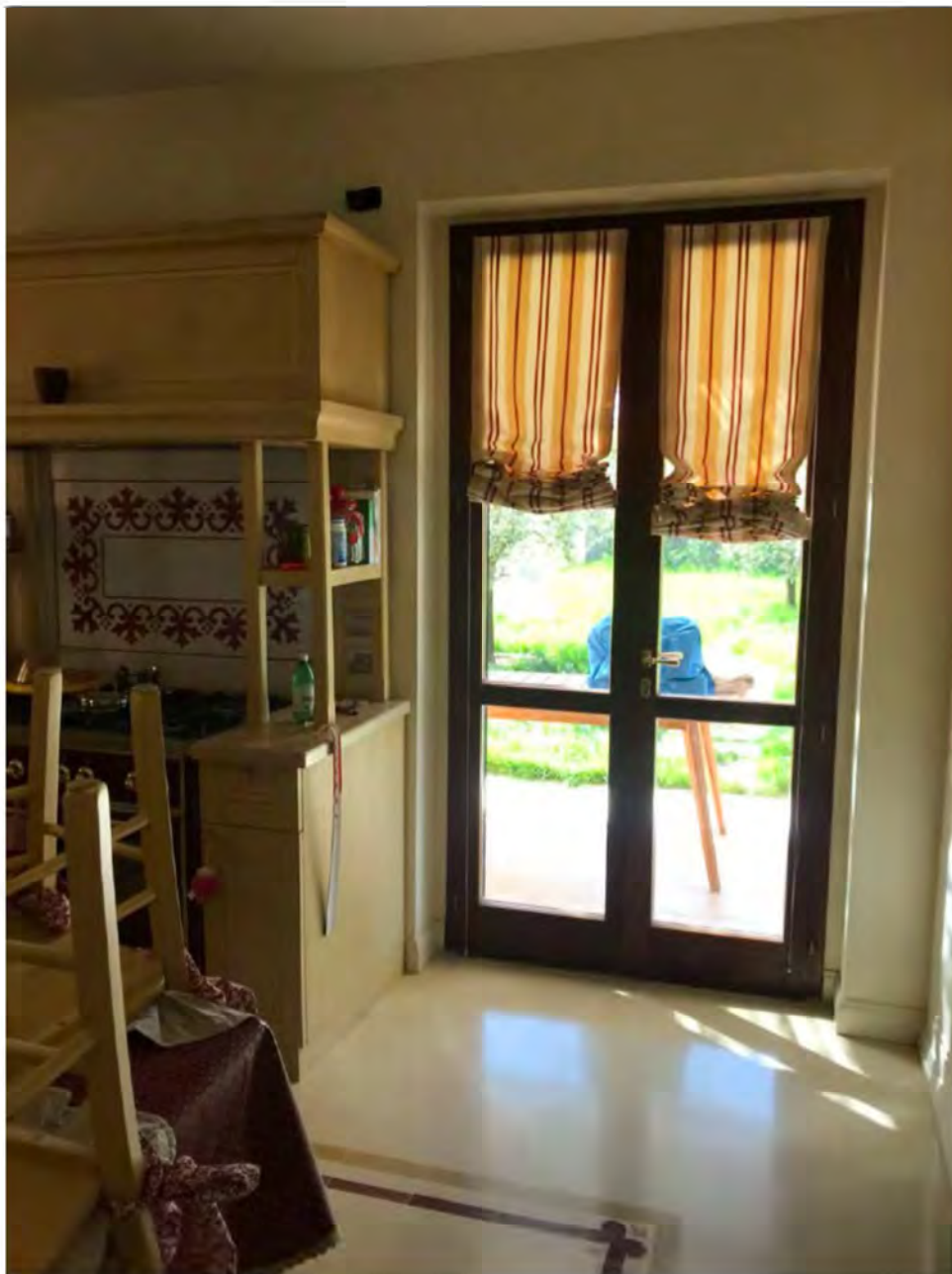
Foto 14: Via dei Pini Licciana Nardi. Lotto 001. Interno Piano Terra Cucina.