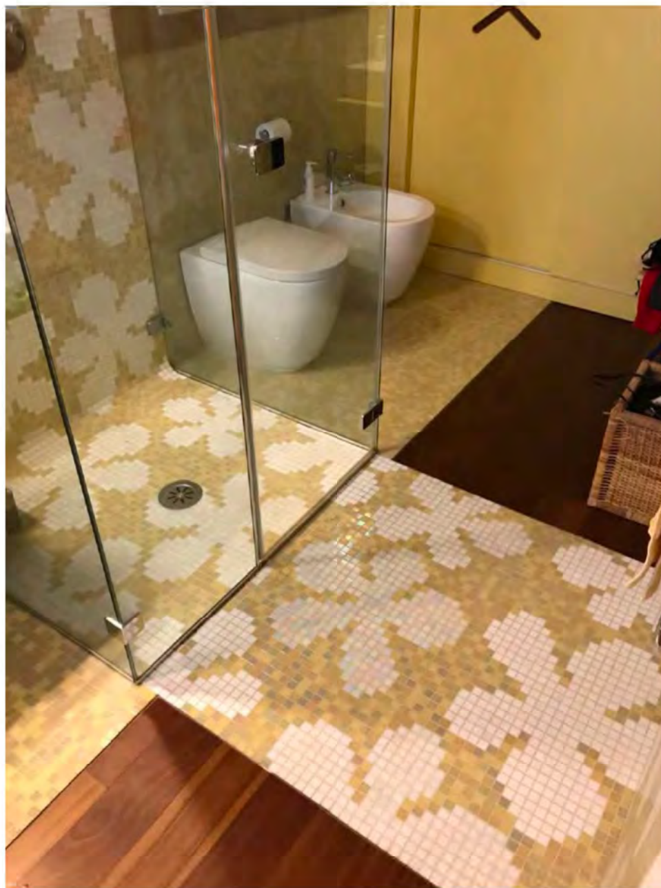
Foto 20: Via dei Pini Licciana Nardi. Lotto 001. Piano Primo. Bagno 1.