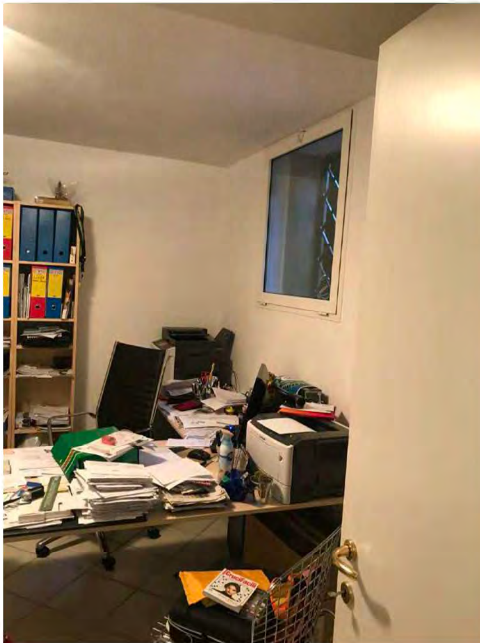
Foto 8: Via dei Pini Licciana Nardi. Lotto 001. Interno Ambiente 1.