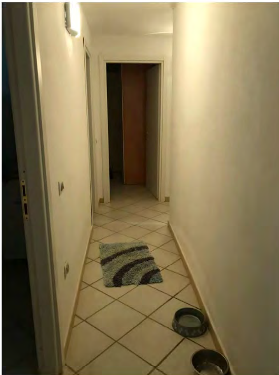
Foto 6: Via dei Pini Licciana Nardi. Lotto 001. Interno Seminterrato. Ingresso .