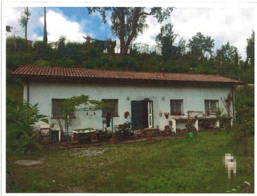
Foto 1 – Fabbricato mappale 820 (corpo D) e corte mappale 281 (corpo C)