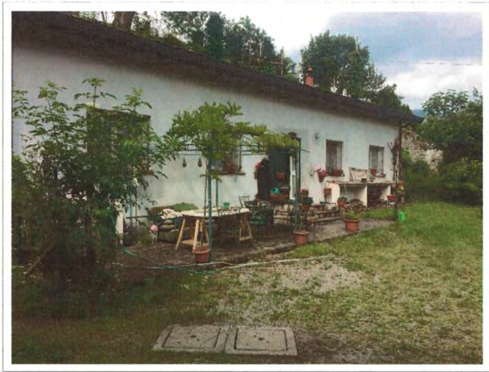
Foto 3– Fabbricato mappale 820 (corpo D) e corte mappale 281 (corpo C)