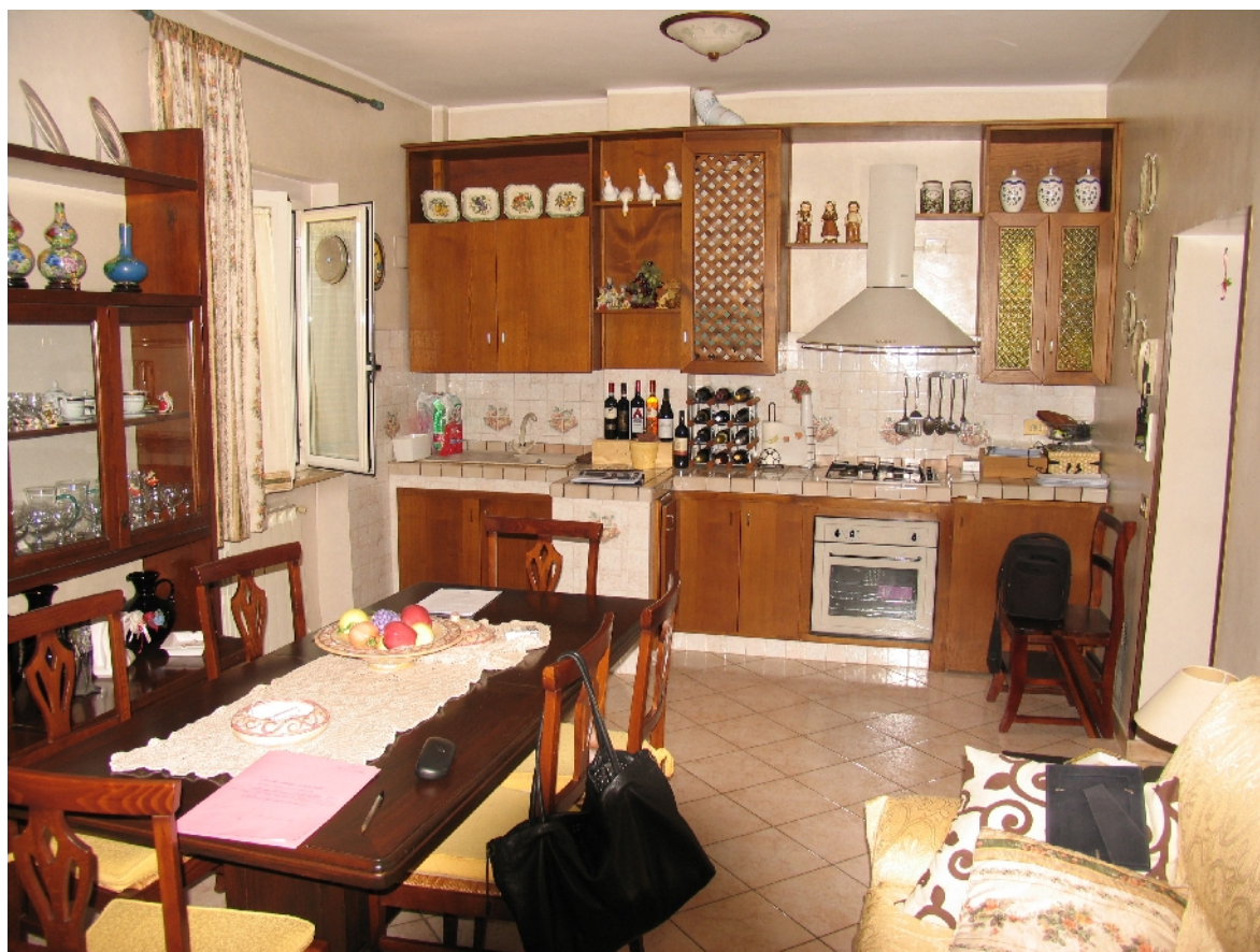
CUCINA - PRANZO