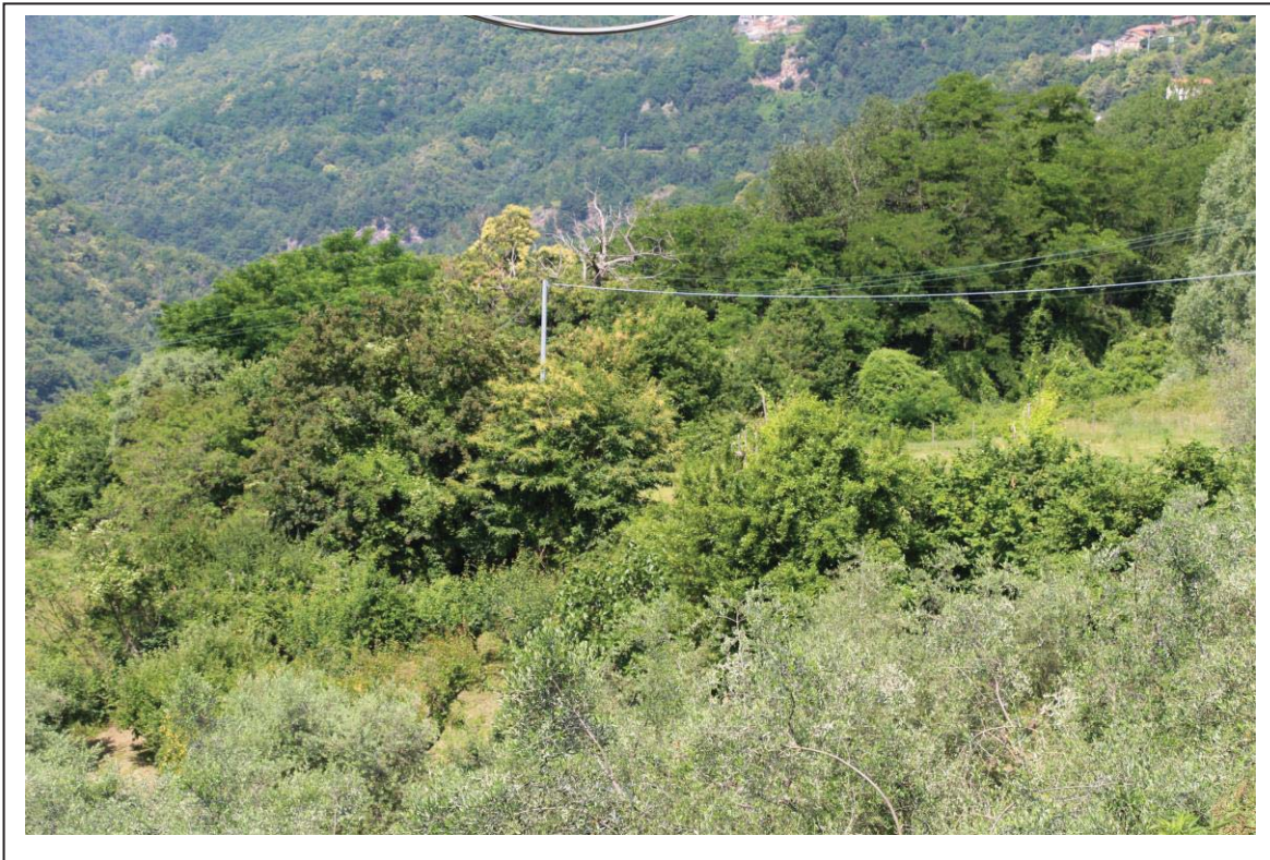
Veduta terreni al foglio 163 mappali 54-127-55-56