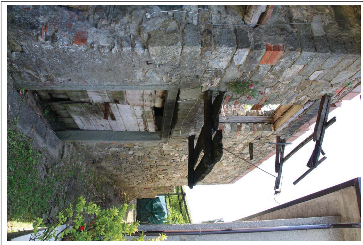
Veduta esterna del fabbricato al foglio 163 mappale 117