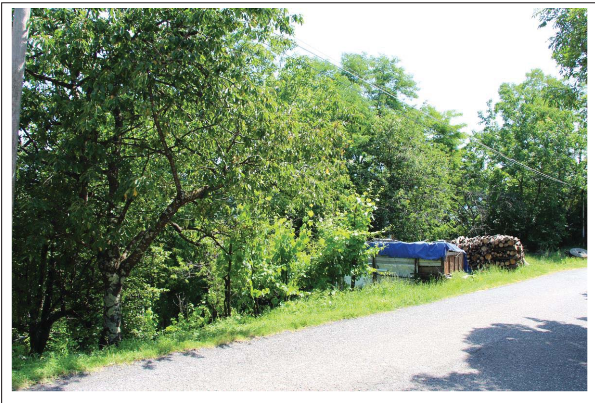
Veduta terreno al foglio 163 mappale 77