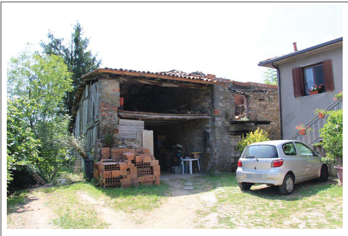
Veduta esterna fabbricato al foglio 163 mappale 117