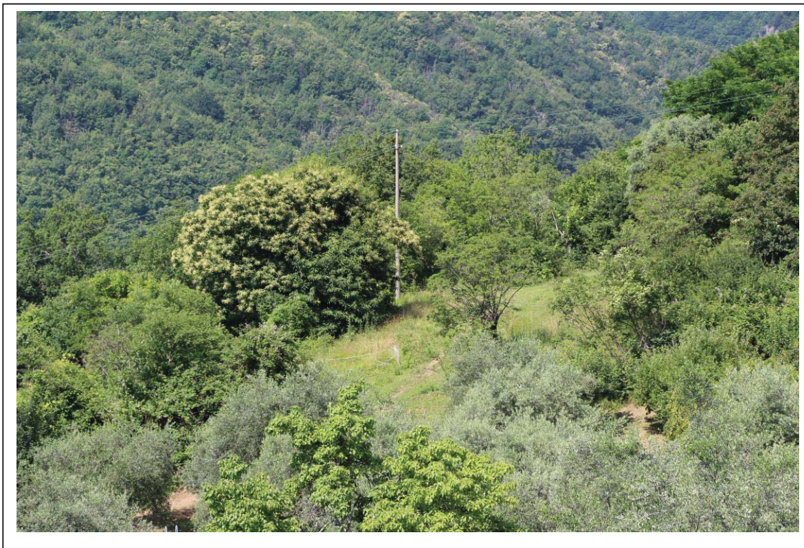
Veduta terreni al foglio 163 mappali 54-127-55-56