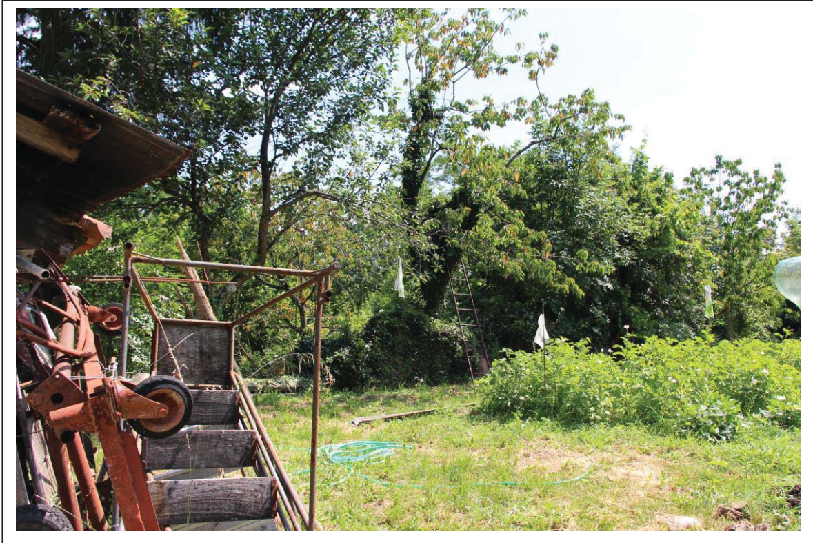
Veduta terreni al foglio 163 mappali 122-123