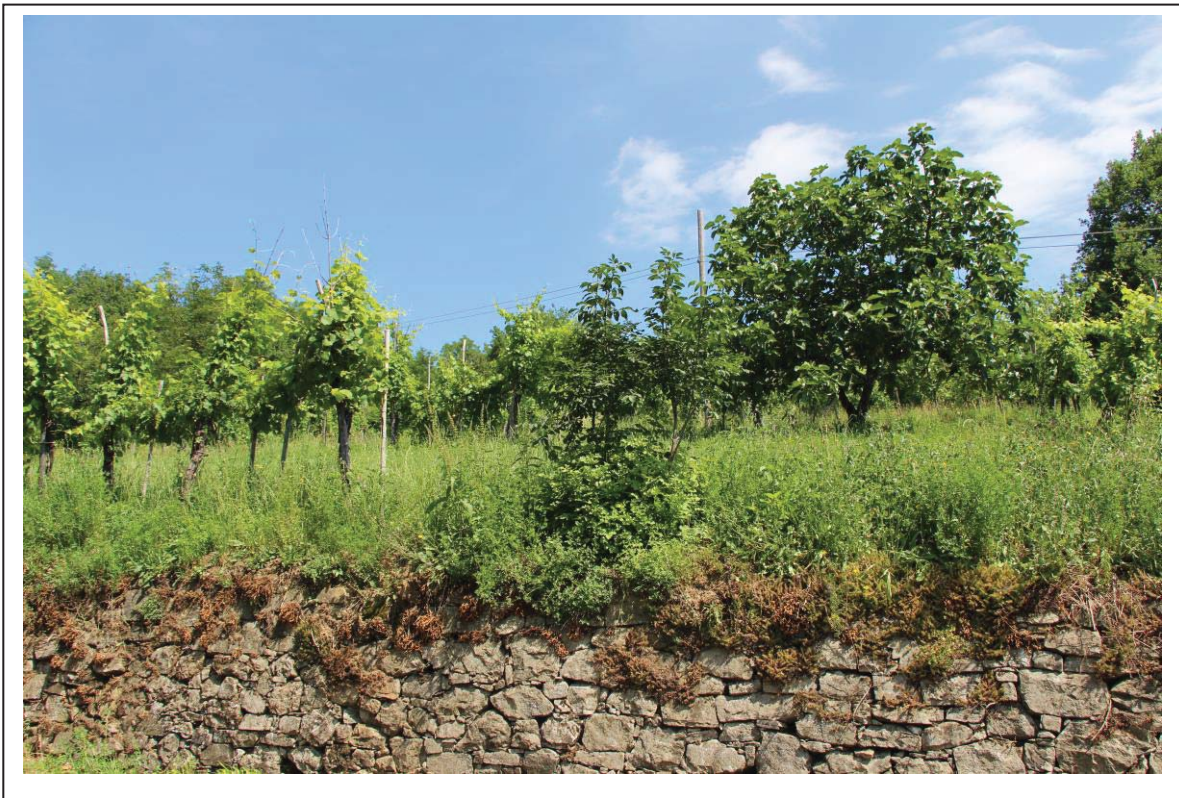
Veduta terreno al foglio 163 mappale 70