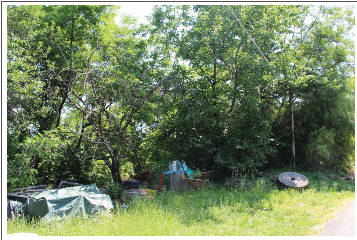
Veduta terreno al foglio 163 mappale 77