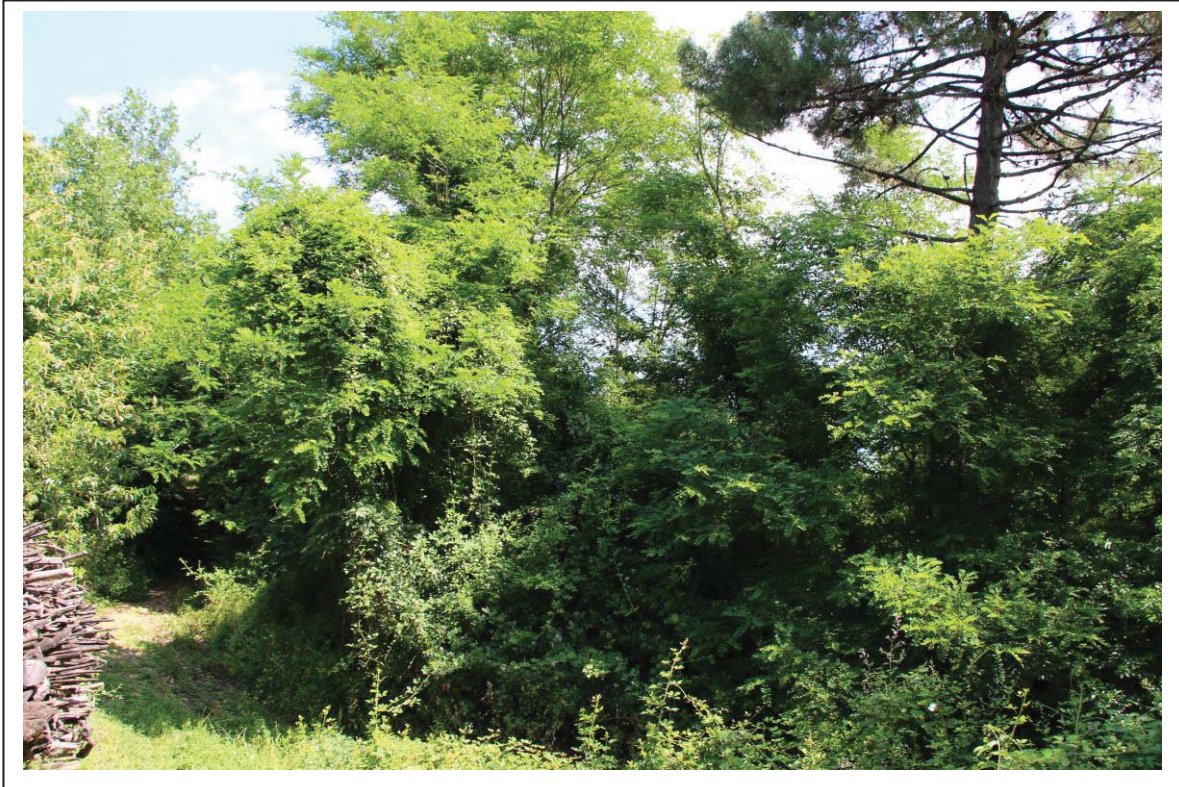
Veduta terreni al foglio 163 mappale 14-13