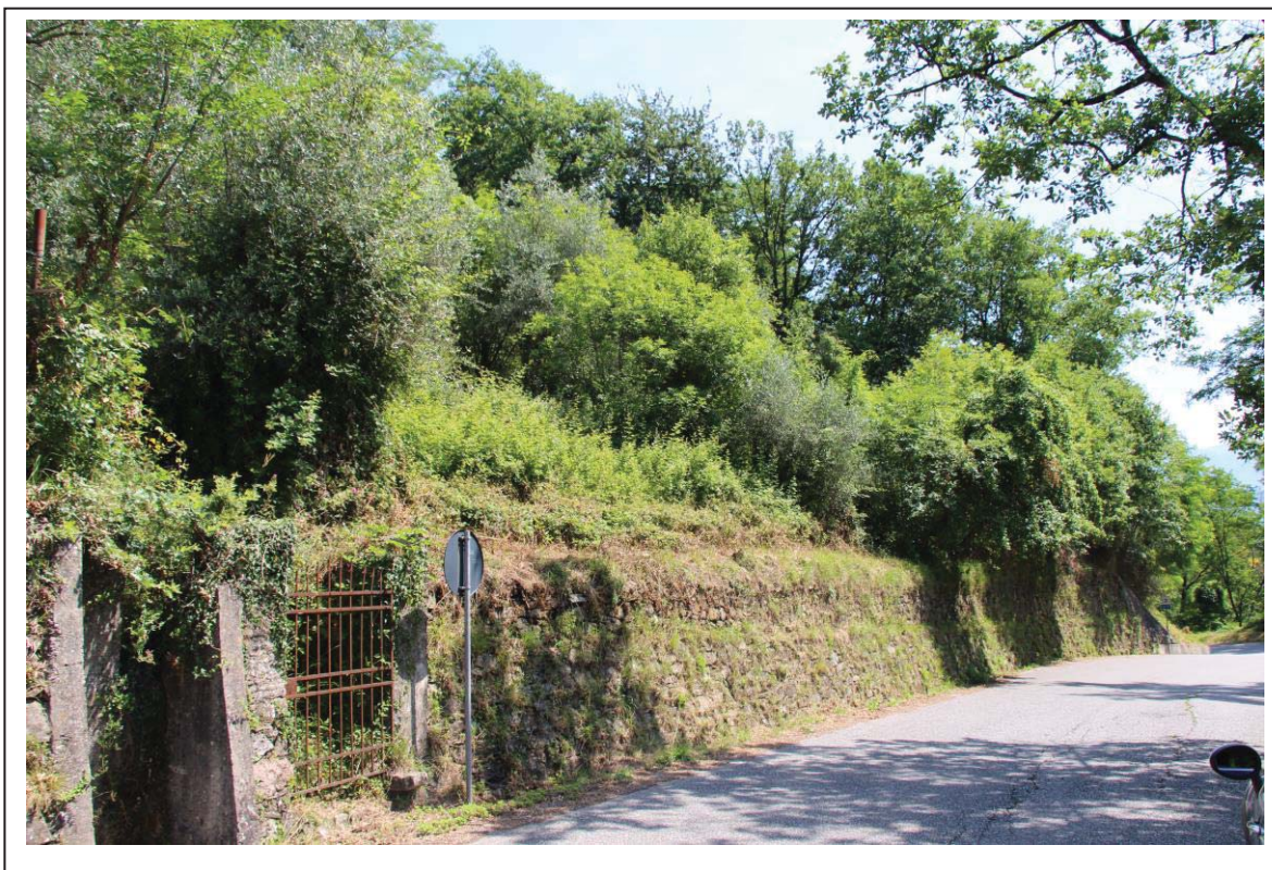
Veduta terreni al foglio 159 mappale 359-358