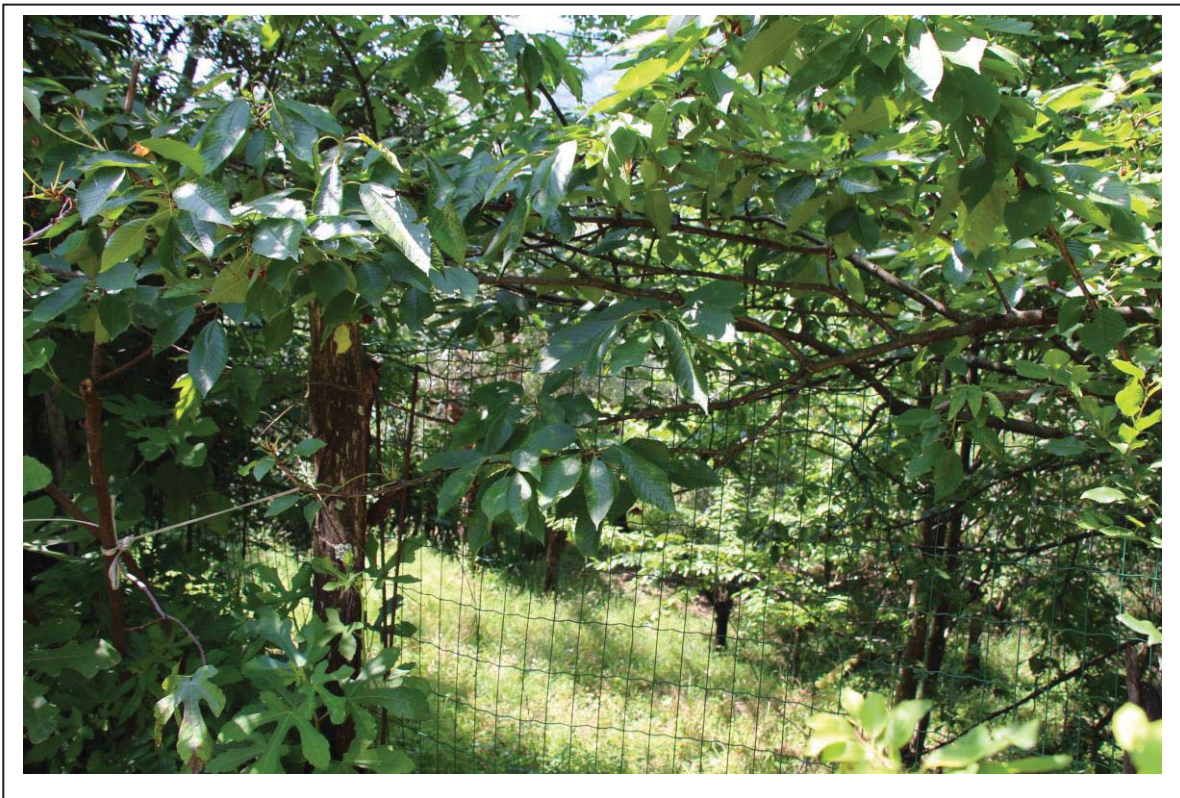
Veduta terreni al foglio 163 mappali 119-120-121