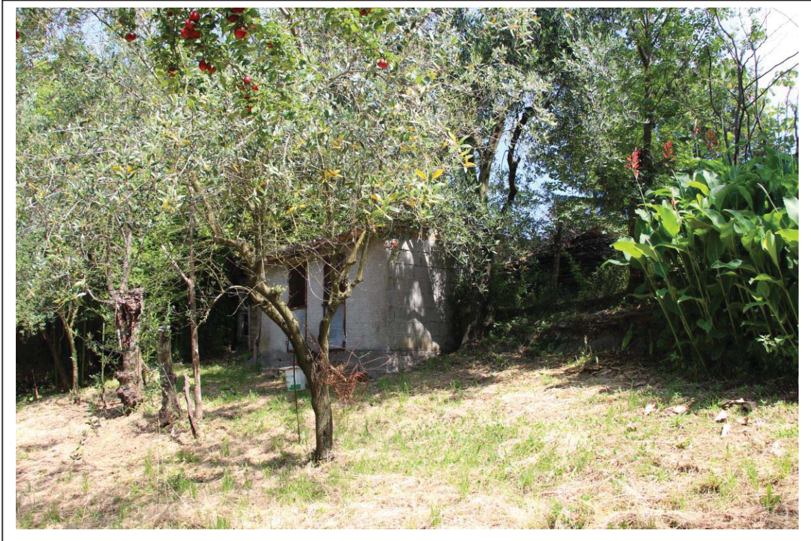
Veduta terreni al foglio 163 mappali 122-123 ( con fabbricato abusivo )