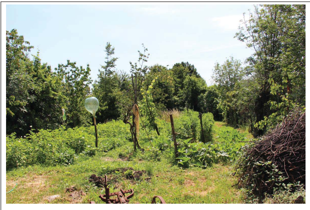
Veduta terreni al foglio 163 mappali 122-123