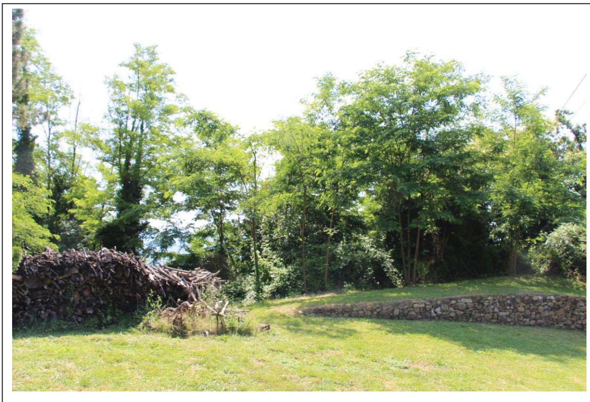
Veduta terreni al foglio 163 mappali 14-13