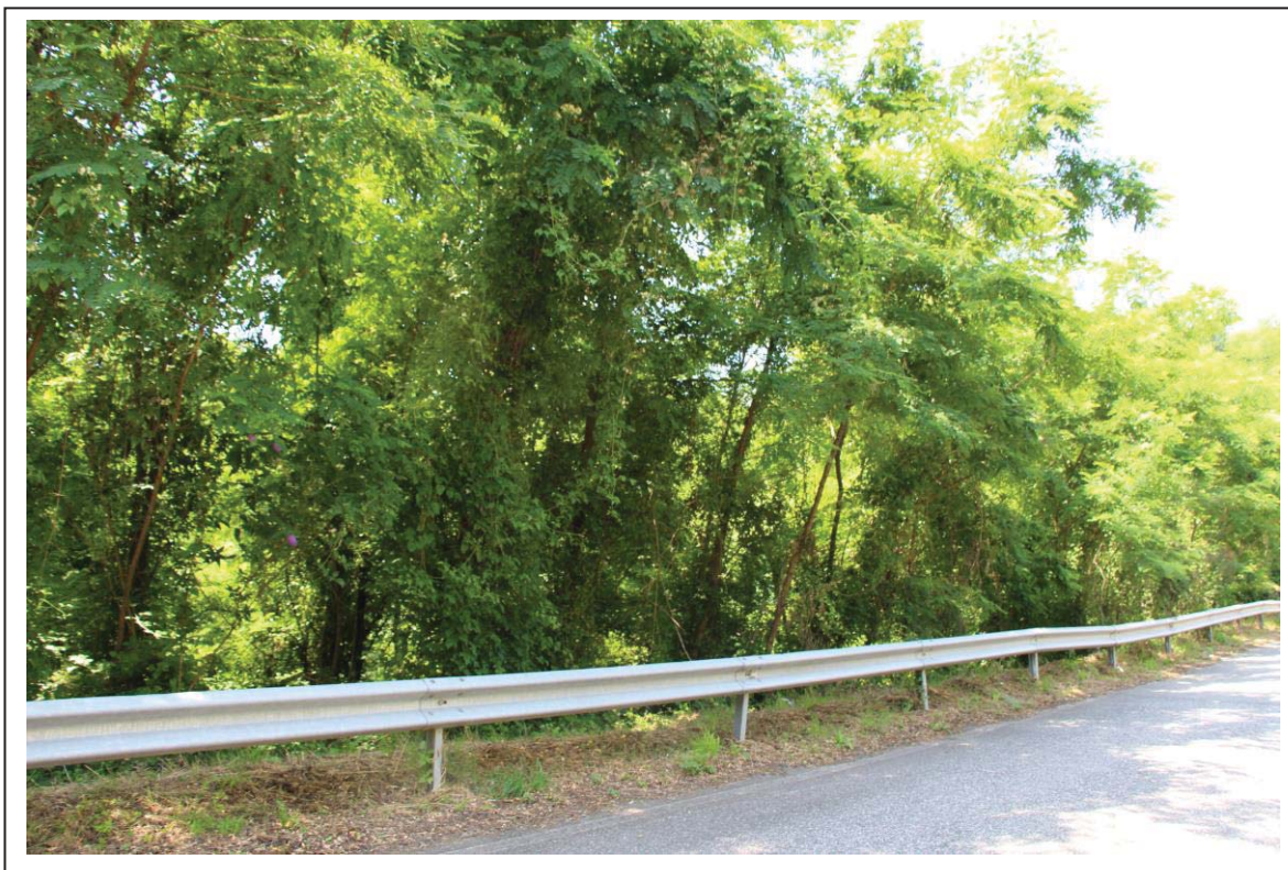
Veduta terreno al foglio 159 mappale 85