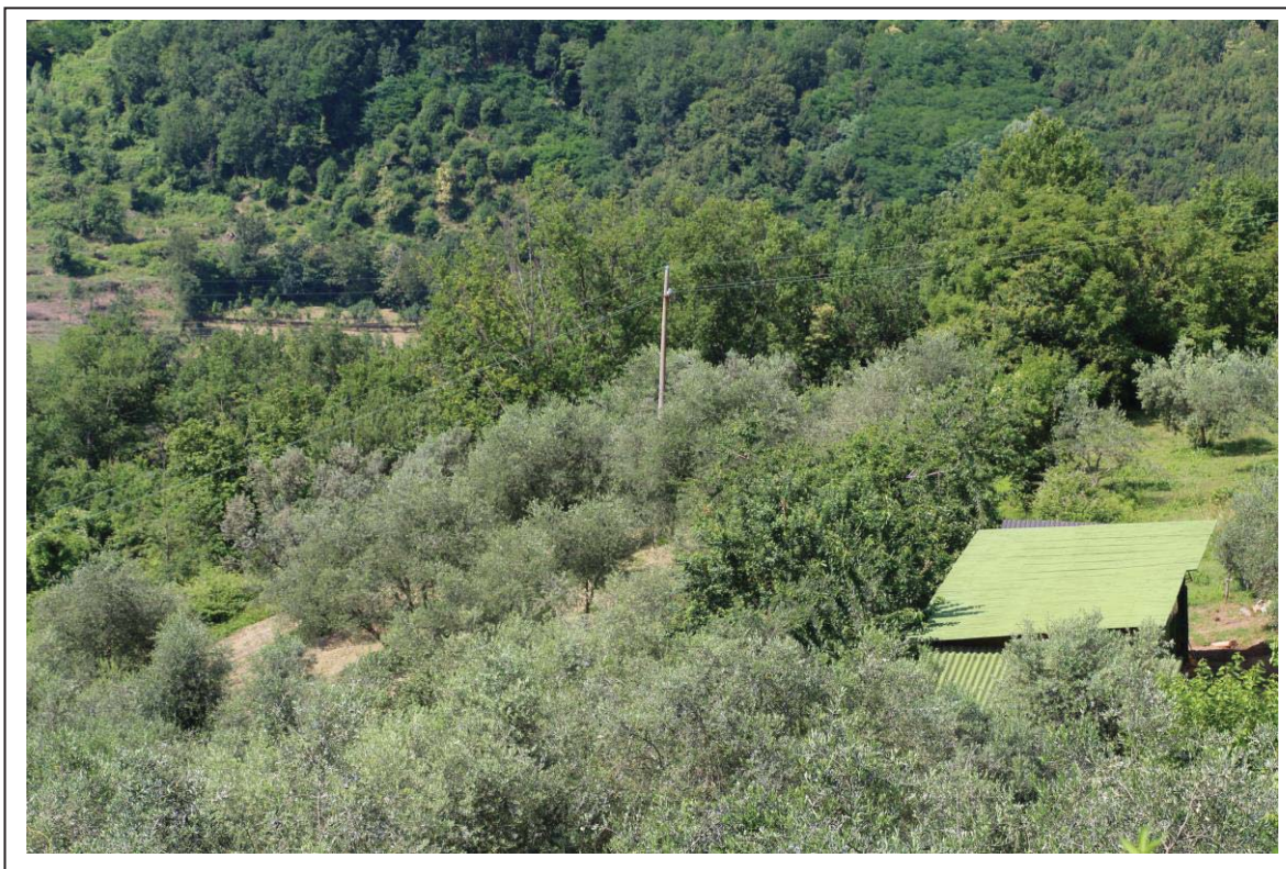
Veduta terreno al foglio 163 mappale 62