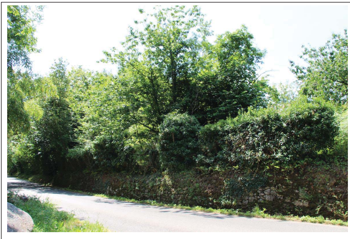
Veduta terreno al foglio 163 mappale 123