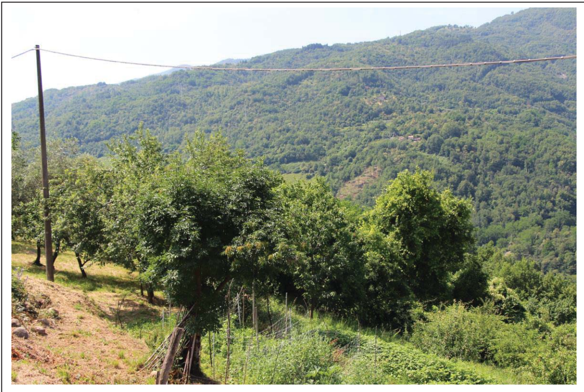
Veduta terreno al foglio 163 mappale 65