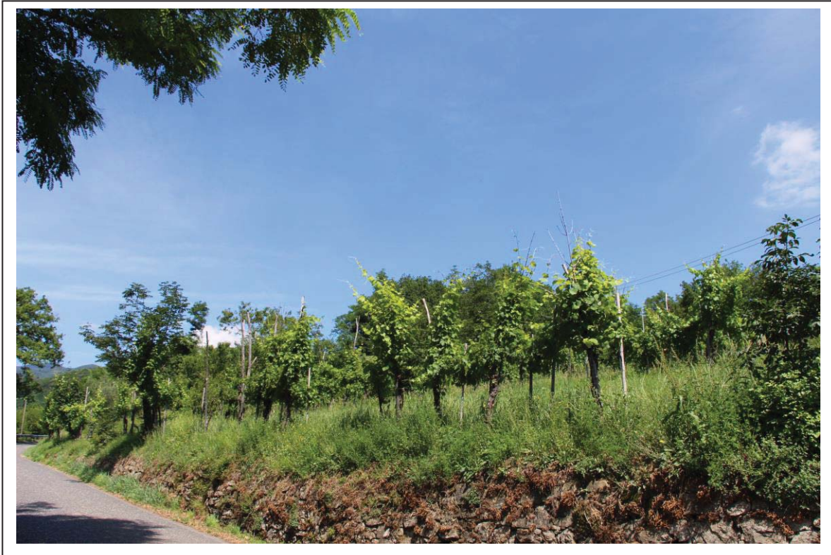
Veduta terreno al foglio 163 mappale 70