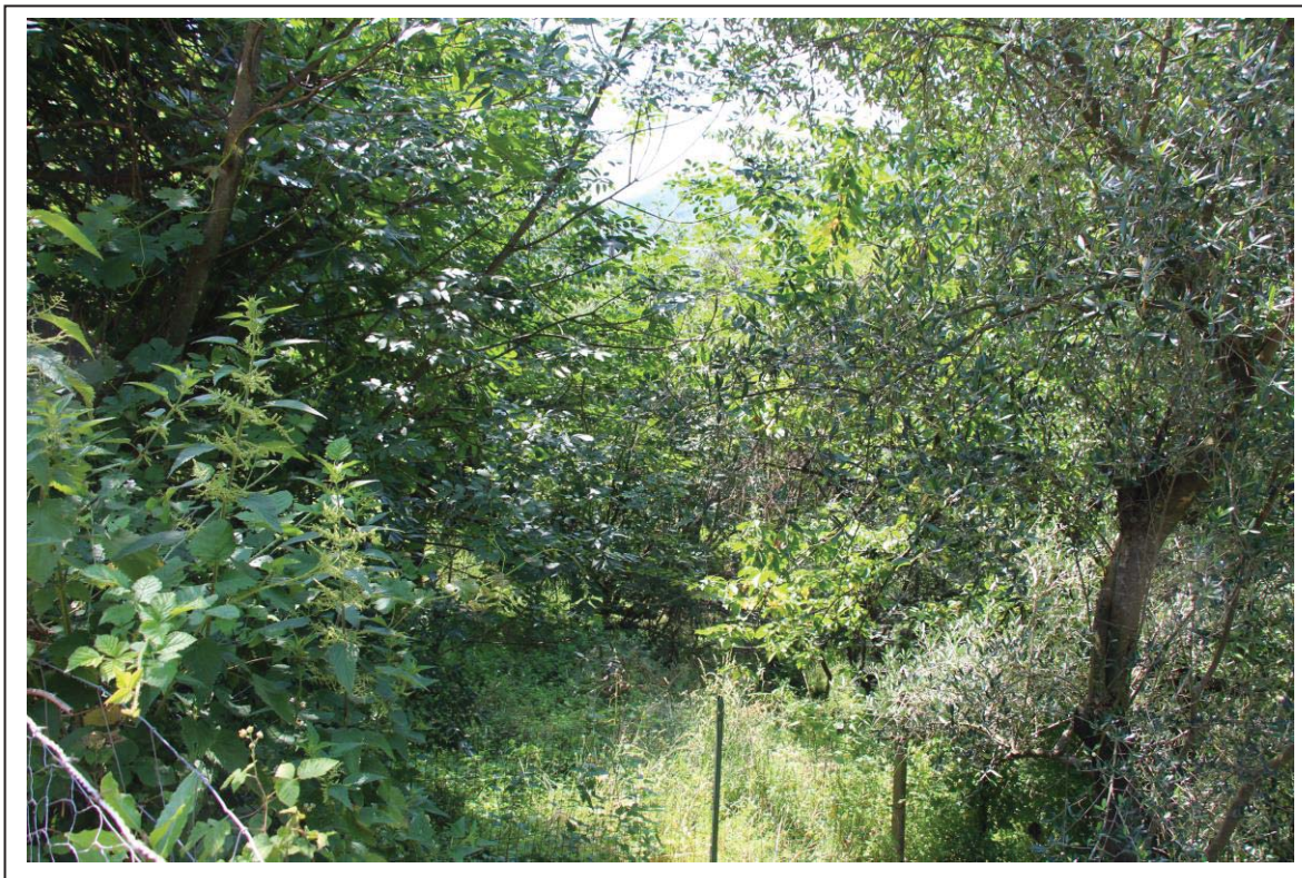
Veduta terreni al foglio 163 mappali 119-120-121