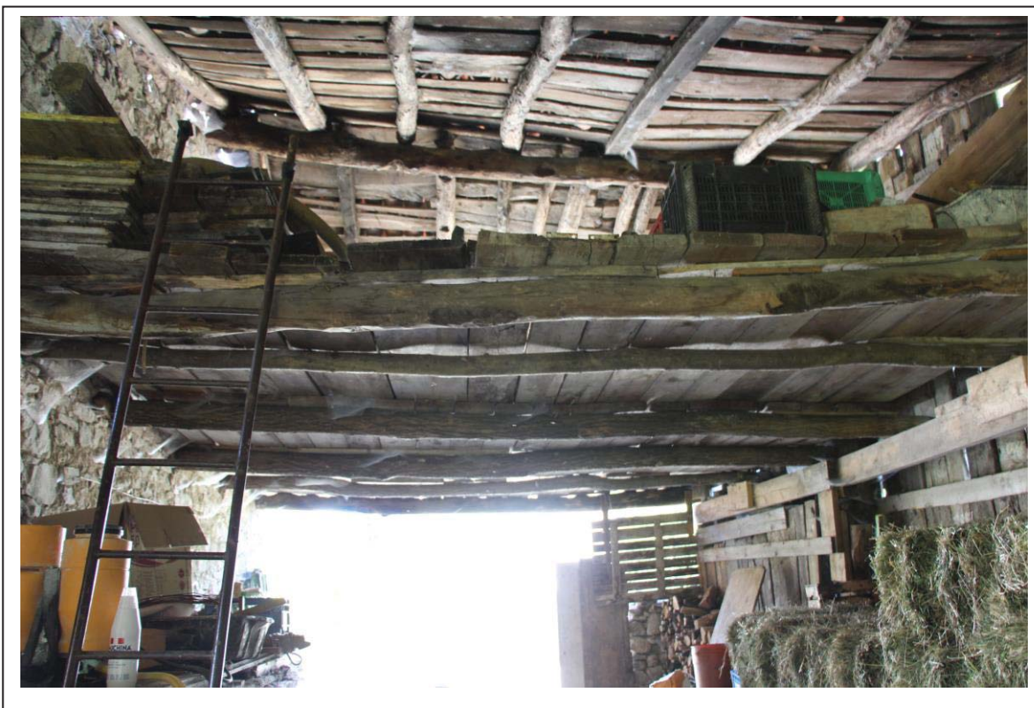
Veduta interna del fabbricato al foglio 163 mappale 117