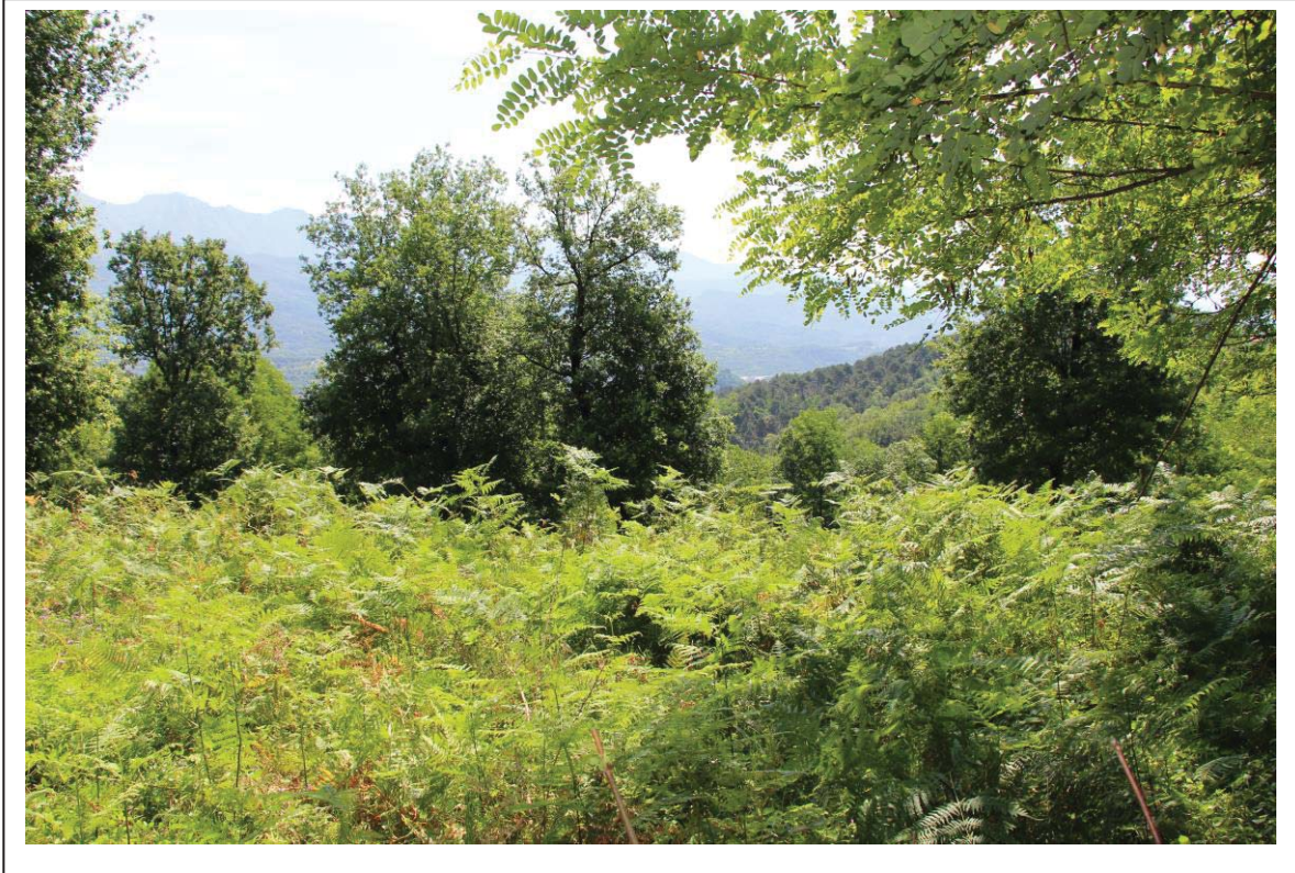
Veduta terreno al foglio 159 mappale 336