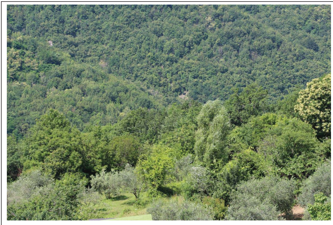
Veduta terreni al foglio 163 mappali 58-60