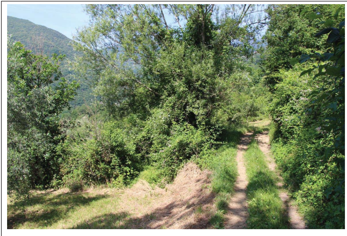
Veduta terreno al foglio 163 mappale 65