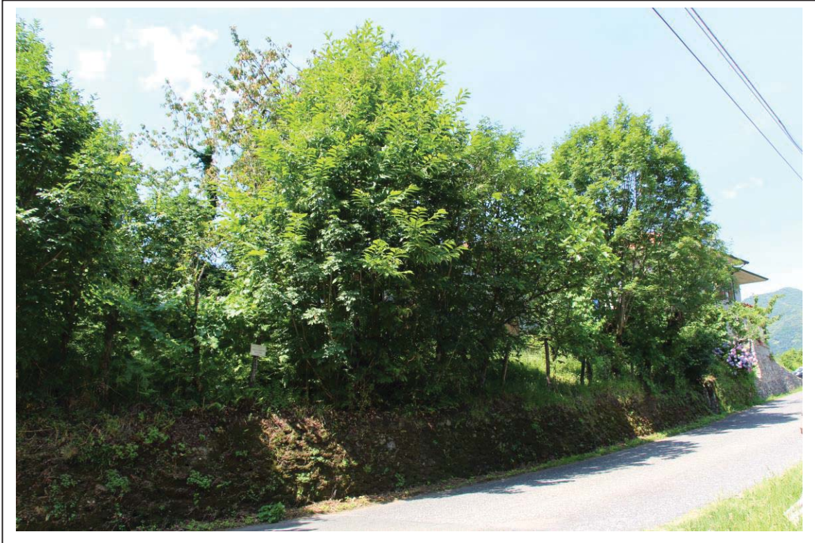
Veduta terreno al foglio 163 mappale 123