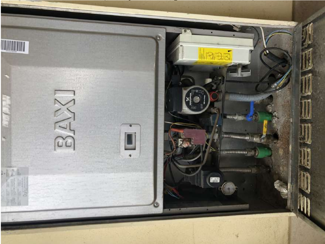
P.V. 40 (Vista particolare generatore di calore)